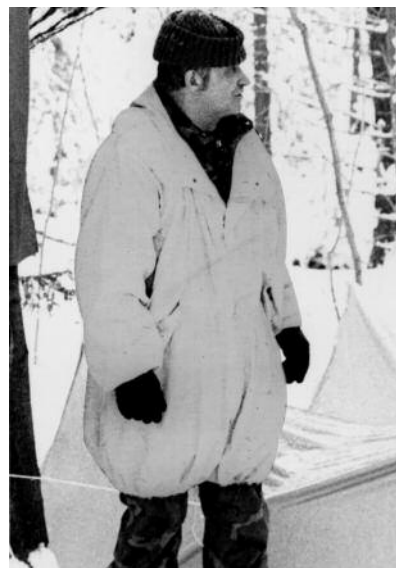
UOSIS Miško Brolių Skautų Kūčiose 1984 m.