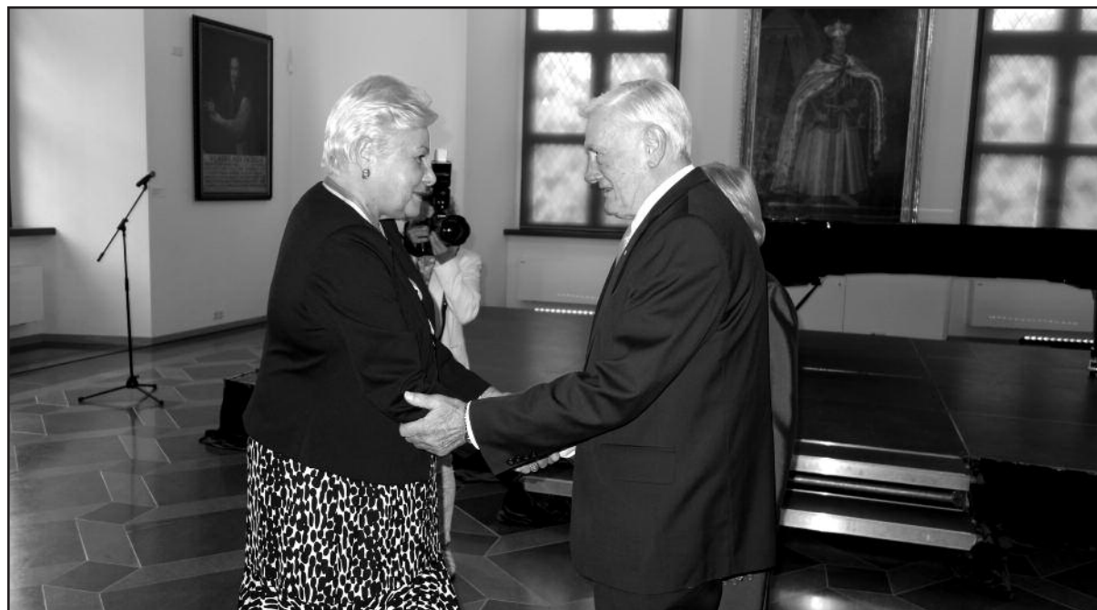
Tête-à-tête su Prezidentu Valdu Adamkumi XV PLB Seimo atidarymo metu Valdovų rūmuose.

Tačiau neužmirštame ir tų, kurie visai atitole, – galvojame apie juos ir norime pritraukti. Žinotume jų adresus, pasiųstume jiems nors naujienlaiškį,