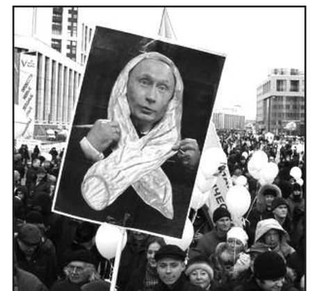
2011 m. per visą Rusiją nuvilnijo didžiuliai nepasitenkinimo mitingai.

Aukšta JAV diplomatė Victoria Nuland, viešėjusi Kijeve, dėl minėto balsavimo parlamente kalbėjo apie „istorinę dieną“ krizės kamuojamai šaliai.