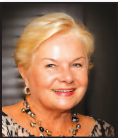
D. Navickienė: Meilė – tai duoti – 10 psl.