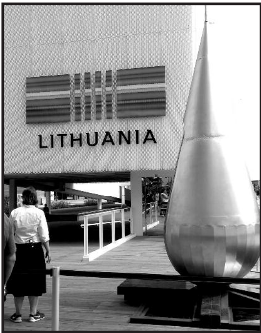
Lietuvos paviljonas pasiruošęs priimti daugiau nei įprasta lankytojų.