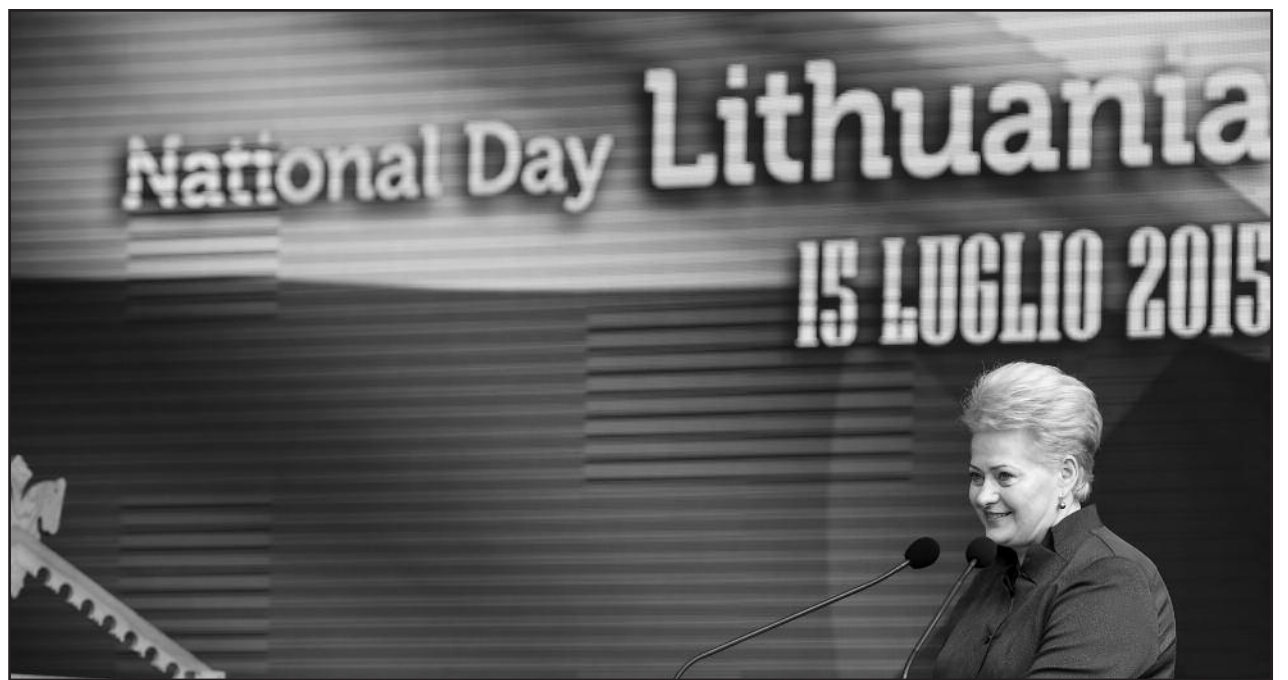
Parodos lankytojus sveikina Lietuvos prezidentė Dalia Grybauskaitė.