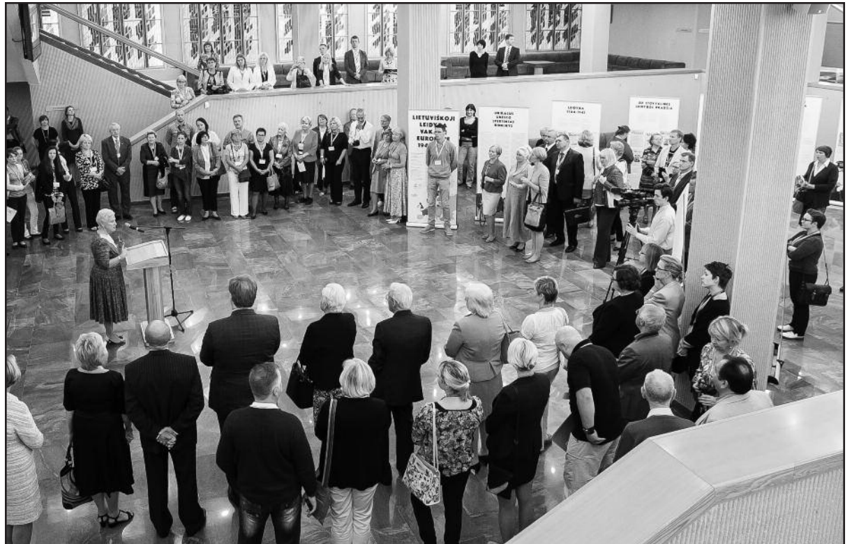
Į parodos atidarymą gausiai susirinkusius vilniečius ir svečius sveikino ir parodą pristatė LR Seimo pirmininkės pavaduotoja Irena Degutienė.