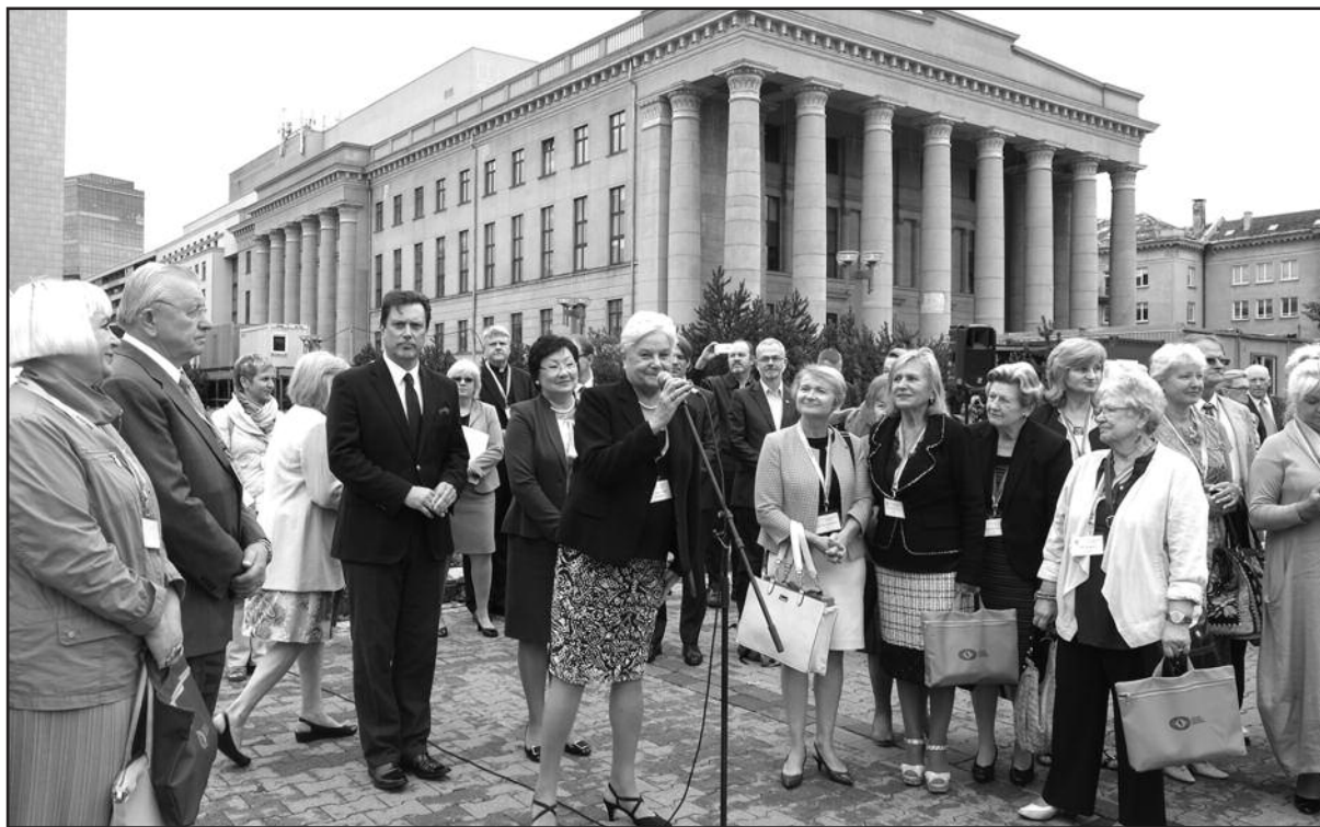
Į XV PLB Seimą susirinkusius lietuvius iš viso pasaulio vėliavos pakėlimo iškilnėse prie Seimo rūmų sveikino PLB pirmininkė D. Navickienė.