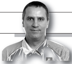
Parengė Dainius Ruževičius