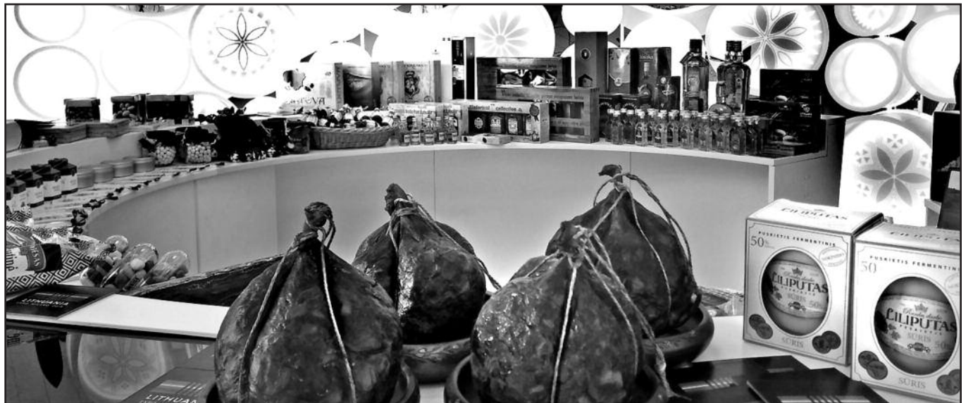
Parodoje Lietuva pristato gražuolius skilandžius, sūrį „Liliputas“, ruginę duoną, midų ir daug kitų lietuviškų ekologiškų ir tautinio paveldo gaminių.

Pirmoji „EXPO“ paroda buvo surengta 1851 m. Londone. Lietuva joje dalyvauja jau 12 kartą. Pirmą kartą neoficiali Lietuvos ekspozicija šioje