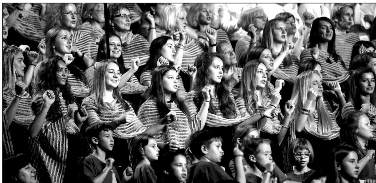
Prisiminimai apie šventę dar labai gyvi. Vėliau juos padės išsaugoti puikus leidinys.