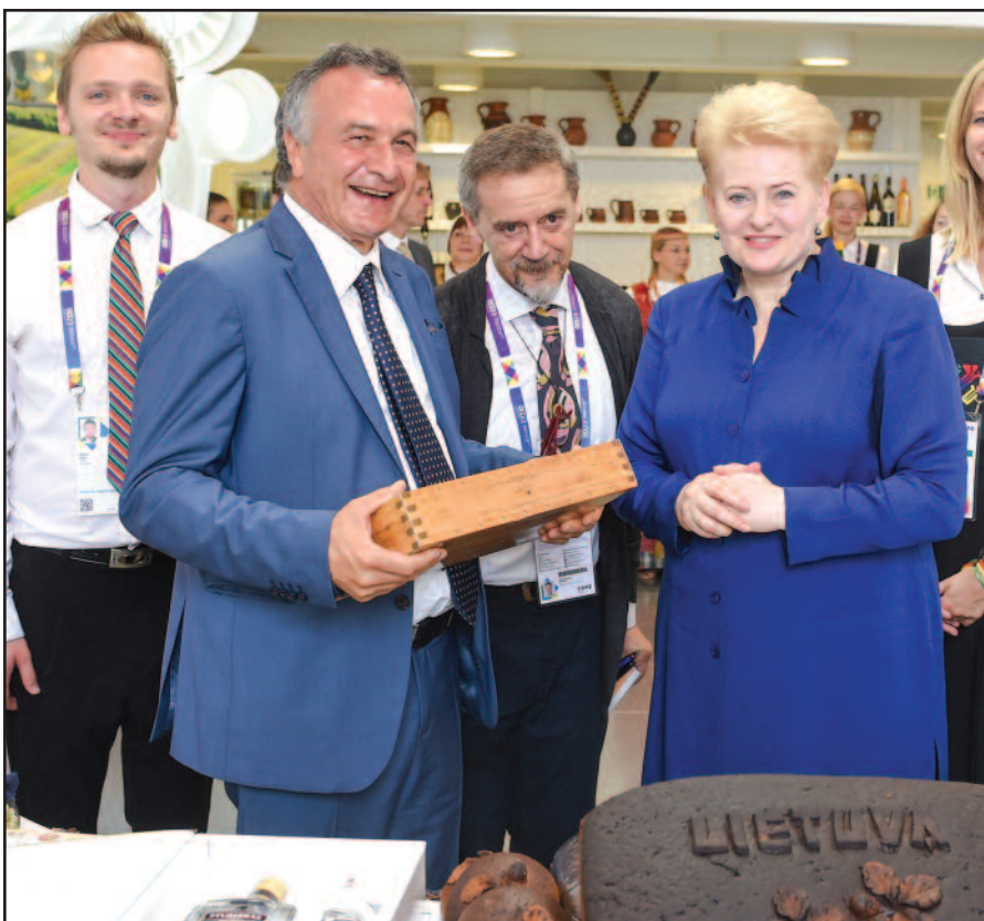
Atidariusi Lietuvos nacionalinę dieną parodoje „EXPO 2015“ Prezidentė Dalia Grybauskaitė kvietė „paragauti Lietuvos“.