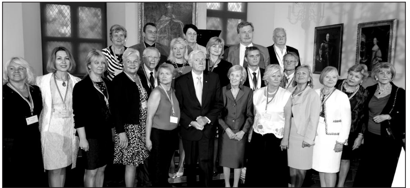
JAV delegacija su Prezidentu V. Adamkumi ir Alma Adamkiene XV PLB Seimo atidarymo iškilmėse Valdovų rūmuose.