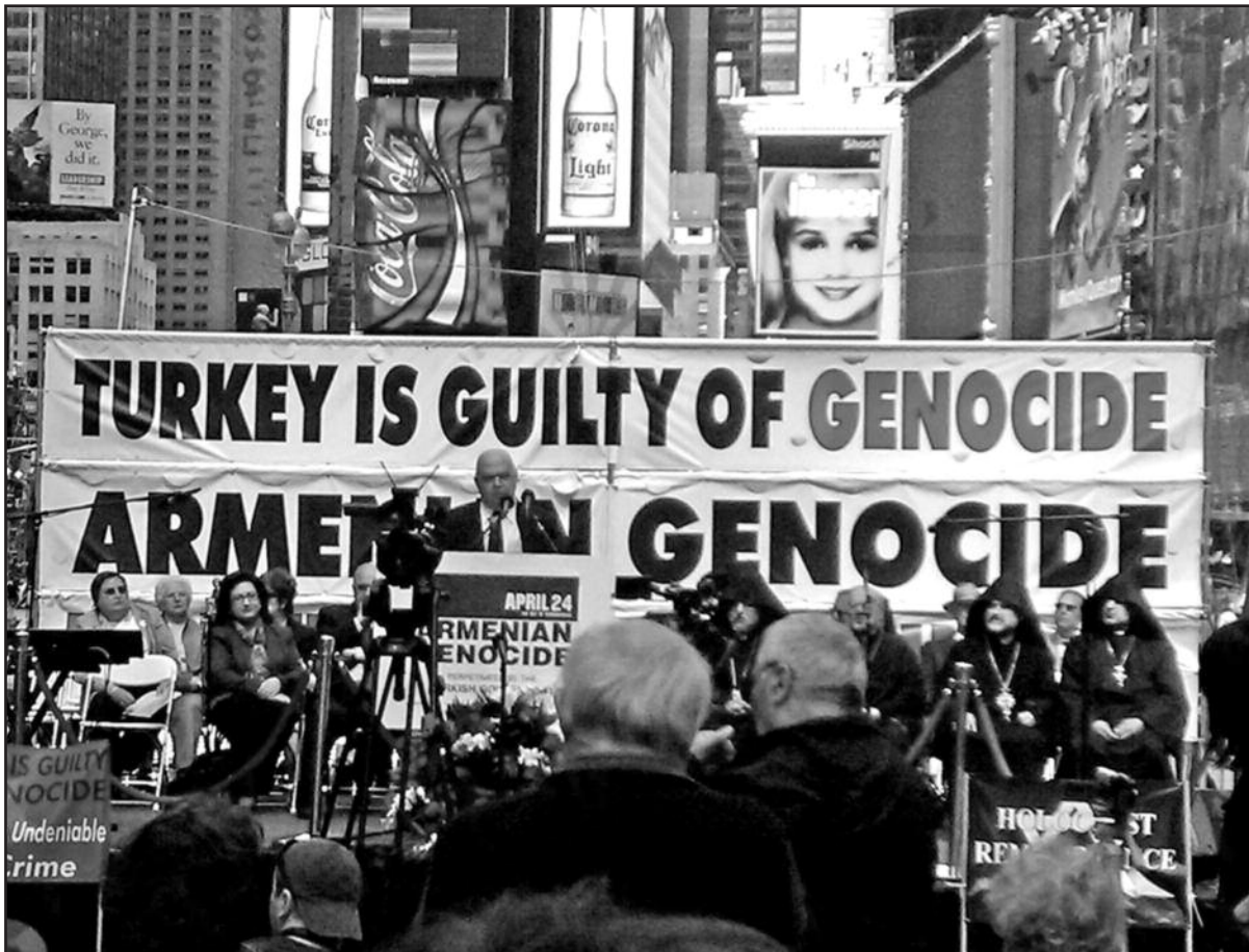
Armėnų genocido metinių minėjimas Times Square 2011 m.