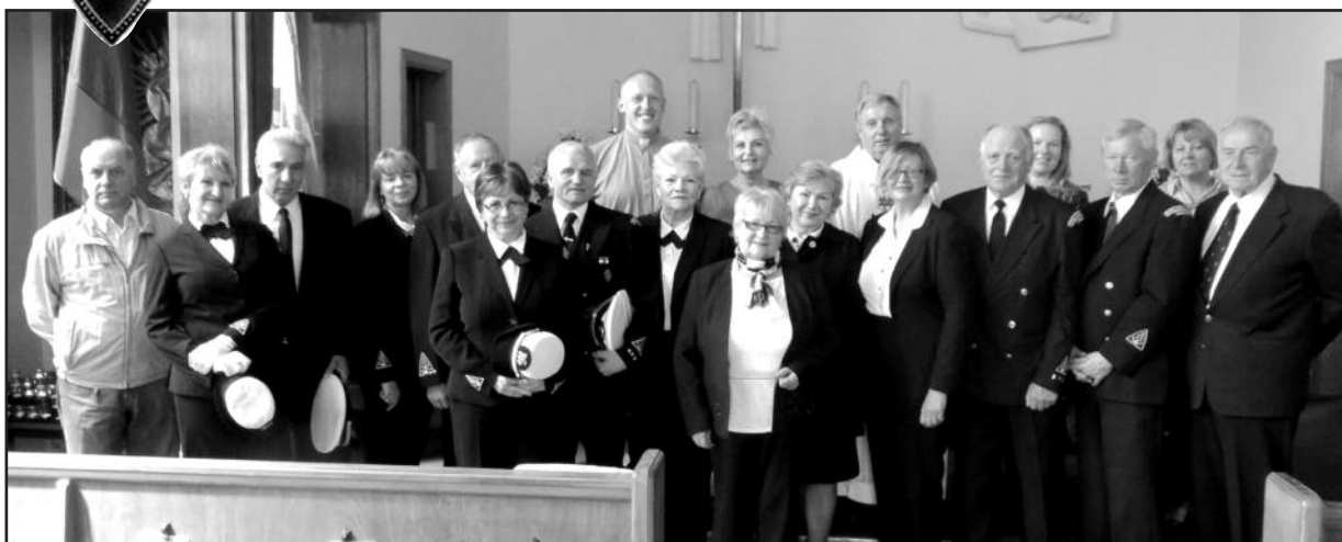
Jūrų šaulių kuopos „Baltija“ nariai po šv. Mišių.

Lietuvos šaulių sąjunga išeivijoje (LŠSI)