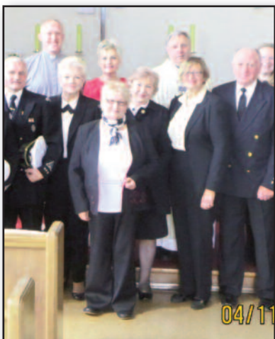
Jūrų šaulių kuopos „Baltija“ metinis susirinkimas – 7 psl.