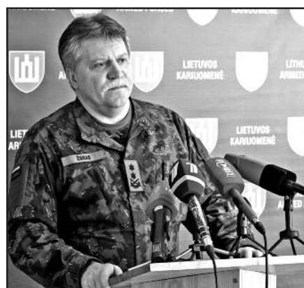
Lietuvos kariuomenės vadas generolas majoras Jonas Vytautas Žukas spaudos konferencijoje.

Pratybas organizuoja Lietuvos kariuomenės Jungtinis štabas.