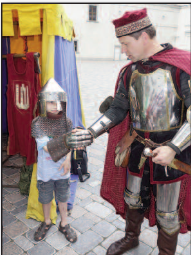
Istorijos diena Bostono lituanistinėje mokykloje – 4 psl.