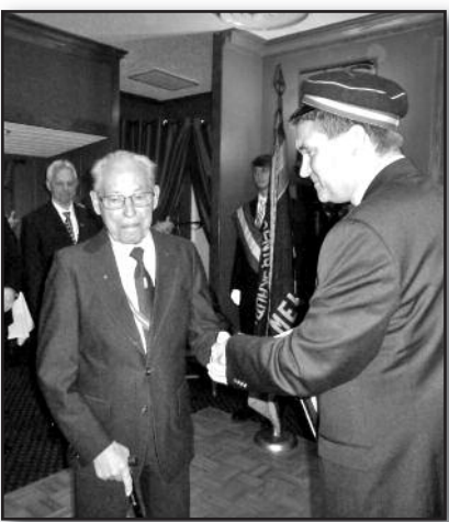
Akademinio skautų sąjūdžio šventė – 6 psl.