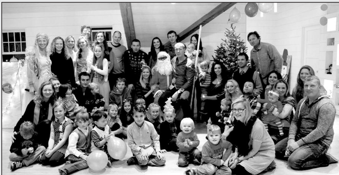
Gruodžio 20 dieną lietuviška mokyklėlė „Banginukas“ Nantucket saloje, Massachusetts valstijoje, labai smagiai šventė pirmąsias Kalėdas. Į šventę susirinko beveik visi lietuvių kilmės vaikai ir jų tėveliai, gyvenantys Nantucket saloje. Tai buvo pirmoji tokia didelė „Banginuko“ šventė, skirta vaikams.