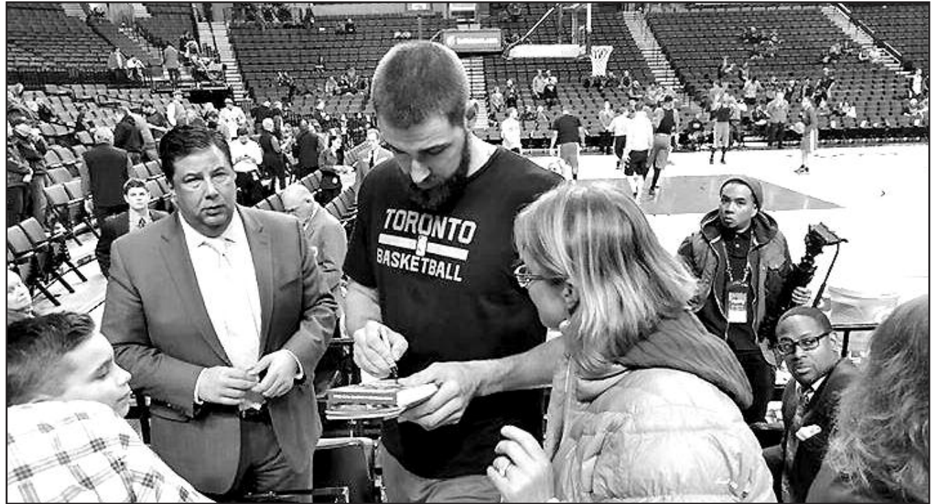
Nors rungtynes po pratęsimo laimėjo vietinė „Trail Blazers“ komanda, Portlando lietuviai džiaugėsi proga nusifotografuoti su Jonu Valančiūnu ir gauti jo autografą.

Toronto „Raptors“ atstovai maloniai sutiko tarpininkauti į Oregoną atvykusios komandos startinio penktuko žaidėjo iš Lietuvos susitikimui su vietine bendruomene – ŠALFASS šitaip padėjo su Valančiūnu pasimatyti Clevelando, Philadelphijos, New Yorko, Čikagos, Washingtono ir Los Angeles lietuviams. Tuo tarpu Toronte Joną