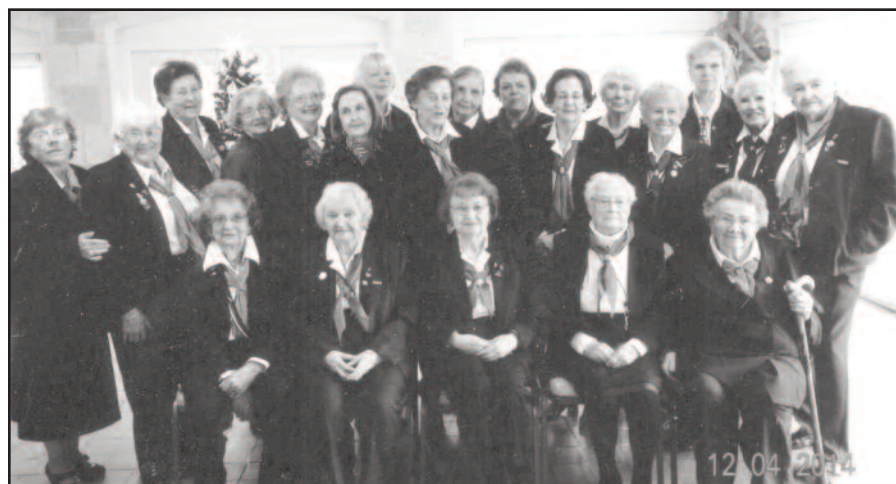
Smagu susitikti ir pabūti visoms kartu