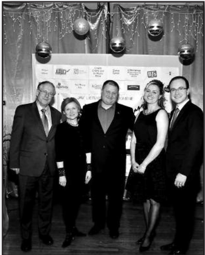
Long Islande išrinkti šauniausi lietuviai – 4 psl.