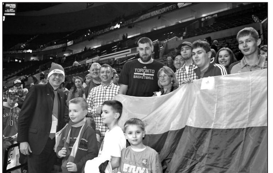
Toronto „Raptors“ ir Portlando „Trail Blazers“ rungtynes stebėjo nemažai Oregono valstijos lietuvių.