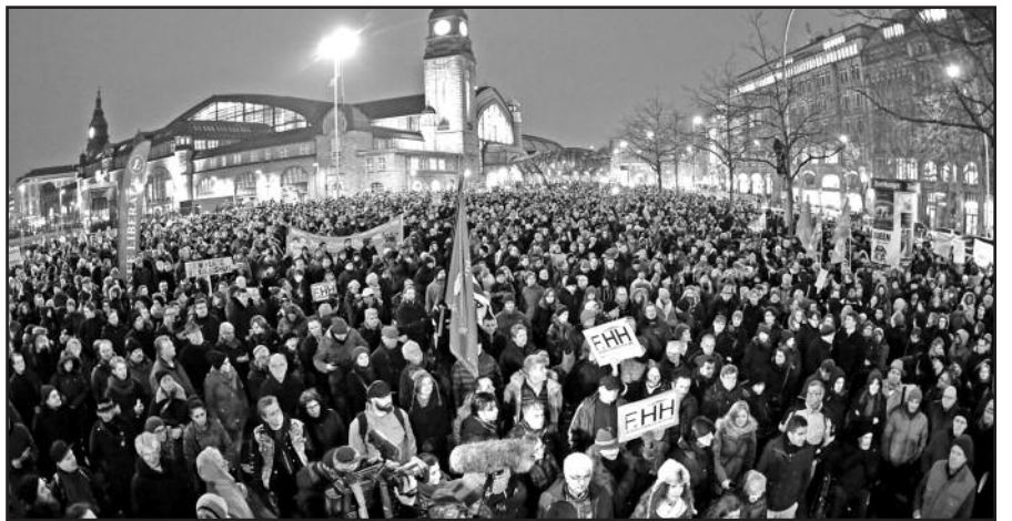
Drezdeno gatves užplūdo demonstrantai