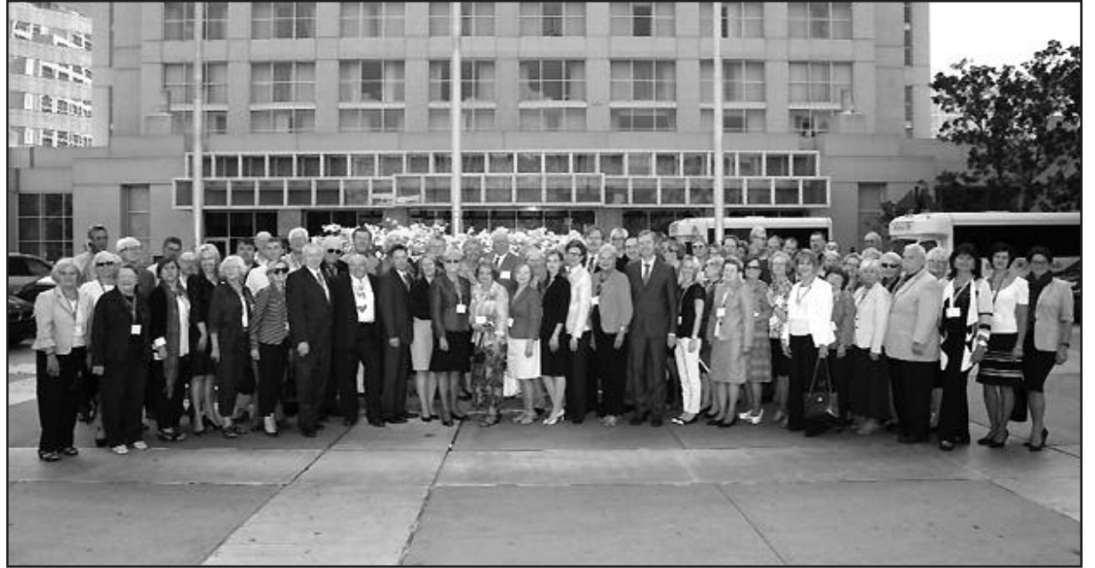
Visi JAV LB XX Tarybos III sesijos dalyviai

Be veiklos ataskaitos ir kitų metų nutarimų