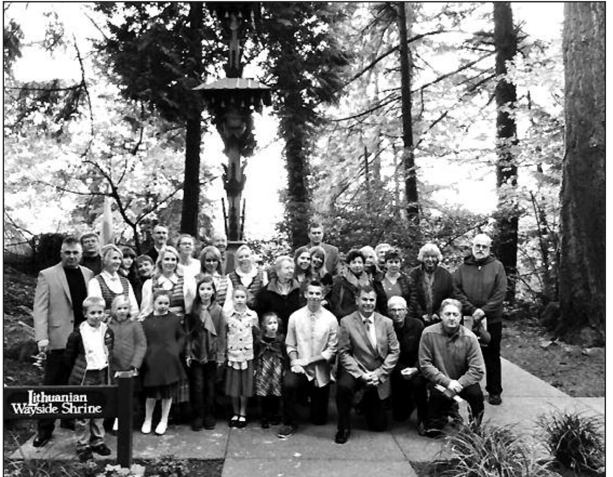
Prie atnaujinto koplytstulpio – po pusšimčio metų