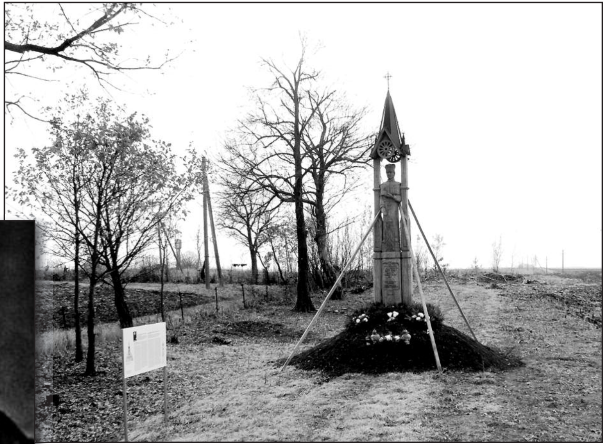
Varnupiuose jamžintas garsaus kunigo marijono atminimas.