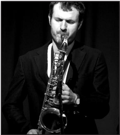
Žavios improvizacijos po Čikagos skliautais – 4 psl.