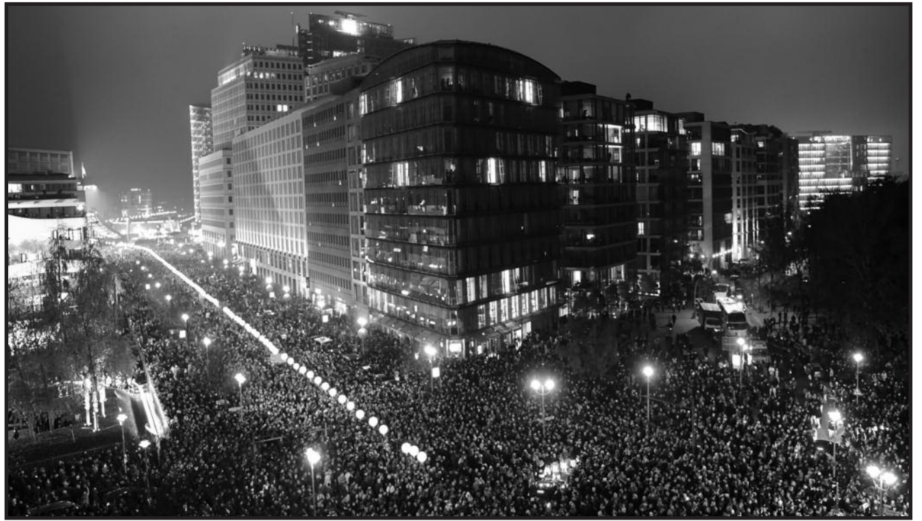
Berlynas. 2014 m. lapkričio 9 d.