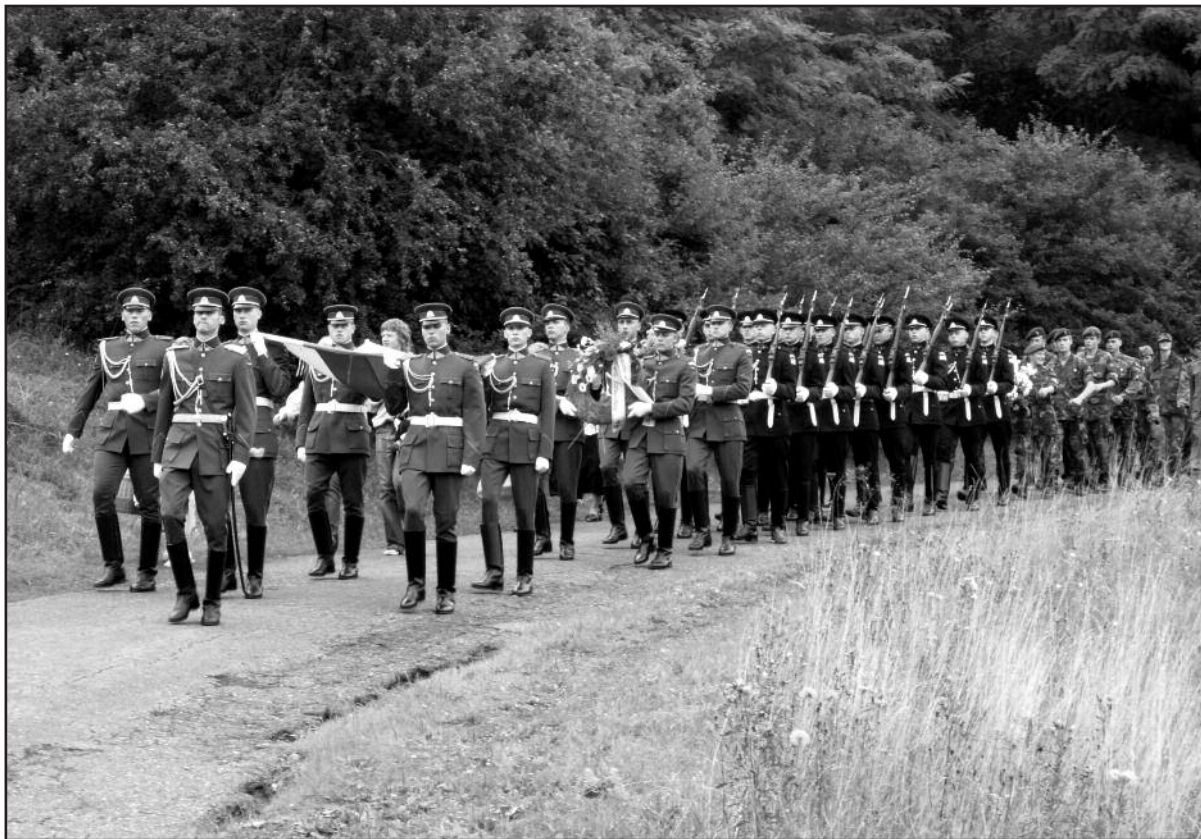
Lietuvos kariai Ariogaloje, Lietuvos politinių kalinių ir tremtinių tradiciniame sąskrydyje

2008–2012 metų kadencijoje TS-LKD žadėjo grąžinti Šauktinių kariuomenę ir gerokai sustiprinti Krašto gynybos pajėgumus, tačiau maža ką nuveikė, nes prasidėjusi pasaulinė finansinė, o vėliau ir ūkio krizė vėl nubraukė visus gerus ketinimus. Teko mažinti valstybės išlaidas, taip pat ir krašto gynybai. Pavyko tik pradėti jaunimo savanoriškus bazinius karinius mokymus ir ribotas Rezervo pratybas.