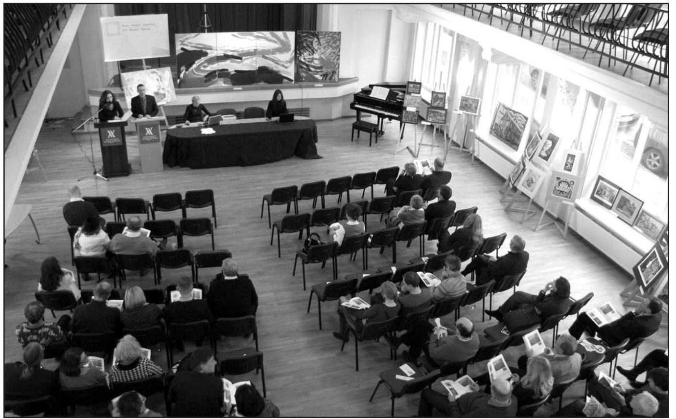
Vilniaus aukcionas įgyja vis didesnį populiarumą.