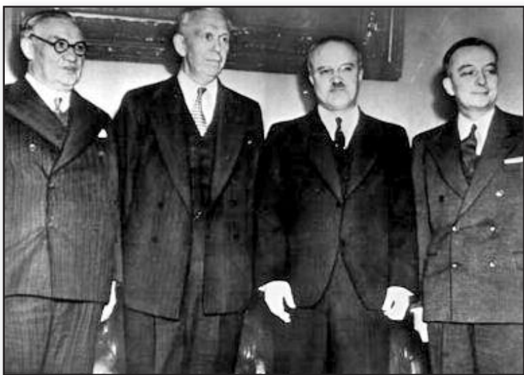
Užsienio reikalų ministrai Ernest Bevin (Anglija), George Marshall (USA), V. M. Molotov (Sov. Sąjunga), George Bidault (Prancūzija) (Maskvoje, 1947 m. kovo 10 d.)

Lapkričio 26 d. – Pareinu pavėlavęs namo, ir – telegrama iš Regensburgo! Greit persirengiu, užkandu ir išmaunu į stotį. Oras bjauriai vėjuotas ir šaltas. Deja, pavėluoju, prisieina ilgai laukt stipriame vėjuje stoties perone, ir vis nėra