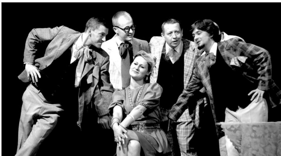
Scena iš spektaklio „Dobilėlis penkialapis“ (Punsko Klojimo teatras)