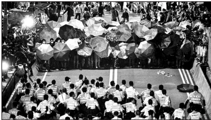
Honkonge vykstanti taip vadinama „skėčių revoliucija“.