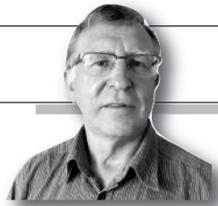
Parengė Vitalius Zaikauskas