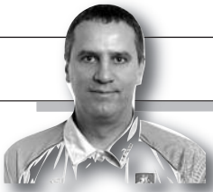
Parengė Dainius Ruževičius