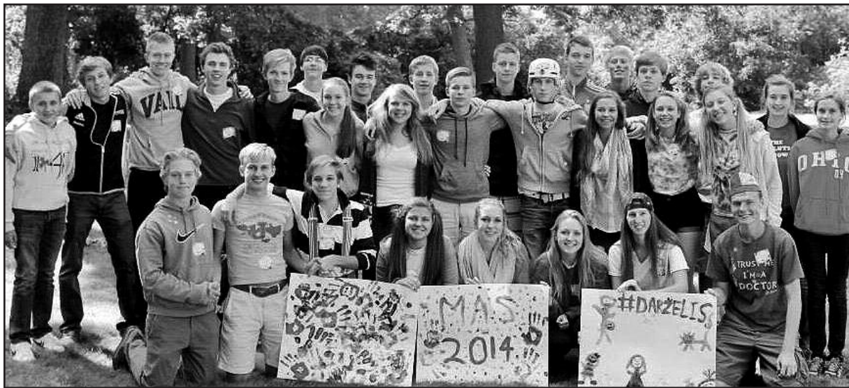
Čikagos moksleiviai ateitininkai pirmame šių mokslo metų susirinkime Ateitininkų namuose, Lemont, IL.

Visi Čikagos ir jos apylinkių moksleiviai yra kviečiami įsitraukti į kuopos