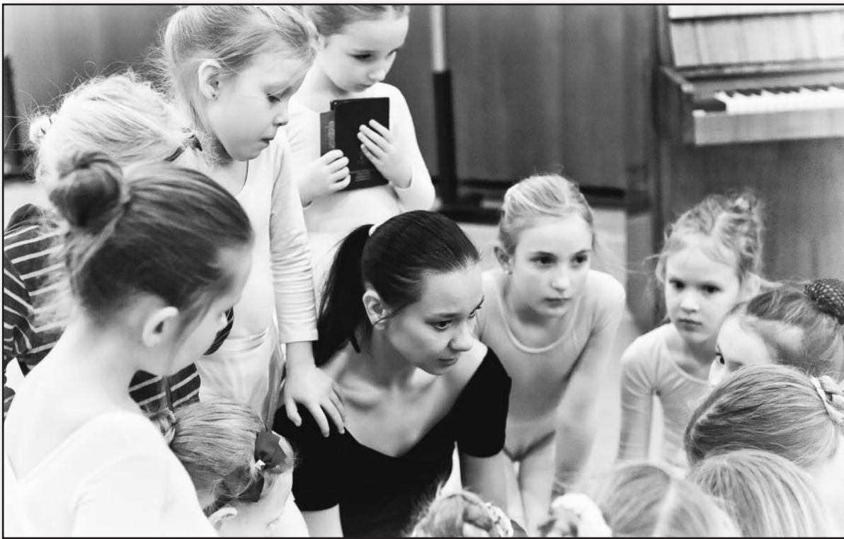
Baletu mokykloje, 2009 m.