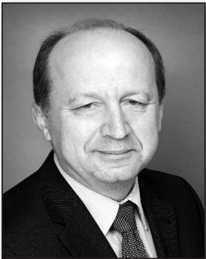
A. Kubilius siūlo naują „Maršalo planą“ – 3 psl.