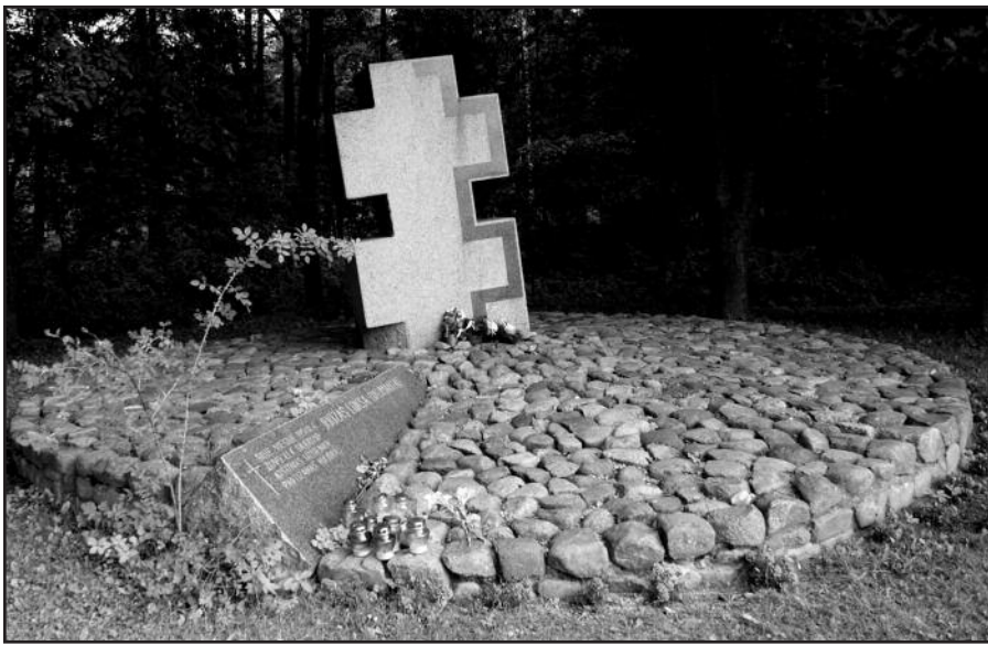
Vieta, kurioje legendinis partizanas žuvo prieš 63-ejus metus.