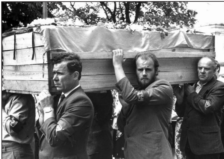
Tremtinių palaikų sugrįžimas, 1989 m.

priemonėmis. Pašauktam lietuviui tikimybė tarnauti 3 ar 2 metus savame krašte buvo nedidelė. Tolinieji Rytai, bekrastis Sibiras, Vidurinės Azijos plotai, Kaukazo respublikos ir sritys, Tolimoji Šiaurė ir visa tai, ką pasiekdavo galingai besiplečiantis rusų laivynas, buvo per prievartą jaukinami. Muštras, patyčios ir manipuliacijos pasaulio vaizduote sruvo bendra vaga ir daugiau ar mažiau deformavo tautinio tapatumo jausmus. Vėlgi, dešimtims tūkstančių jaunų lietuvių velkantis rusiškas uniformas, sunku statistiškai nustatyti, kiek jų per tarnybos metus įsimylėjo peizažus ar vietines moteris ir liko toli nuo tėvynės. Absoliuti dauguma sugrįždavo namo, laukiami artimųjų ir saugantys lietuviško prierašumo prie savosios žemės jausmus.