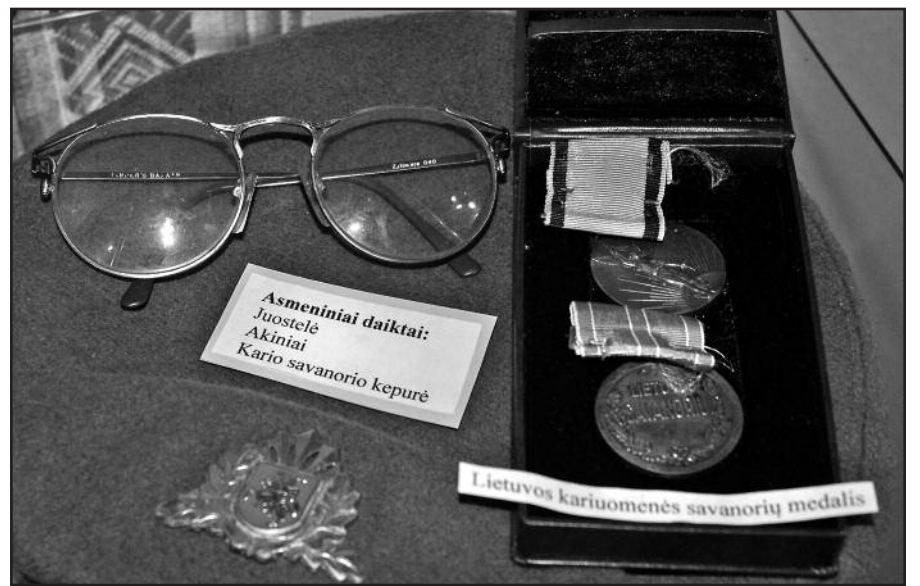
Ekspozicijoje – ir asmeniniai Daumanto daiktai.