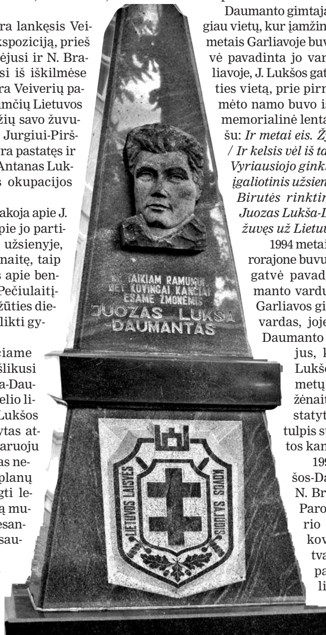
Paminklas prie J. Lukšos-Daumanto muziejaus Veiveriuose.