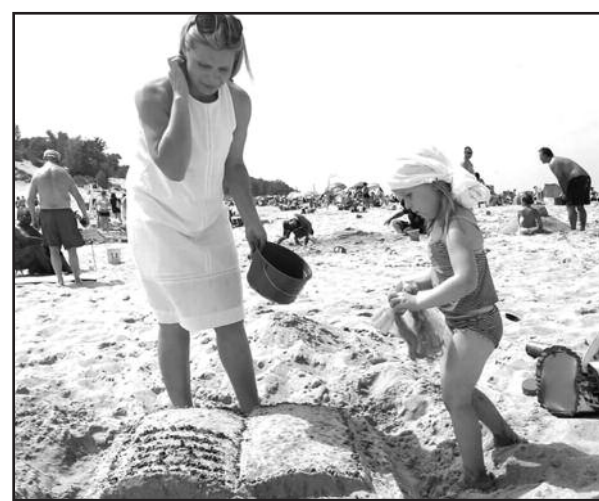
Konkurso dalyviai ir jų kūriniai.