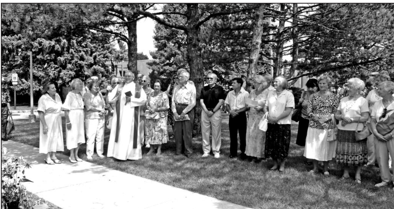
Į naujo kryžiaus šventinimą susirinko gausus dalyvių būrys.