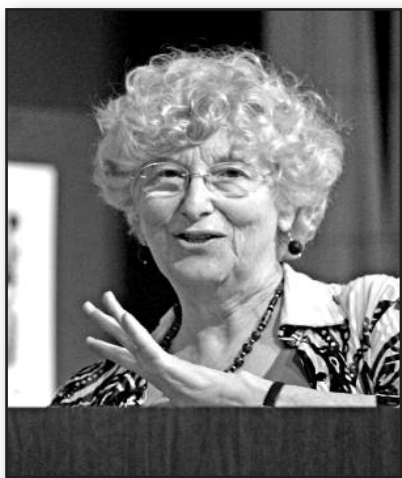
E. Cassidy lankėsi Lituistikos katedroje – 5 psl.