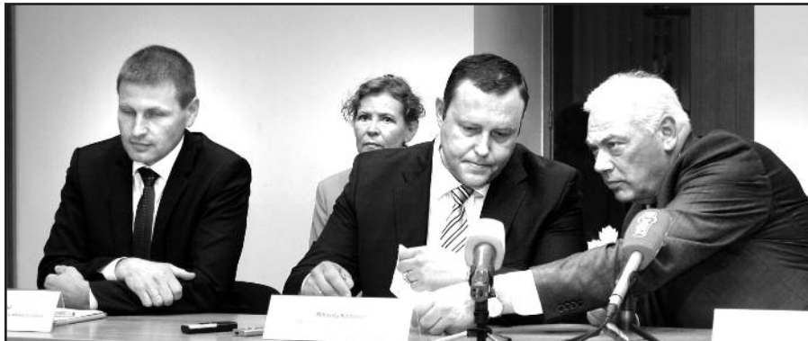
Estijos, Latvijos ir Lietuvos vidaus reikalų ministrai (iš k.): Han Pevkur, Rihards Kozlovskis ir Dailis Barakauskas.

Vilnius (ELTA) – Kurioje nors iš Baltijos valstybių – Lietuvoje, Latvijoje ar Estijoje – pasirodžius įtartiniais separatistiniams ar teroristiniams dariniams, jų skubiam neutralizavimui būtų pasitelktos visų trijų valstybių viešosios tvarkos užtikrinimo pajėgos.