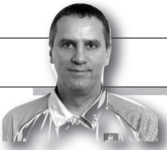
Parengė Dainius Ruževičius