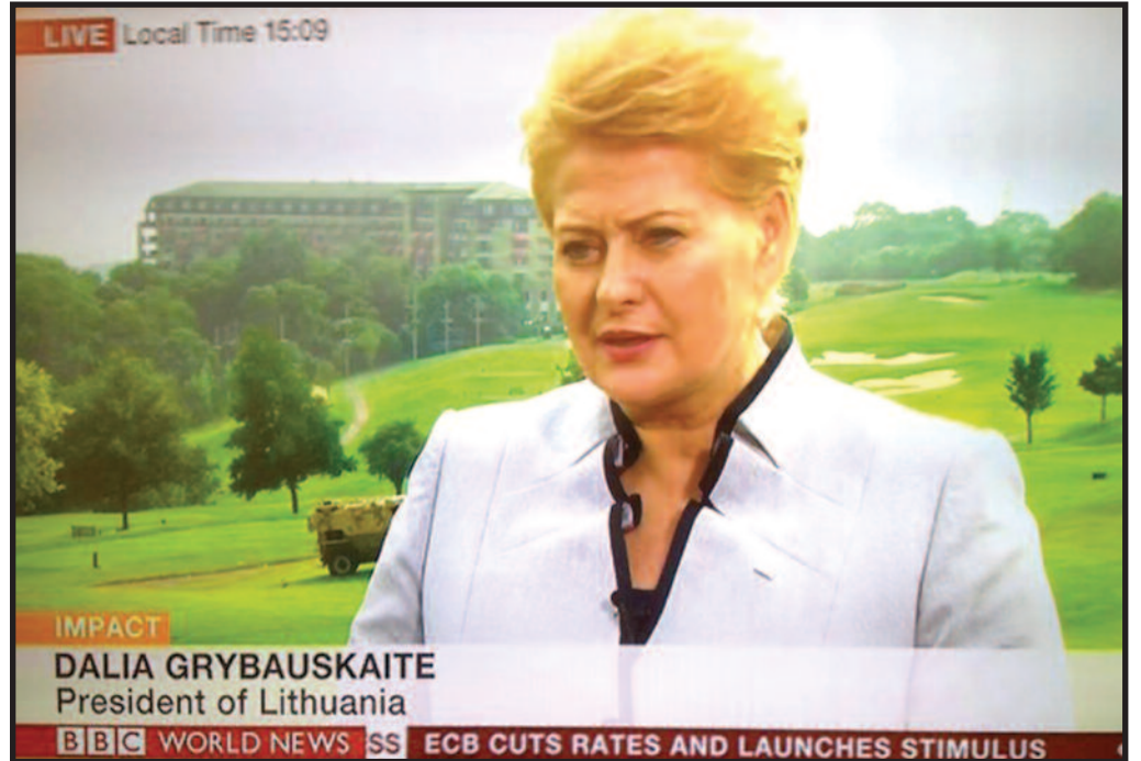
LR prezidentė: Turime parodyti V. Putinui, kad jis negali nueiti per toli.

Pagrindinis Lietuvos delegacijos šiame Aljanso vadovų susitikime tikslas – užsitikrinti konkrečias ilgalaikes saugumo garanti-