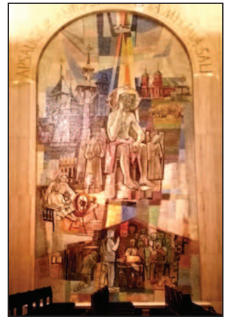
Apsaugok Aukščiausias Tą Mylimą Šalį