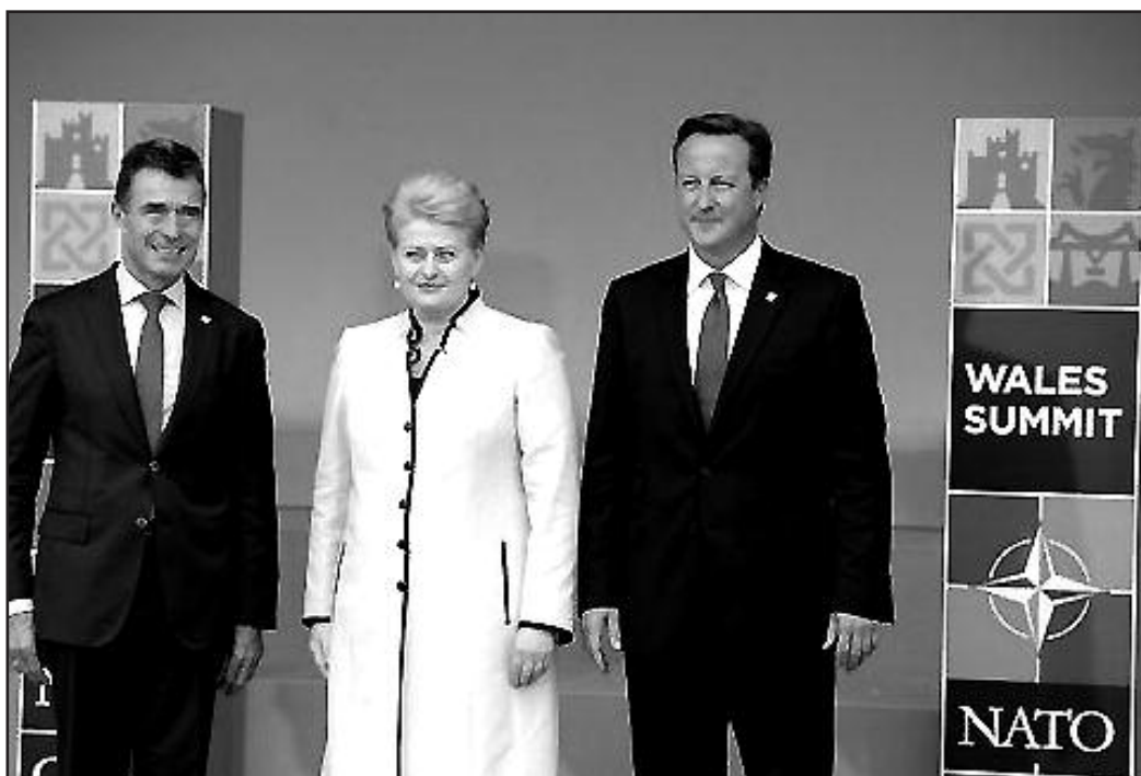
NATO viršūnių susitikime Wales (iš k.): NATO gen. sekretorius A. F. Rasmussen, LR prezidentė D. Grybauskaitė ir Jungtinės Karalystės premjeras D. Cameron.