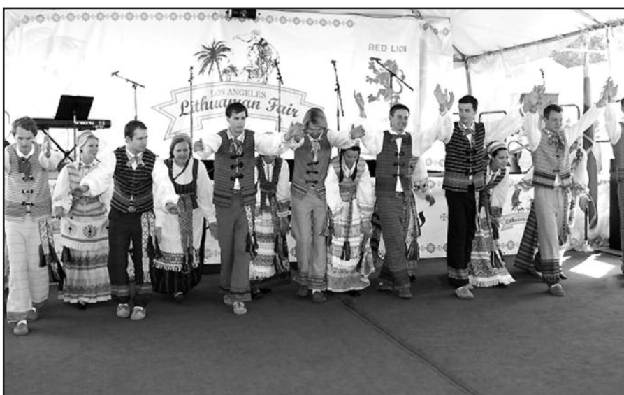
Spalio 4 ir 5 d., šeštadienį ir sekmadienį, Los Angeles lietuviai kviečia visus į „Lietuvių Dienas“, kurios prasidės 11 val. r.

Spalio 11 d., šeštadienį: „Athenaeum“ teatre (2936 N. Southport Av., Chicago, IL 60657) meninis projektas „Babilonas“. Dalyvauja (Arina, Aldegunda, K. Stančiauskas, G. Zujus ir kt.), dainuos gospel choras, grieš styginis kvartetas ir šoks šokėjai. Bilietais prekiauja: www.athenaeumtheatre.org ; „Smilga“, „Rūta“, „Kunigaikščių užėiga“, „Senasis Vilnius“. Daugiau informacijos tel. 708-574-3992.