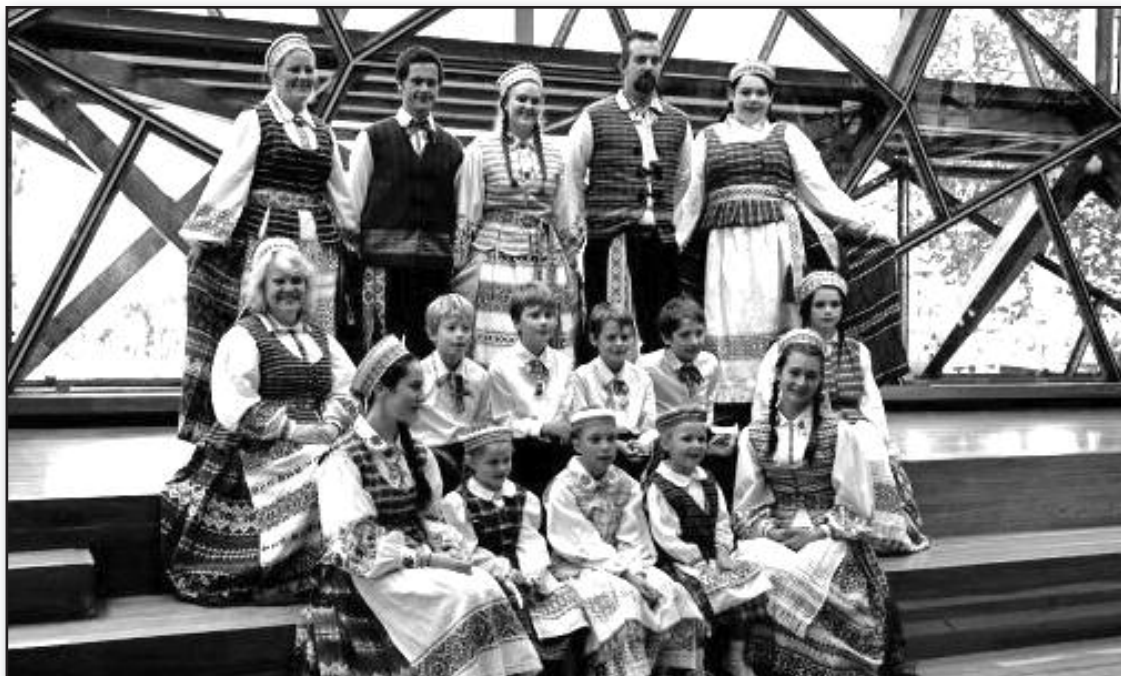
Kovo 11 d. viešasis koncertas Melbourne, Federation Square

jungos skyrių. Visiškai natūralu, kad mažesni masteliai ir kuklesnis aktyvių diasporos gyvenimo dalyvių skaičius reikalavo didesnio bendradarbiavimo.