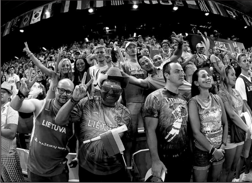
Lietuvos krepšininkus Ispanijoje karštai palaiko gausus būrys krepšinio sirgalių