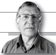
Parengė Vitalius Zaikauskas