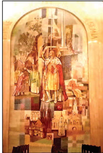
Iš Praeities Tavo Sūnūs te Stiprybę Semia