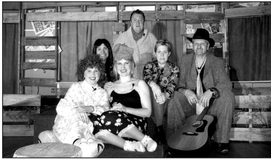
Spalio 10–12 d., penktadienį-sekmadienį, Jaunimo centre, 5620 S. Claremont Ave., Chicago, IL, vyks XIII lietuvių teatro festivalis.

Rugsėjo 21 d., sekmadienį: 2 val. p. p. Švč. Mergelės Marijos Nekalto Prasidėjimo bažnyčios 100-mečio jubiliejaus iškilmingas šv. Mišias celebruos Francis Cardinal George, O.M.I.