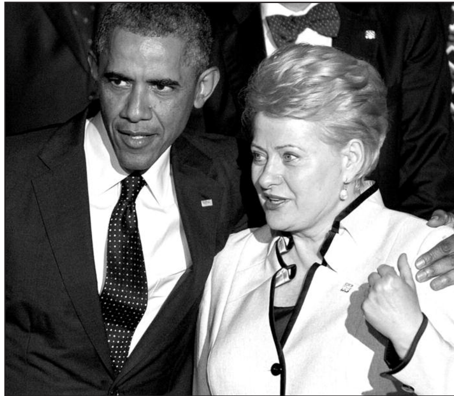
JAV ir Lietuvos vadovai Barack Obama ir Dalia Grybauskaitė.

Pajėgas sudarys dokumentą pasirašiusių šalių oro, jūrų ir sausumos