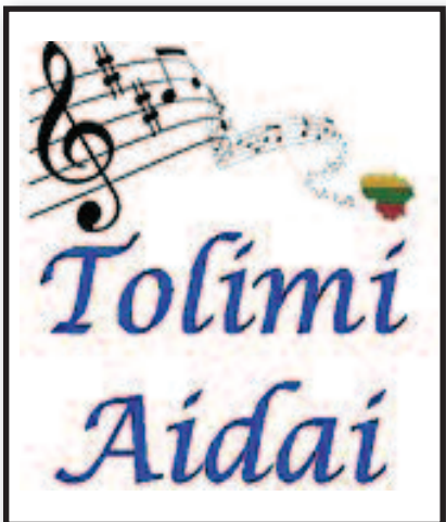
Pirmąkart Čikagoje – „Tolimi aidai“ – 10 psl.