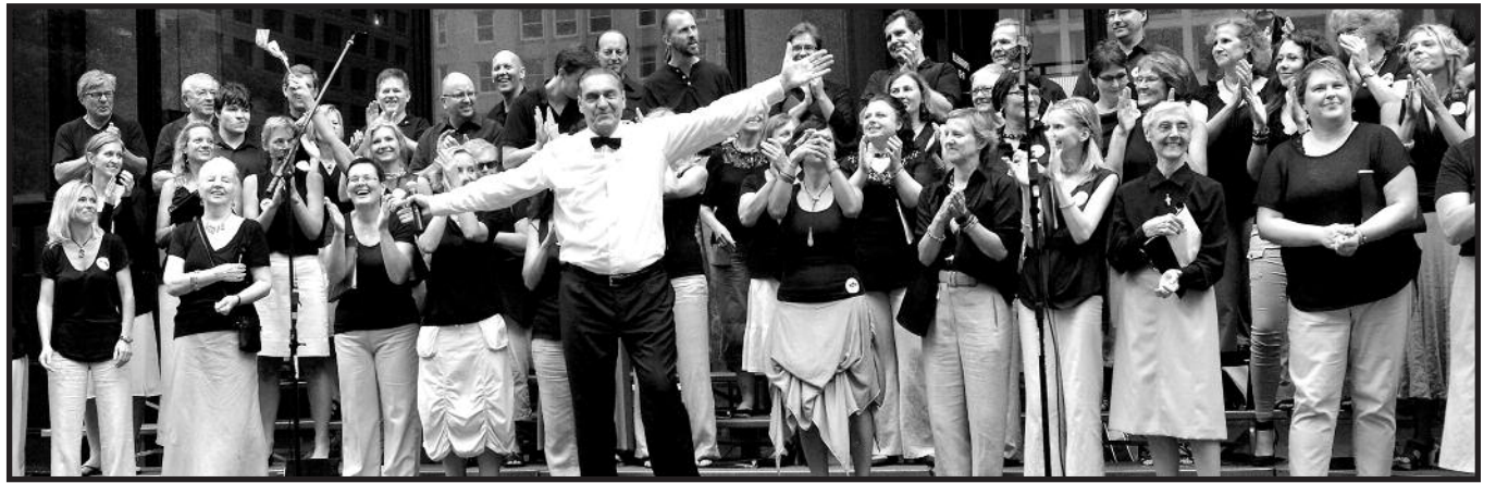
„Dainava“ „antiškai“? Smagu buvo ne tik žiūrovams, bet ir atlikėjams

O trečia, žinoma, nuostabi galiomybė pabendrauti su Algirdu Kaušpėdu. Manau, kad visiškai suprantama, kaip choras to laukė. Asmeniškai man buvo malonu dar ir todėl, kad mintyse sugrįžau į dienas, praleistas Lietuvoje 1989 metais, kai kartu su Algirdu bei kitais Lietuvos roko muzikantais apkeiliavome Lietuvą Roko maršu. Pirmą kartą būti Lietuvoje tokiu laiku ir su tokiais žmonėmis – didelė gyvenimo dovana! Ta kelionė nulėmė ir mano ateities kelius, nes nuo anų dienų nebegaliu gyventi be apsilankymų Lietuvoje – vis ieškau būdų kaip, nors ir trumpam, sugrįžti! Nuoširdžiai dėkoju Algirdui, kad atvyko pas mus! Jo buvimas