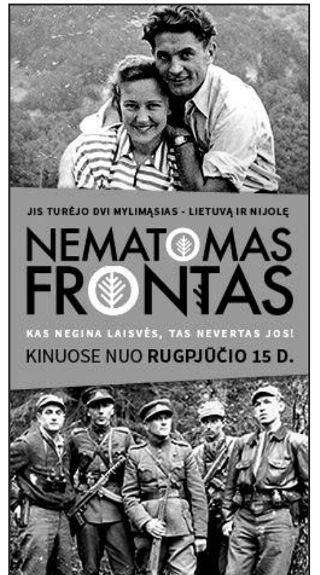
Filmo plakatas.