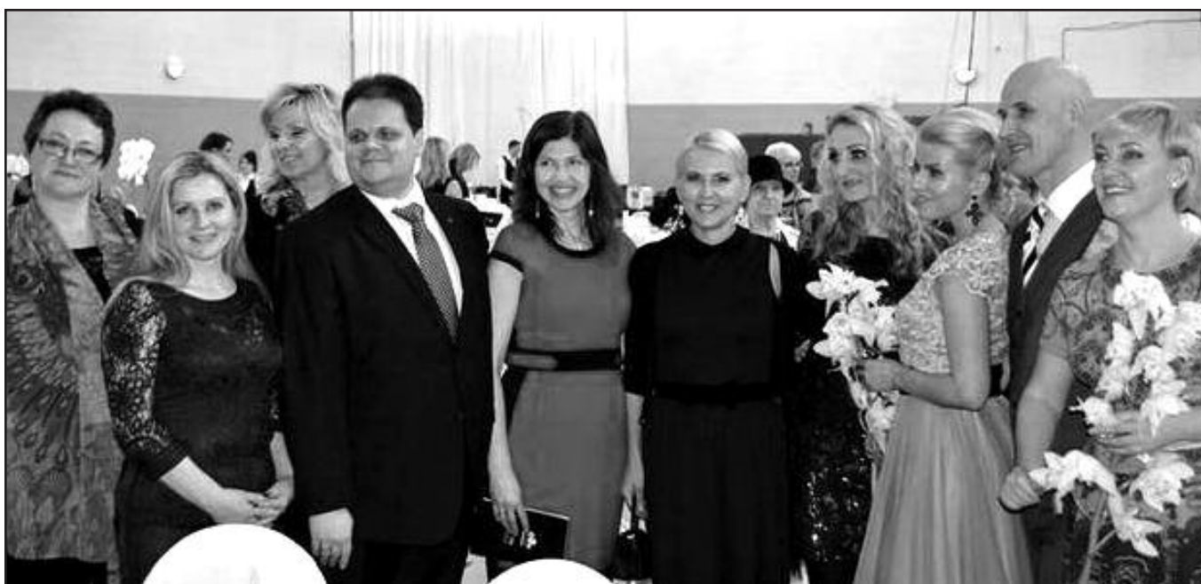
„Mamų unijos“ renginys – vienas iš daugelio labdaros renginių, nuvilnijusių ne tik Lietuvoje, bet ir Čikagoje, kuris tarp išeivijos lietuvių susilaukė plataus atgarsio. Labdaros vakaro „Vilties aitvarai“ rengėjai ir svečiai.

Įvertinusios lietuviškos socialinio finansavimo platformos „Kelkbures.lt“ patikimumą, „Mamų unijos“ atstovės nutarė išbandyti pasaulyje jau labai populiarią, o Lietuvoje dar naują lėšų rinkimo būdą – bendruomeninį finansavimą (ang. crowd-funding). Tai