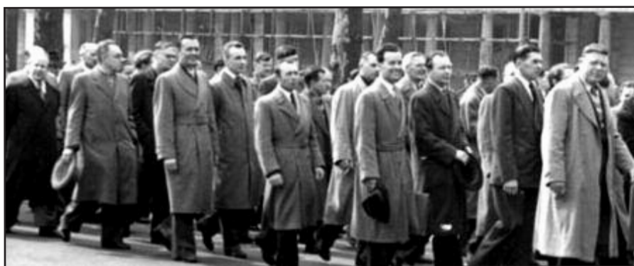
Lietuvių demonstracija Chruščiovo vizito Londone metu. 1956 m.

spauda, vasaros atostogos, leidusios derinti poilsį ir lietuvišką kultūrinę akciją. Visa tai ir iš šiandienos perspektyvų žiūrint atrodo kaip nesenstanti patirtis, leidžianti tikėtis savo funkcionalaus pritaikymo ir dabartinėmis lietuvių pasaulio ir jo centre esančios laisvos Lietuvos sąlygomis.