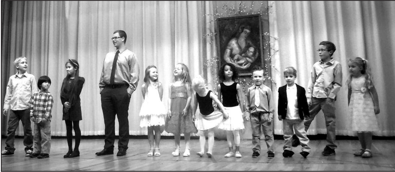
„Žiburio“ lituanistinės šeštadieninės mokyklos meninės programos atlikėjai.

Tad nulenkime galvas ir pasimelskime už mūsų mylimas ir nuostabias Mamas!