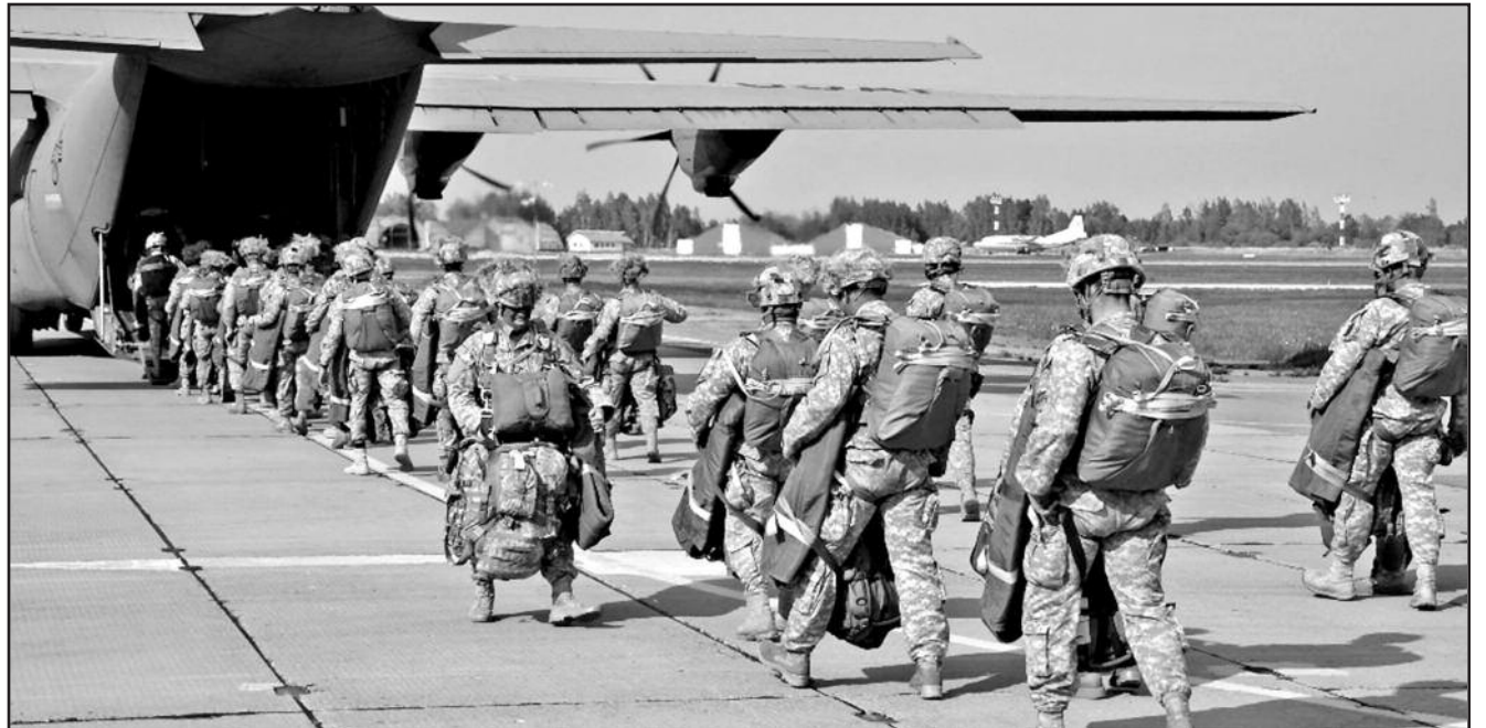
Gaižiūnų poligone Rukloje, Jonavos rajone, vyko jungtinė Lietuvos karių ir NATO sąjungininkų iš JAV oro desanto operacija.

NEWSPAPER – DO NOT DELAY – Date Mailed 05-19-2014