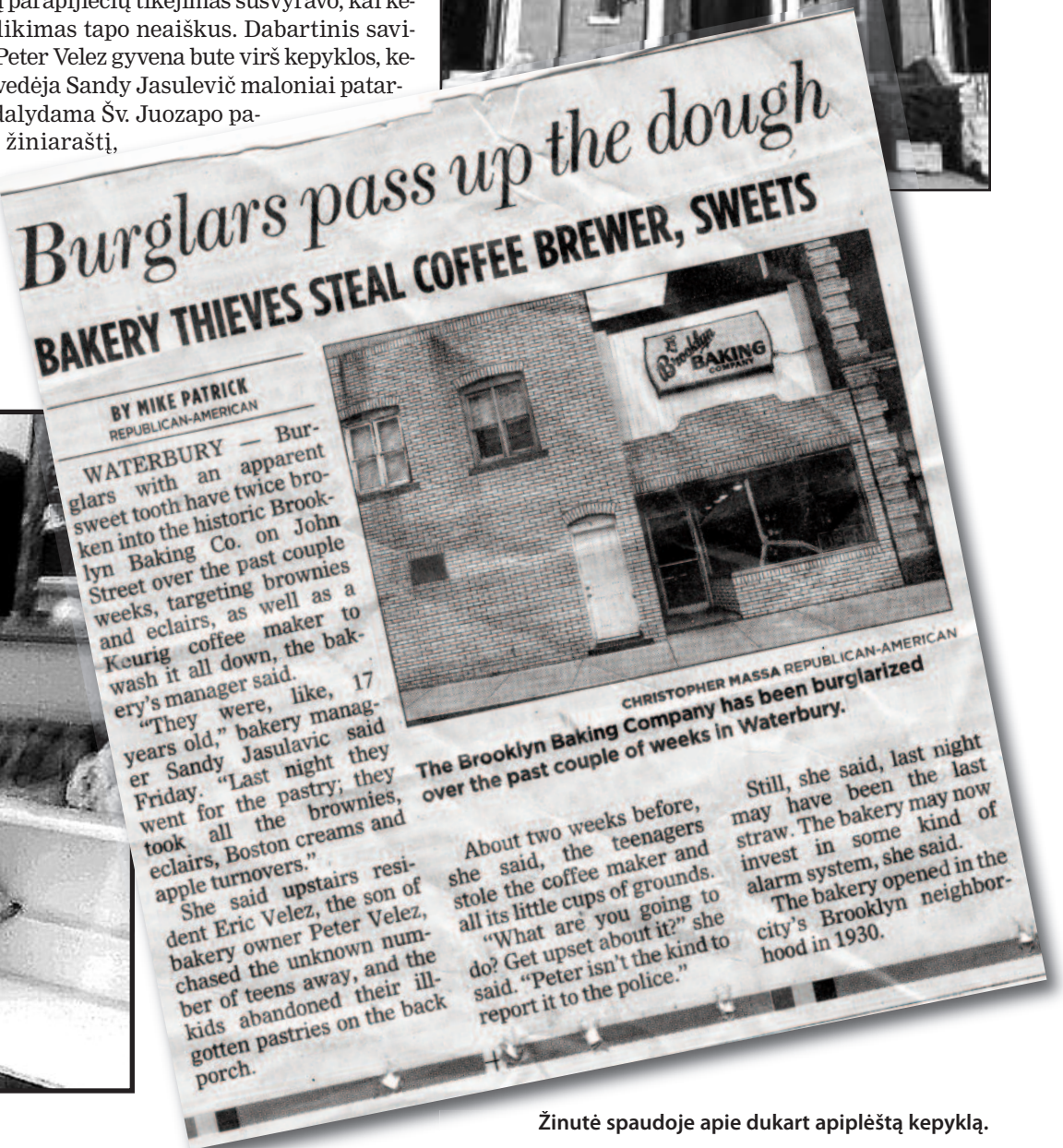
Žinutė spaudoje apie dukart apiplėštą kepyklą.