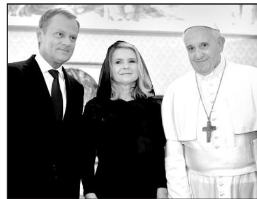
Lenkijos premjeras susitiko su popiežiumi Pranciškumi.

Romoje bei Vatikane viešėjęs D. Tusk taip pat padėjo gėlių ant Jono Pau-