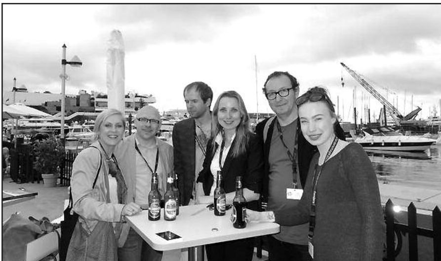
„Redirected“ kūrėjai Kanuose