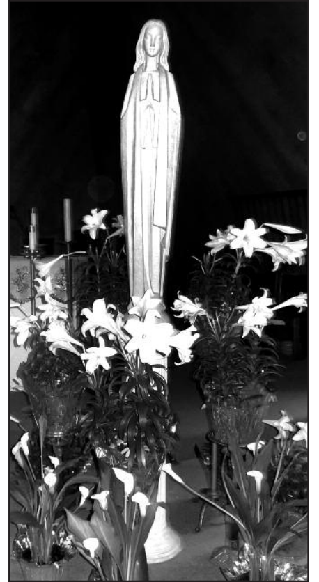
Mergelės Marijos statula prie altoriaus.