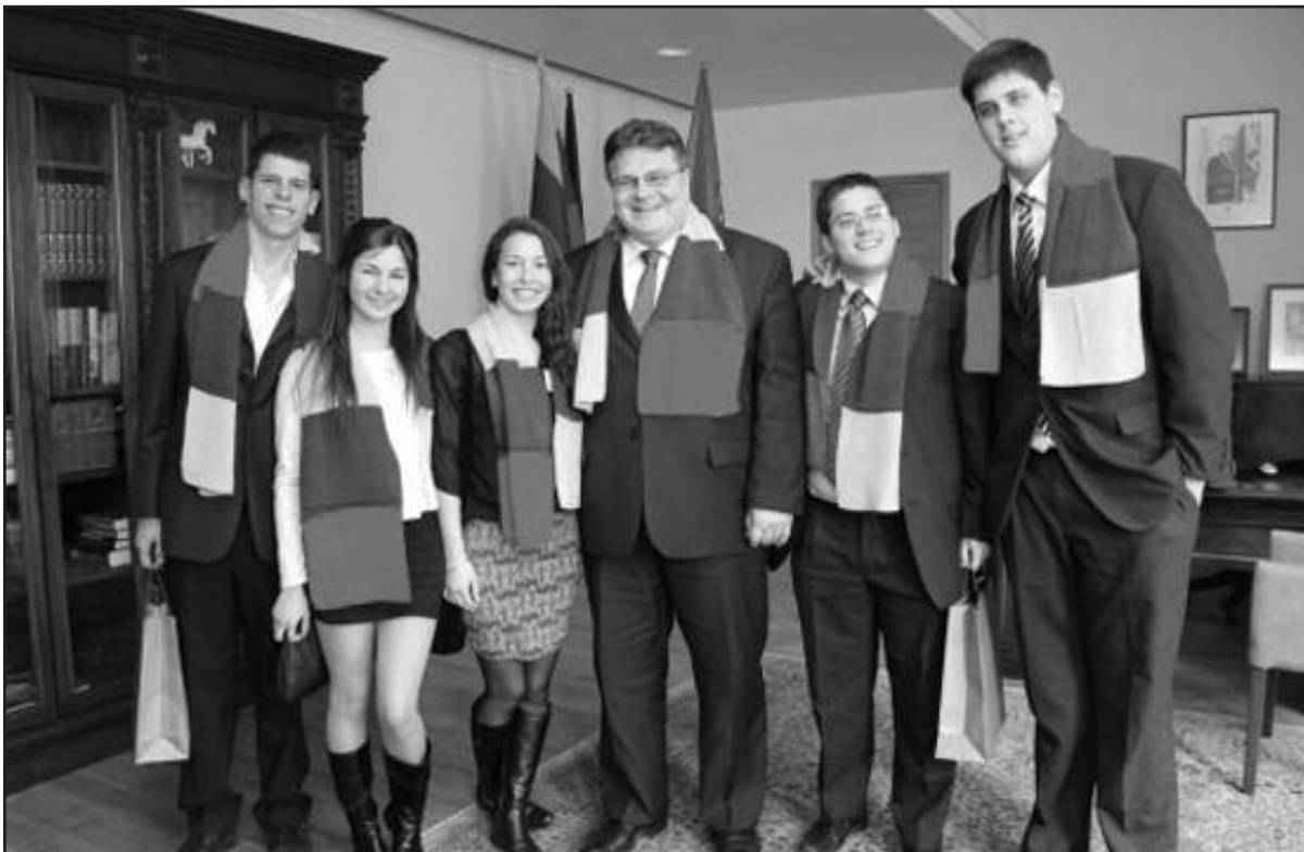
Pietų Amerikos lietuvių jaunuolių susitikimas su LR užsienio reikalų ministru Linu Likevičiumi (ketvirtas iš k.). URM parėmė jų mokymus Vilniaus lietuvių namuose

Užsienio reikalų ministerijos užsakymu visuomenės nuomonės ir rinkos tyrimų centras „Vilmorus“ internetu atliko apklausą apie užsienio lietuvių poreikius. Informacija apie vykdomą apklausą buvo skleidžiama per Facebook'ą ir per užsienio lietuvių organizacijas, tarp jų ir kraštų lietuvių bendruomenes. Džiaugiamės, kad 79 proc. apklaustųjų patvirtino, kad lietuvių išlaikymas užsienyje jiems yra svarbu. Tačiau pažymėtina ir tai, kad apklausoje aktyviausiai dalyvavo žmonės, nepriklausantys jokiai organizacijai (63 proc.), o tik 37 proc. nurodė, kad priklauso bendruomenei. Tai yra įrodymas, kad dirva plati. Mūsų nuomone, vienas iš svarbiausių veiksnių yra asmeninė motyvacija ir noras išlaikyti lietuvių, bendruomeniškumą, ryšį su Lietuva. Neabejoju, kad Lietuvos institucijoms, tarp jų diplomatinėms atstovybėms, taip pat ir užsienio lietuvių bendruomenėms, rūpi pasiekti nutolusius tautiečius, sustiprinti ryšį su motyvuotais lietuvių ir jiems padėti burtis tam, kad būtų suvienytos pastangos. Stiprios užsienio lietuvių vienijančios organizacijos yra mūsų bendras interesas: jos užtikrina veiklos tęstinumą puoselėjant lietuvių ir pristatant Lietuvą užsienyje, leidžia plėsti geras iniciatyvas, įtraukti į jas daugiau lietuvių ir užtikrinti lietuvių bendruomenės ir Lietuvos matumą užsienyje.