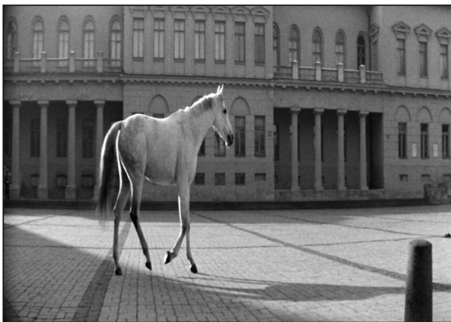
„Laikas eina per miestą“ (rež. A. Grikevičius)

Lietuviški kino kūriniai seniai nebuvo rodomi pasauliniuose kino ekranuose dėl labai susidėvėjusios kino juostos. O jei filmus ir galima buvo pamatyti kur nors interneto platybėse, tai jų kokybė buvo tokia traagiška, kad nelabai ką buvo įmanoma