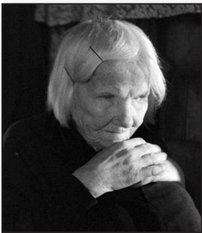
Lietuviškas kinas New Yorke – 10 psl.