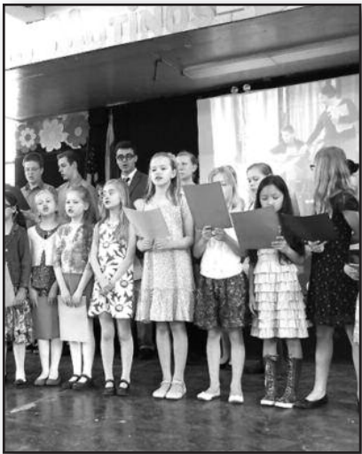
„Maironiukai“ sveikino mamas – 5 psl.