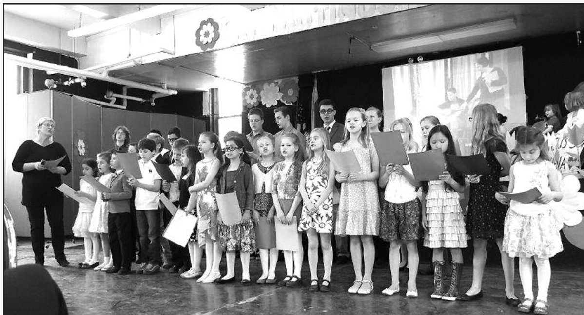
„Maironiukų“ atliekamos dainos, skirtos mamytėms ir močiutėms, paliko neišdildomą įspūdį jų širdyse.