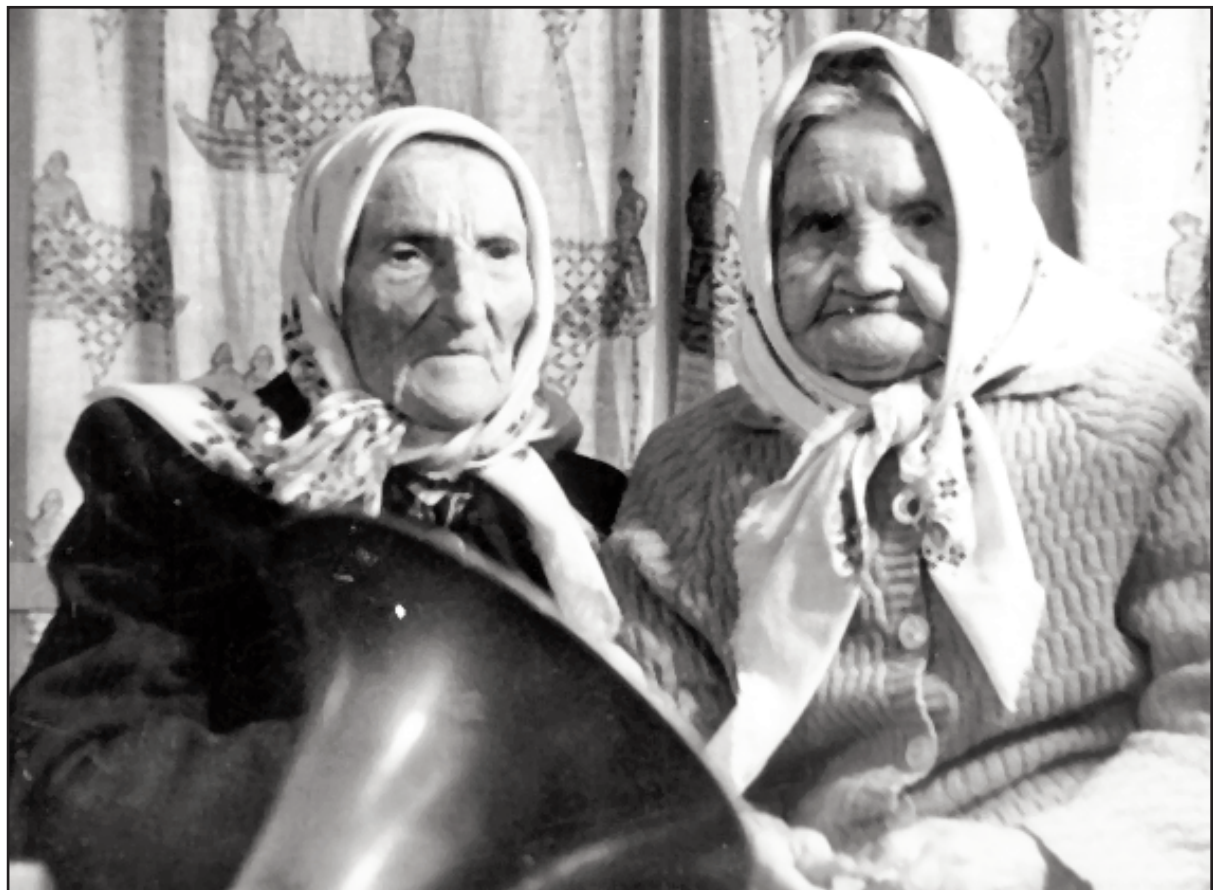
„Šimtamečių godos“ (rež. R. Verba)