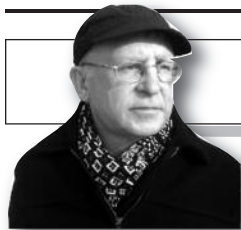
Parengė Vitalius Zaikauskas