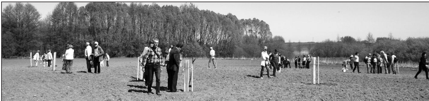
Pirmieji naujosios giraitės ąžuolai