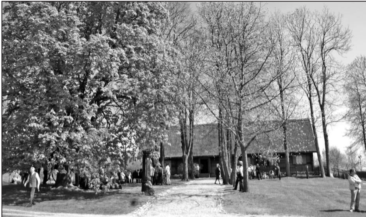
Basanavičynė gražiai tvarkoma, čia dirba 9 darbuotojai.