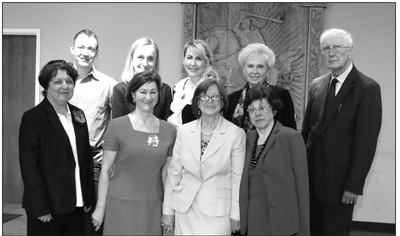
Naujos JAV LB Lemonto apylinkės valdybos nariai