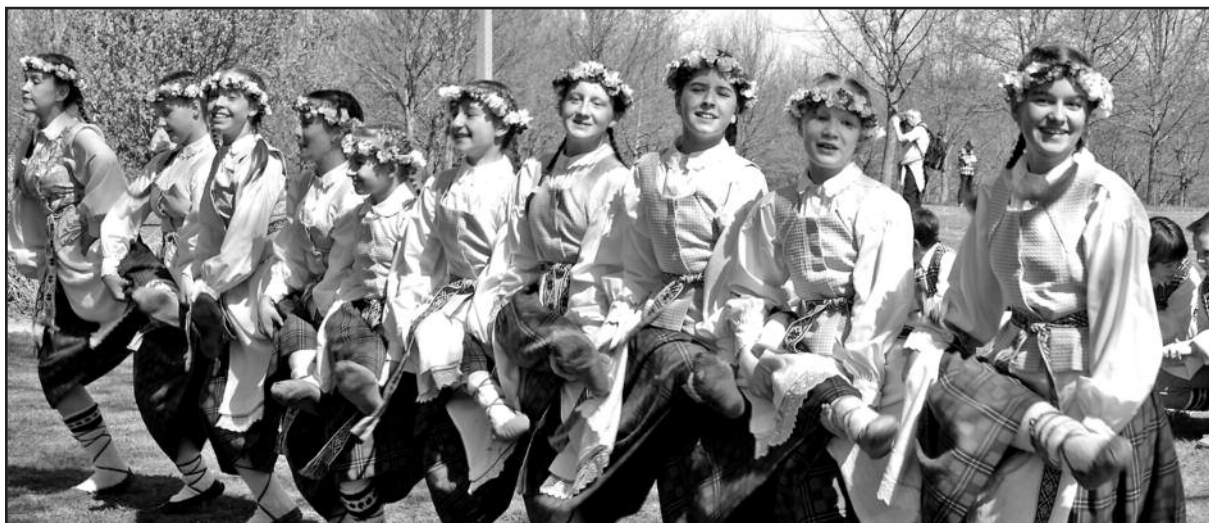
Visus sužavėję jaunieji Vilkaviškio šokėjai.

Aukščiausioje ąžuolyno vietoje yra Aukuro kal-