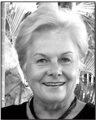
Lietuviai juda visur – 6 psl.