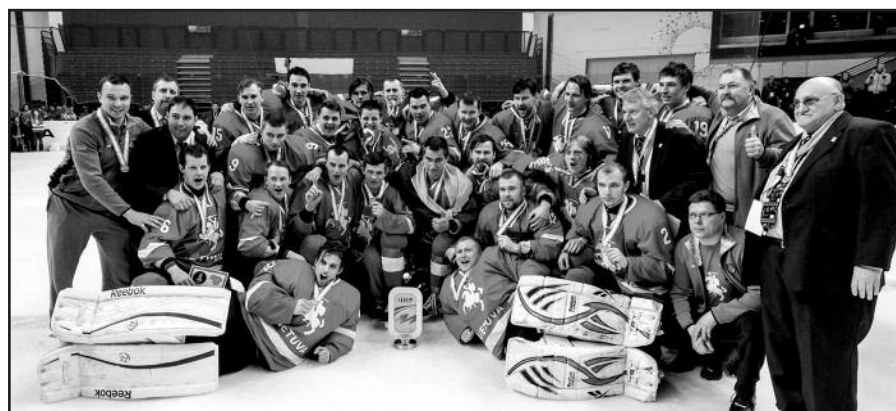
Lietuvos ledo ritulininkams – bronzos medaliai.

Prašome užsiregistruoti 630 257-5613 arba matulaitismission@gmail.com