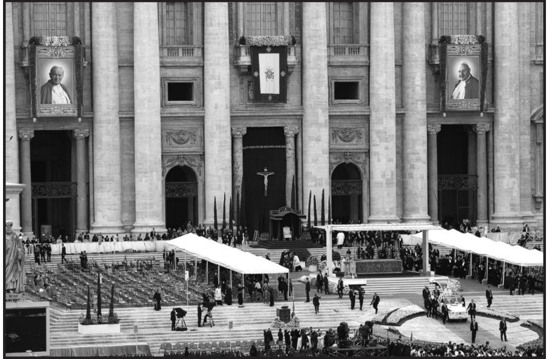
Iškilmės Šv. Petro aikštėje, Joną Paulių II ir Joną XXIII paskelbiant šventaisiais.