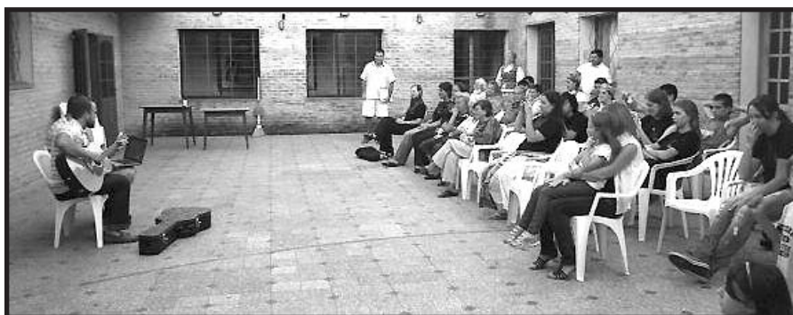
XV Pietų Amerikos lietuvių jaunimo suvažiavimas – Urugvajus 2012 m.

lininkams pradėti masišką skerdienos eksportą į maisto stingančias industrines Vakarų Europos šalis. Šia prasme ir Lietuvos Respublika buvo maisto tiekėja Europos pramoninėms galybėms. O kur dar karo pramonei reikalingos odos ir kitos natūralios žaliavos! Tokios milžiniškos skerdyklos buvo statomos tiesiog uostų prieigose, o šaldyti arba konservuoti gaminiai trumpiausiu ir patogiausiu keliu patekdavo į laivų triumus.