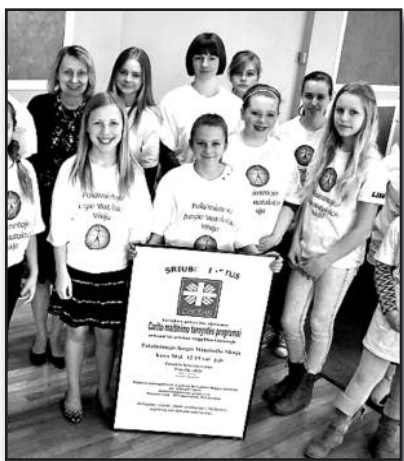
Vilniaus Carito veiklai paremti – 12,000 dol. – 4 psl.