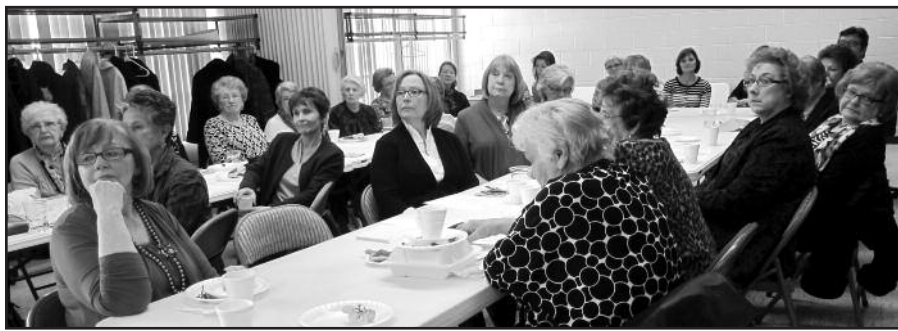
Dalis LDD narių