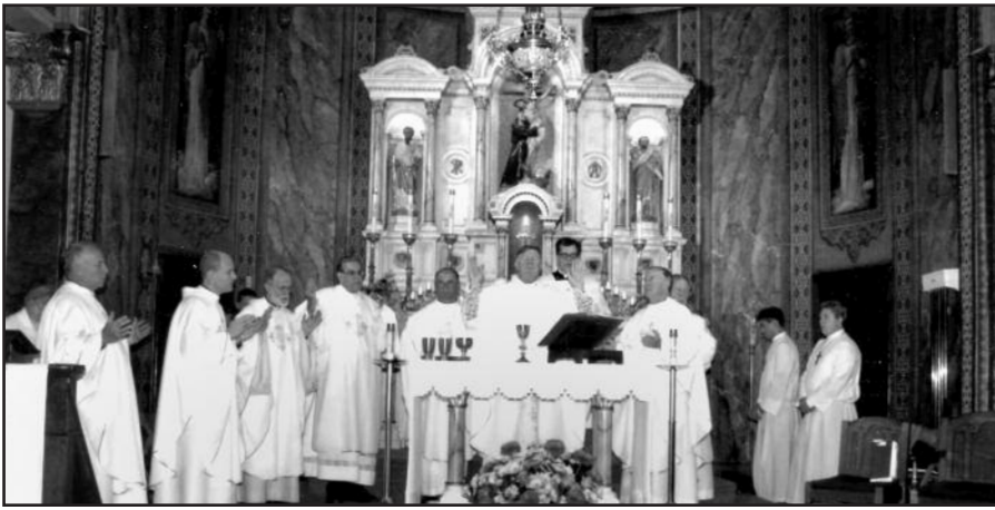
Kunigai aukoja šv. Mišias per Šv. Pranciškaus parapijos 100 metų jubiliejų.