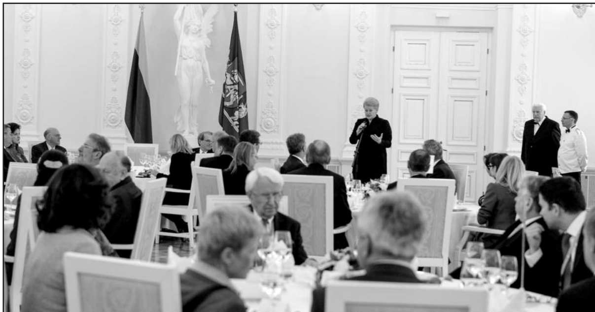
Prezidentės darbo pietūs su ES parlamentų pirmininkų konferencijos nariais

Europinė liepa atsirado susikryžminus dviem