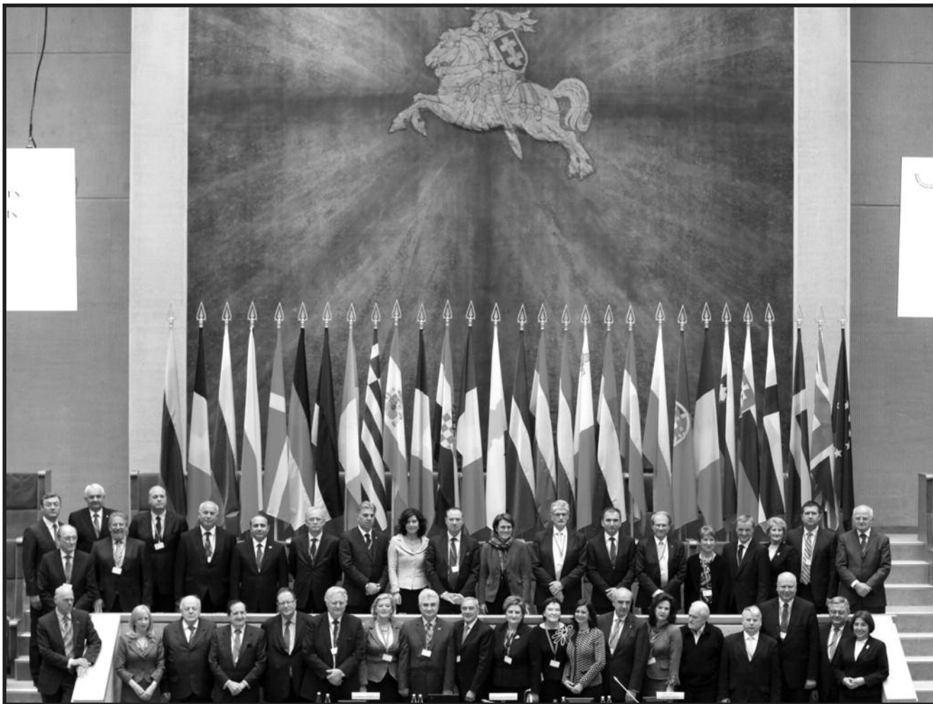
Lietuvos Seime posėdžiavo ES parlamentų pirmininkai.