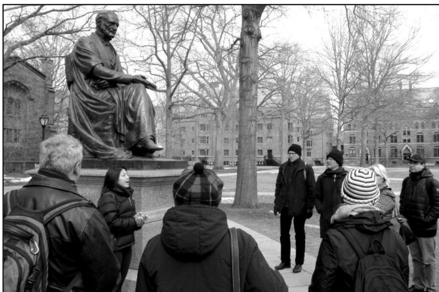
Ne vienas konferencijos dalyvis pasinaudojo proga kartu su gidu apžiūrėti Yale universitetą. Grupė dalyvių prie skulptūros viename iš universiteto kiemų.