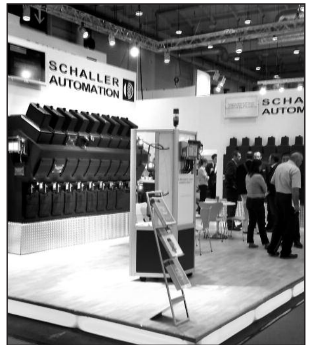
„Schaller Automation“ stendas

– Šioje parodoje, kaip jau minėjau, labai daug dė-