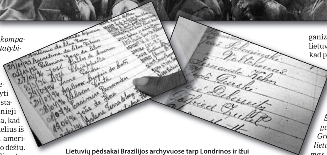
Lietuvių pėdsakai Brazilijos archyvuose tarp Londrinos ir Ižui