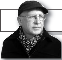
Parengė Vitalius Zaikauskas