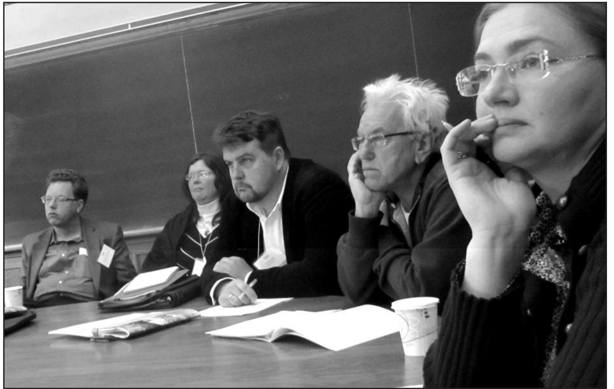
Sesijoje „National(ist) Philosophy and Thought“.

Neįmanoma aprėpti visų konferencijos sesijų, visose neįmanoma dalyvauti, nes daug kas vyksta vienu metu. Vien kalbančių lietuviškomis temomis buvo nemažai – pranešėjai iš Lietuvos bei svetur gyvenantys, kelintos kartos lietuviai ar visai neturintys lietuviško kraujo, bet susidomėję lietuviškomis temomis. Buvo progos išgirsti apie dainų švenčių tradicijas ir svarbą, naujai apie Žemaitę ir moterų literatūrą, okupacijos laikų vestuvinius papročius Lietuvoje, naujienų iš energetikos, istorijos bei politikos. Sužinojome apie JAV universitete studijuojančius latvių kalbą bei apie Lietuvoje besimokančius lietuvių kalbos. Ne viena sesija buvo skirta Pirmojo bei Antrojo pasaulinių karų, okupacijos bei trėmimų pasekmėms – iš politinės, religinės, istorinės perspektyvos ir per prisiminimų rašymą bei tyrimus. Buvo gildinama žydų, holokausto ir karimų istorija bei BATUN (Baltic Appeal to the United Nations – 45 pabaltiečių memorandumas, pasirašytas 1979 m. rugpjūčio 23 d. kaip protesto