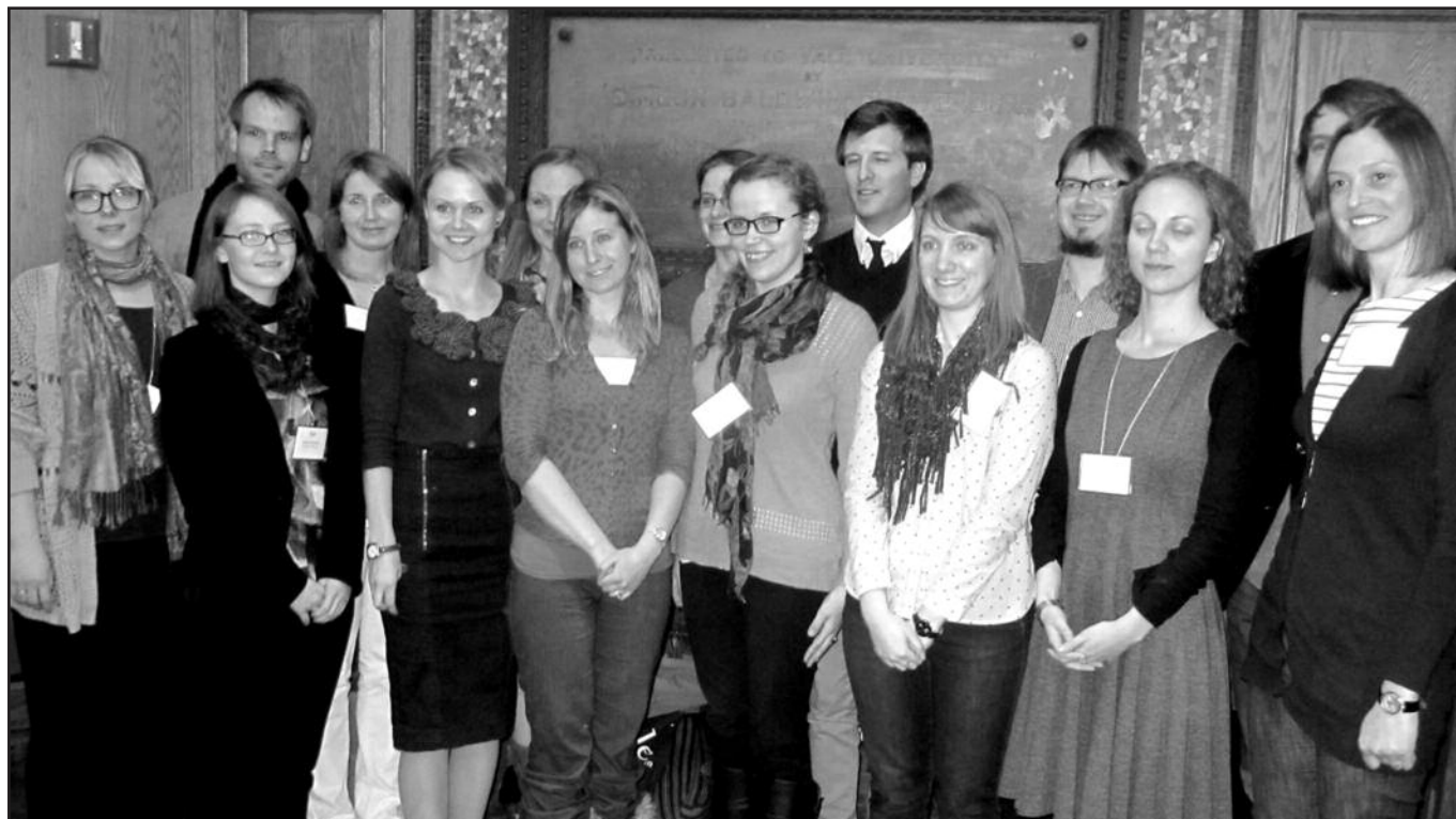
Studentai, konferencijoje skaitę pranešimus, gavo AABS konferencijos dalyvavimo (paramos) stipendijas.

2014 m. konferencija buvo kupina įdomių ir gerai paruoštų pranešimų. Jungtinėje konferencijoje buvo progos pasiklausti pranešimų, pvz., apie Švedijos elektronines knygas ir Amazon plėtrą į šią šalį. Kam įdomu, galėjo sužinoti apie skandinavų tautosaką, detektyvus ir naujausius litera-