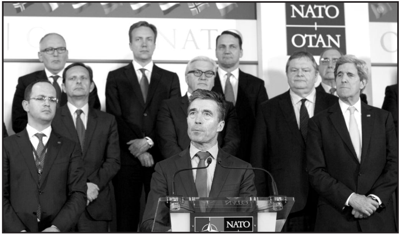
NATO generalinis sekretorius Anders Fogh Rasmussen (viduryje) bei šalių užsienio reikalų ministrai Briuselyje.

NEWSPAPER – DO NOT DELAY – Date Mailed 04-02-14