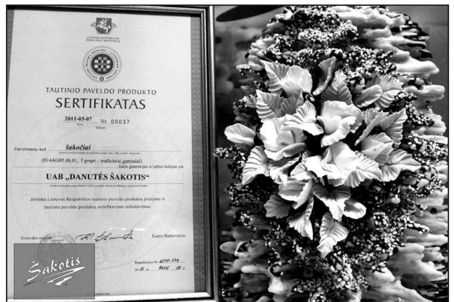
Šakotis su Tautinio paveldo sertifikatu