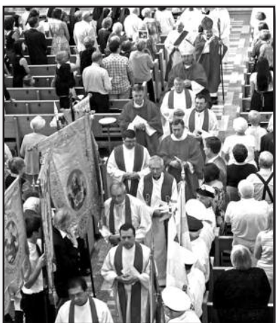
Lietuvių šventovė – ant praradimo slenksčio. – 6 psl.