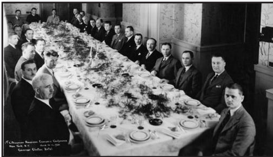
Pirmosios Amerikos lietuvių ekonominės konferencijos dalyviai Niujorke (Governor Clinton Hotel). 1930 m. birželio 10–11 d.