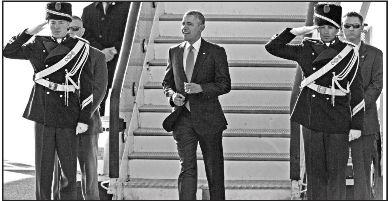
Nusileido lėktuvas, atskraidinęs susitikimo iniciatorių – JAV prezidentą Barack Obama.

NEWSPAPER – DO NOT DELAY – Date Mailed 03-24 –2014