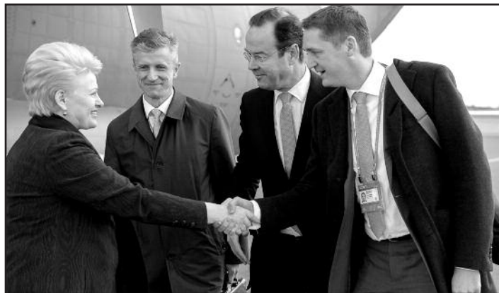
Pasitinkama Lietuvos vadovė Dalia Grybauskaitė.

Haga (ELTA) – Kovo 24 d. Hagoje prasidėjusiame pasaulio šalių vadovų dviejų dienų susitikime branduolinio saugumo klausimais daugiausia dėmesio turėtų sulaukti branduolinio terorizmo grėsmės. Lietuvai susitikime atstovauja Prezidentė Dalia Grybauskaitė.