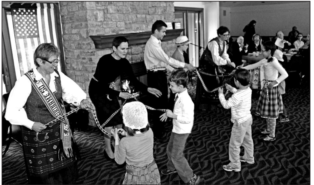
Sekmdieninės mokyklos „Aitvaras” vaikai ir tėveliai šoka juostų suktnį