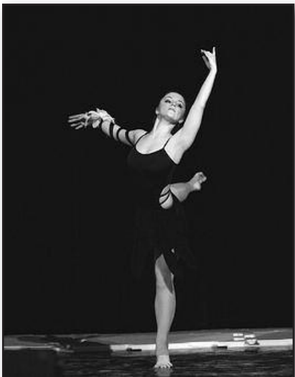
Vilties aitvarai plasnoja į Lietuvą – 4 psl.