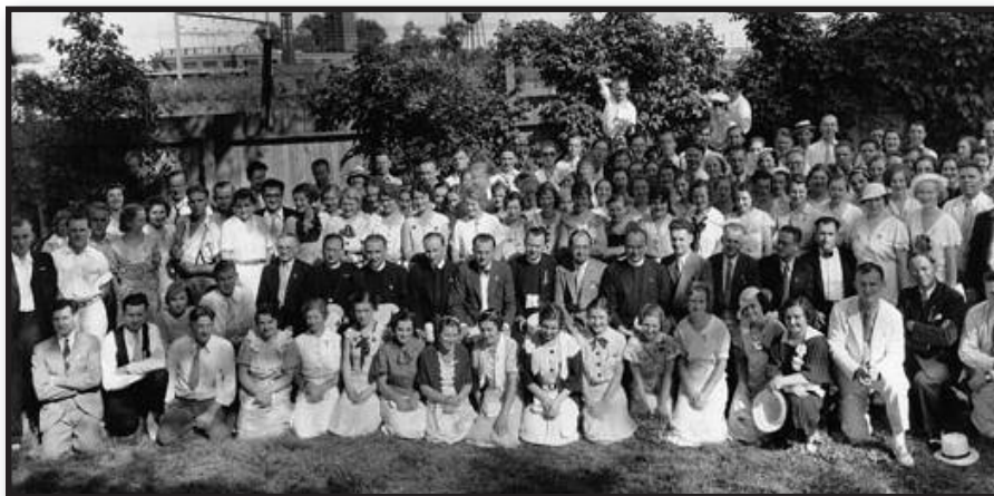
Lietuviai mokyklos baigimo šventėje (kažkur Amerikoje... XX a. 1947)

legatams, bet moka jiems dienpinigius per valstybinę emigracijos įstaigą. 260