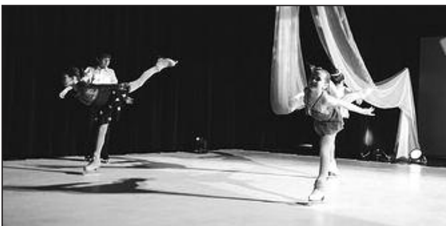
Jaunieji čiuožėjai skraidė po sceną.

Siunčiant čekius: Mamu Unija, Edita Zasimauskaitė, c/o Mamu Unija, 2154 Countryside Circle, Naperville, IL 60565.