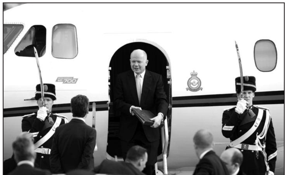
Į Hagą atvyko Didžiosios Britanijos užsienio reikalų sekretorius William Hague

Kadangi branduolinių objektų ir medžiagų apsauga tradiciškai laikoma valstybės vidaus politikos reikalu, viršūnių susitikimo dalyviai susitelkia ties konkrečių valstybių įsipareigojimais ir teisiškai neįpareigojančiais susitarimais.