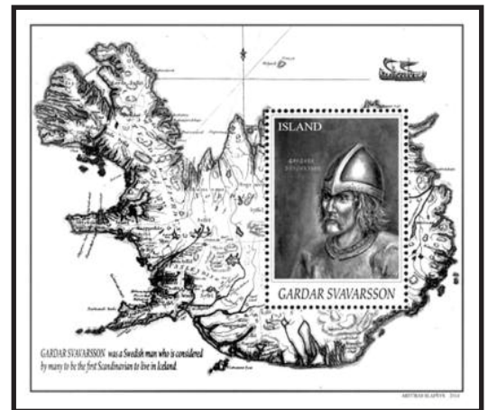
Islandams sukurto pašto ženklų projektas.

„Vieną portretą ant drobe aptraukto kartono, dirbdamas nuo ryto iki vakaro, nutapau maždaug per savaitę. Dabar jau yra 45 portretai, o visas šis ciklas buvo sukurtas per maždaug dvejus metus. Istorines asmenybes, kurios žinomos iš kitų menininkų darbų, ir aš tapau panašias, bet kai kurie iš tų valdovų niekada nebuvo tapomi, tad sunku išsivaizduoti, kaip tiksliai ji atrodė. Tai turbūt ir nėra svarbiausia – svar-