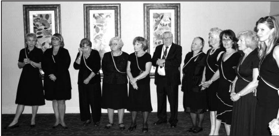
Filisteriai iškilmingoje sueigoje.