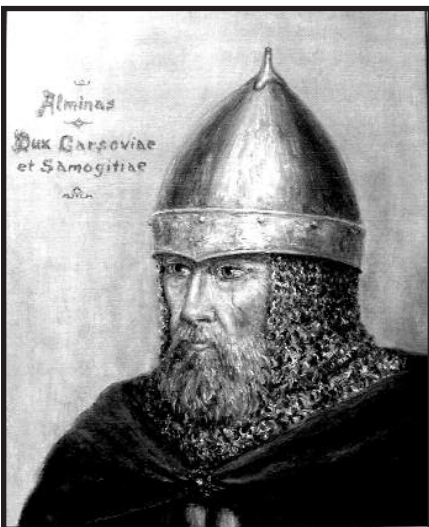
Lietuvos valdovų ciklas prasidėjo nuo kunigaikščio Almino portreto.

„Džiaugiuosi, kad idėjų ir darbų išties netrūksta, turiu ir daug sumanymų ateičiai. Amerikoje aš įgijau didžiulę patirtį, susiformavau ir atsiskleidžiau kaip menininkas, o gautas žinias bei patyrimą dabar galiu sėkmingai pritaikyti tėvynėje“, – sakė dailininkas.