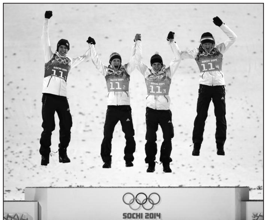
Vyrų šuolių su slidėmis nuo tramplyno komandų varžybas laimėjo Vokietijos rinktinė.