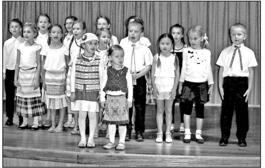
„Saulutės“ mokiniai gieda Lietuvos himną.