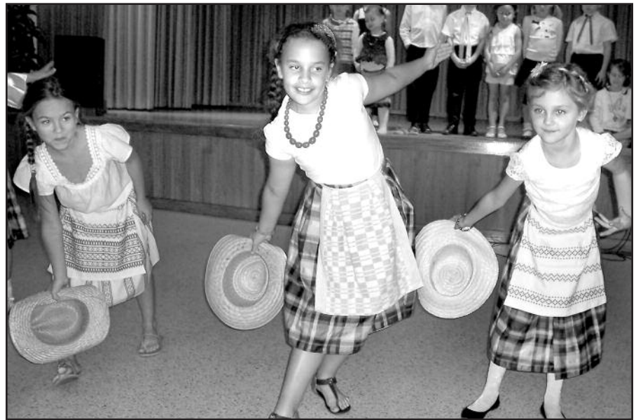
Smagu šokti „Kepurinę“.