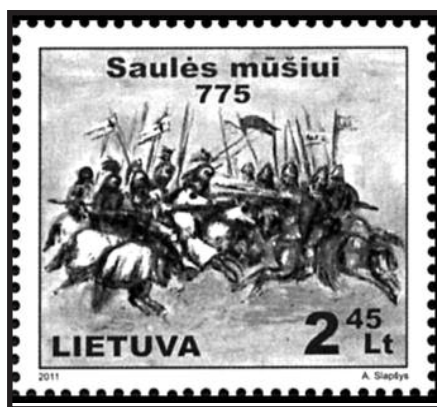
Pašto ženklas, skirtas Saulės mūšio sukakčiai.