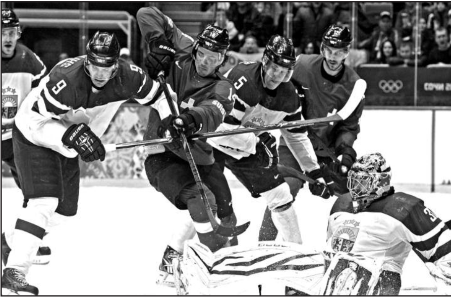
Iveikę Šveicarijos komandą, Latvijos ledo ritulininkai iškopė į ketvirtfinalį.

Sočio žiemos olimpinė žaidynių vyrų ledo ritulio varžybų aštuntfinalyje antradienį, vasario 18 d. Latvijos rinktinė 3:1 (2:0, 0:1, 1:0) įveikė pasaulio vicečempionus Šveicarijos ledo ritulininkus.