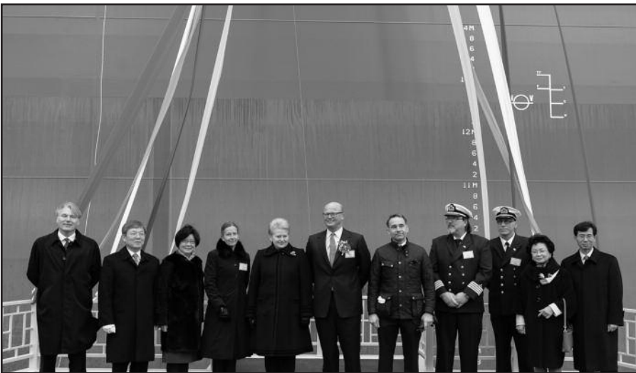
Prezidentė (5-ta iš k.) Pietų Korėjos mieste Ulsanoje dalyvavo Klaipėdos suskystintų gamtinių dujų (SGD) terminalo laivo inauguracijos ceremonijoje.