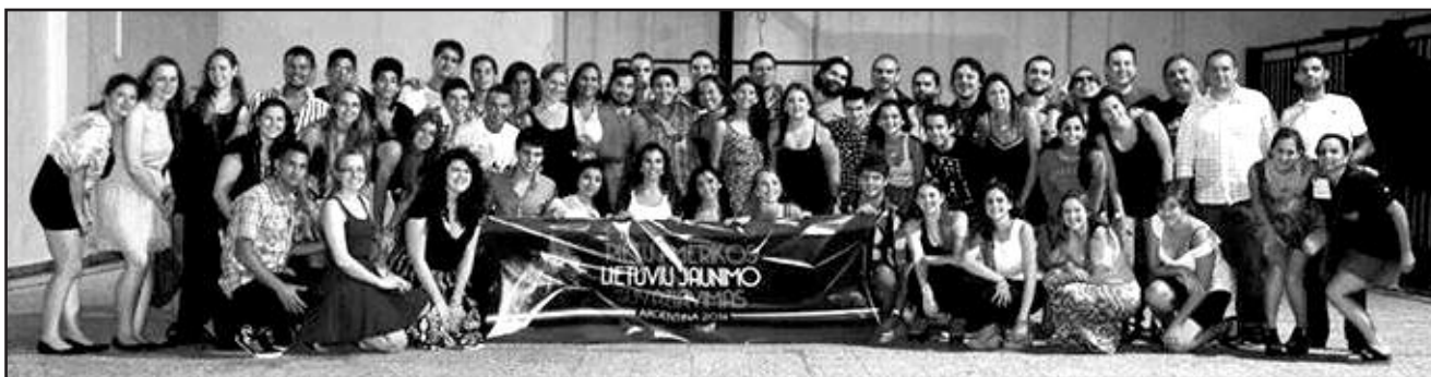
XVII Pietų Amerikos lietuvių jaunimo suvažiavimo dalyviai.