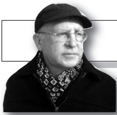
Parengė Vitalius Zaikauskas