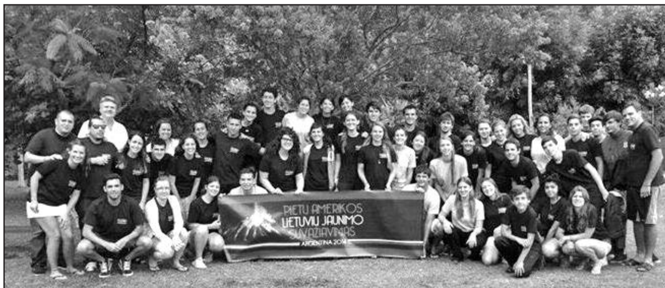
Suvažiavimo dalyviai stovyklavietėje Berisso.