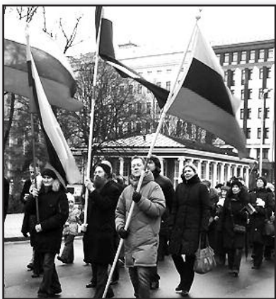
Vasario 16-oji – aplink pasaulį – 10 psl.