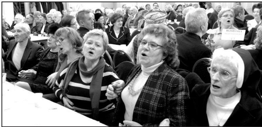
Minėjime dainuojančių netrūko.

kią, kuria mes didžiutumą". Pasak konsulo, tam reikia išsipareigojimo domėtis Lietuvos politine padėtimi, dalyvauti Lietuvos rinkimuose, o Amerikos lietuviai turėtų ir toliau įtaigoti savo atstovus Washingtono rūpintis Lietuvos laisvės išlaikymu.