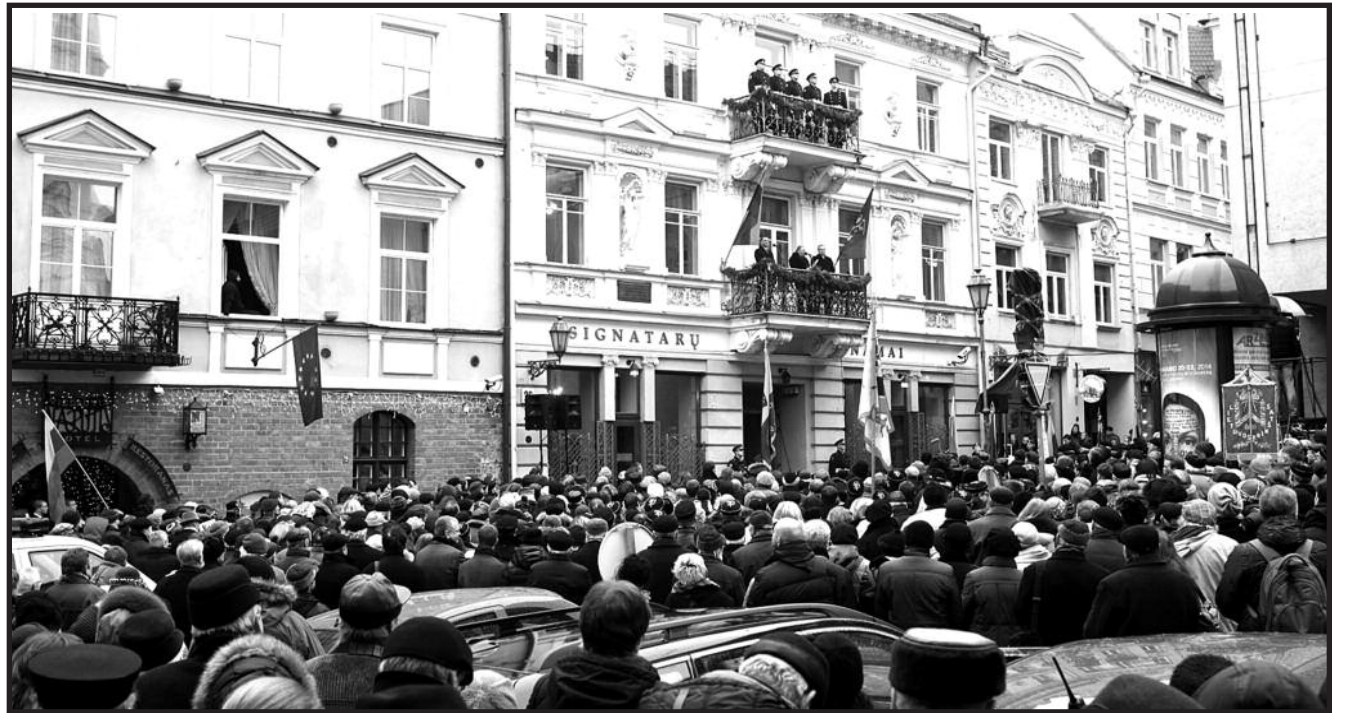
Minėjimas Vilniuje priminė Sąjūdžio laikų dvasią.