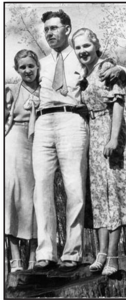
Amerikos lietuvių ūkininkų šeima. 1934 m.