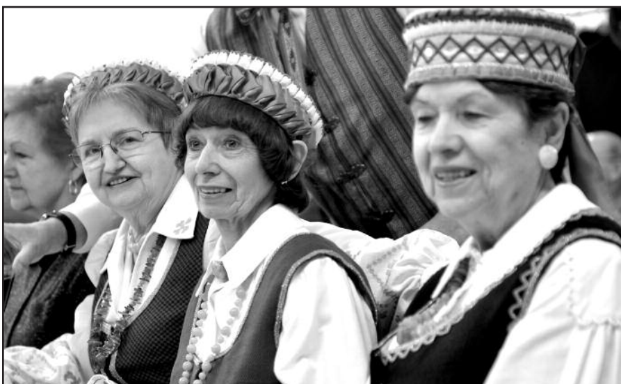
Kai kurios dalyvės pasipuošė tautiniais drabužiais.

Saugumo taryboje. Generalinis konsulas pabrėžė: „Tačiau visa, ką esame pasiekę tarptautinėje arenoje, neatleidžia nuo pareigos toliau auginti ir kurti savo valstybę, kurti viduje ją to-