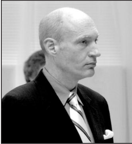
Paskaitininkas Thaddeus McCotter