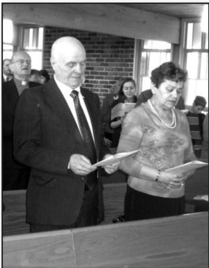
Pažadų atnaujinimo minėjimas – 4 psl.