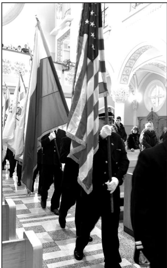
Iškilmėse dalyvavo Lietuvos Šaulių sąjungos išėivijoje nariai.

Į ALTo minėjimus jau daugelį metų kviečiami nelietuviai prelegentai, susižavėję lietuvių tauta ir jos laisvės siekiais. Stebėdami lietuvius iš ša-