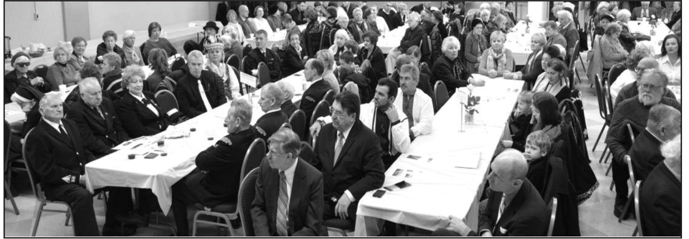
Gausiai susirinkę minėjimo dalyviai atidžiai klausėsi prelegentų.