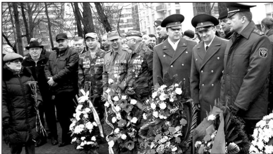
Vilniuje paminėtos 25-osios sovietų armijos išvedimo iš Afganistano metinės.