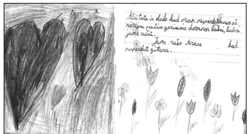
Lietuvos vaikai dėkojo už išpildytas svajones.

„Ačiū visiems tautiečiams ir kitataučiams, kurie prisijungė prie projekto „Vaikų svajonės“ įgyvendinimo, pildė vaikų svajones ir paaugojo didelę sumą Alytaus rajono Alovės vaikų dienos centrui