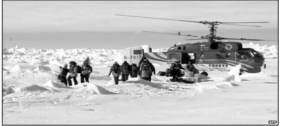
Išgelbėti laivo keleiviai.