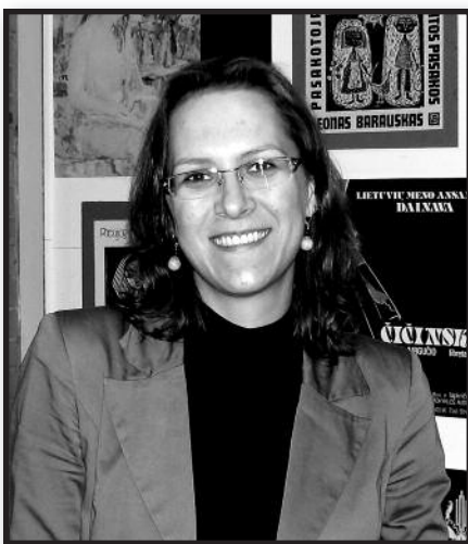
Tyrinėjanti religingumą. – 12 psl.