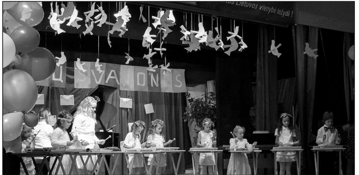
Mažieji atlikėjai padovanojo gražų koncertą.

Pavyzdžiui Alovės vaikų dienos centro atstovai minėjo, kad Centro 181 kv. m patalpos yra nešildomos. Renginiams darbuotojai pasiūlė patalpas senutėliu elektriniu šildytuvu, tačiau kasdien šildytis elektra yra per brangu. Žiemą, nors ir šalta, dieji susirenka, o mažiukų tėvai neleidžia, nors tikėtina, kad yra tokių šeimų, kurių namuose ne ką šilčiau. Norint išspręsti Alovės vaikų dienos centro apšildymo problemą, reikėtų bent jau poros šiuolaikiškų energiją taupančių radiatorių, o jei pavyktų surinkti daugiau pinigų, galima būtų įsigyti krosnelę ir apšildymo sistemą, kad visose patalpose