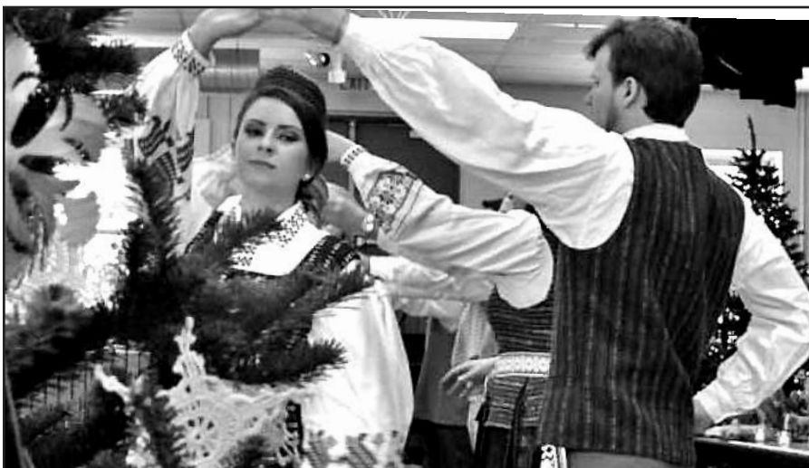
Tautinių šokių kolektyvas „Dobilas“ šoko lietuvių liaudies šokį „Ant kalno karlai siūba-vo”.