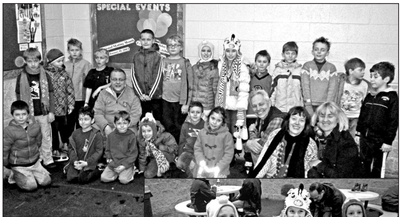
Čiuožimo iškylos dalyviai.

Beveik visi ant ledo išbandė savo gabumus, o keletas pirmą sykį gyvenime užsidėję pačiužas, pasinaudojo proga pasimokyti su čiuožyklos instruktoriais. Laiškas prabėgo greitai. Prieš skirs-