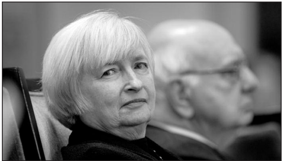
Janet Yellen paskirta Centrinio banko vadove.