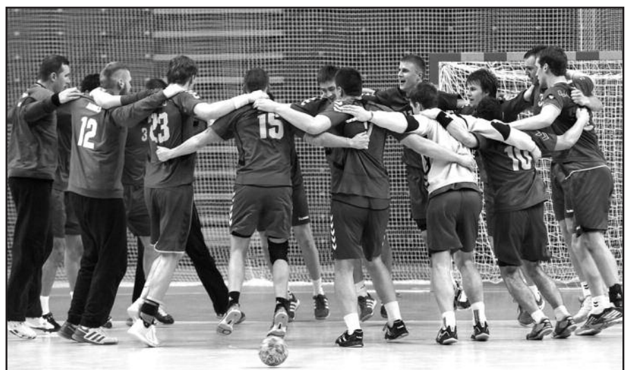
Lietuvos rankininkai pasaulio čempionato atrankoje nugalėjo suomius.