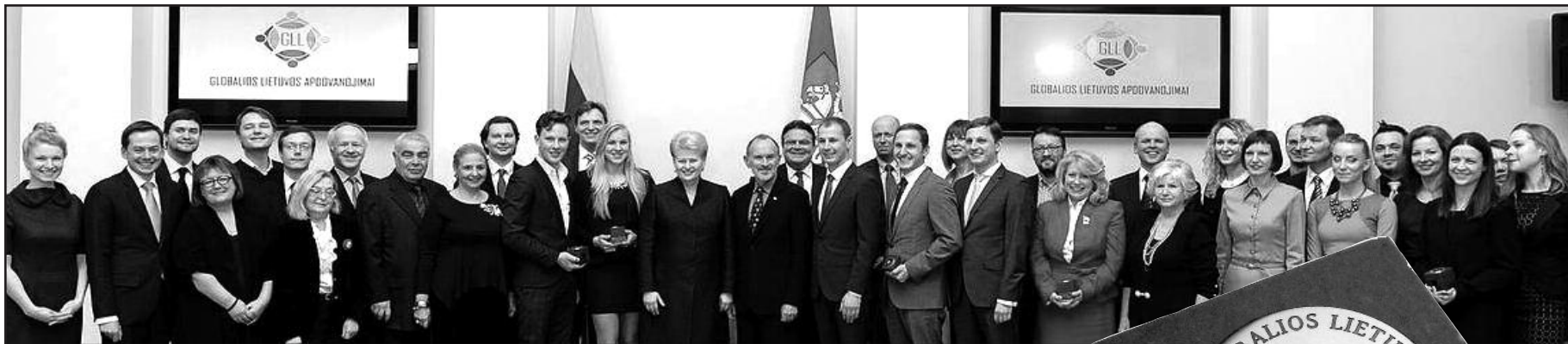
Visiems devyniems „Globalios Lietuvos apdovanojimus“ gavusiems žmonėms įteiktos skulptoriaus Stasio Žirgolio statulėlės, įamžinančios apdovanojimo stiprybę ir principingumą.