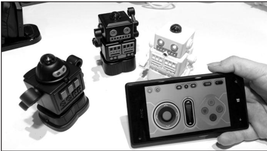
Atidaryta elektronikos paroda Las Vegas.