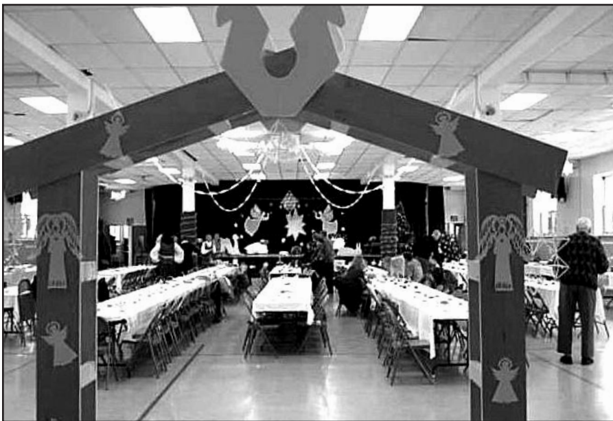
Rochesterio lietuvius švęsti Kūčių kvietė talpi salė.

ir Tradicinių Kūčių organizatoriai: Rochester lietuvių draugija ir E. Gervicko lituanistinė mokykla.