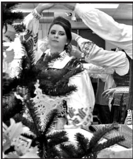
Rochesterio lietuvių Kūčios. – 5 psl.