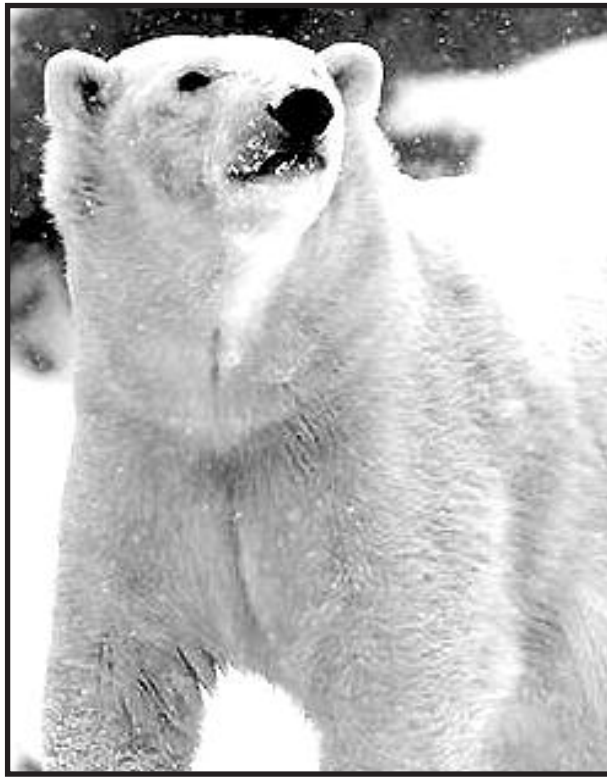
Lincoln Parko zoologijos sodo gyventoja Anana.

Embarraso miestelyje Minnesotoje antradienį buvo užfiksuota žemiausia temperatūra Jungtinėse Valstijose