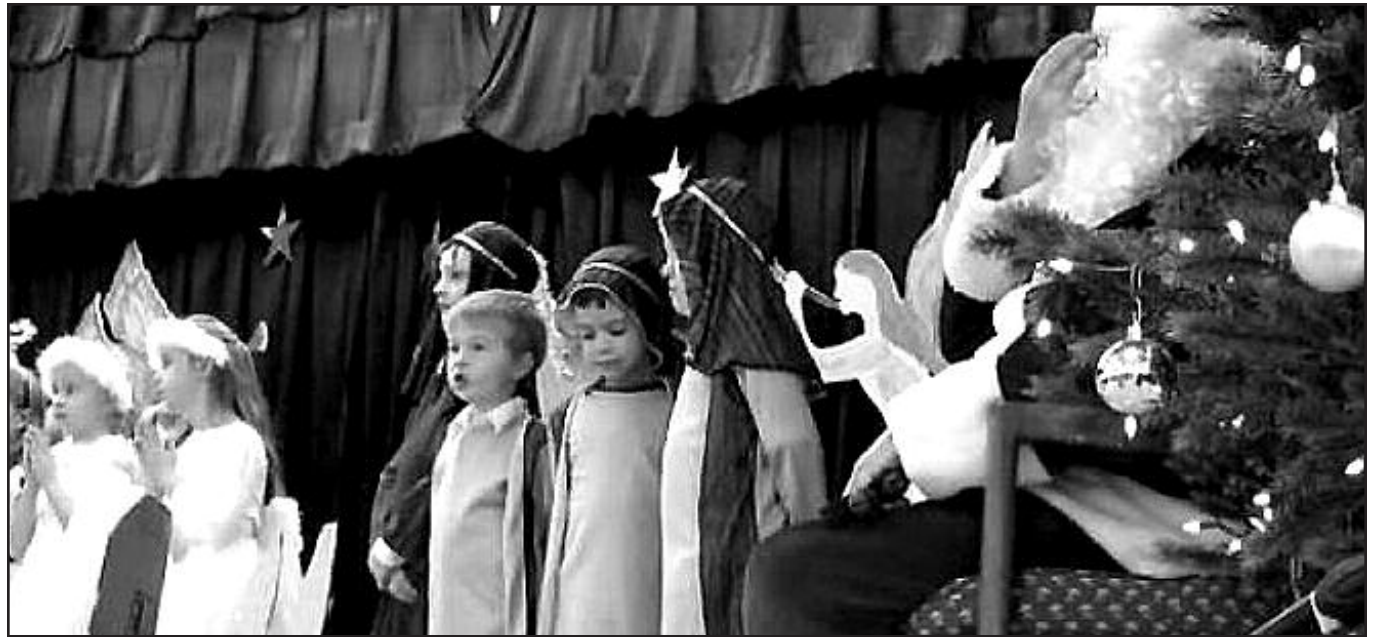
Vaičių pasirodymą atidžiai stebėjo Kalėdų senelis.

Vietinė tautinių šokių grupė „Dobilas“ su žvakutėmis šoko lietuvių liaudies šokį „Ant kalno karlai siūba-