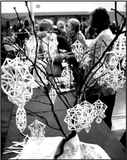
Kalėdinė mugė PLC. – 4 psl.