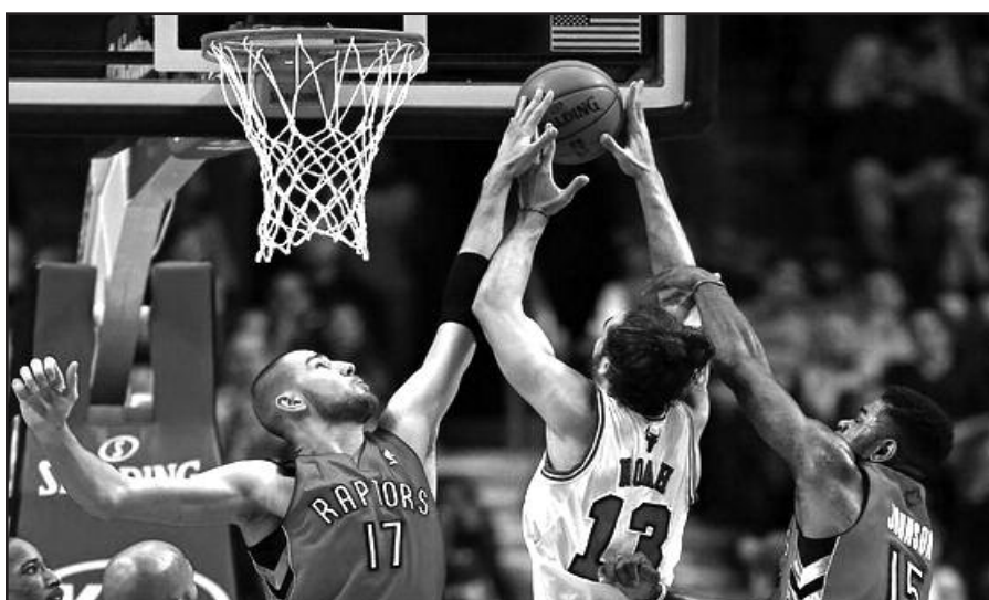
Lietuvis J. Valančiūnas vis tvirčiau jaučiasi rungtyniaudamas NBA.