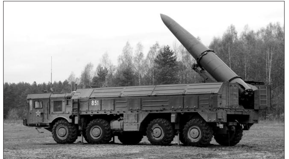
Rusų raketa „Iskander“.