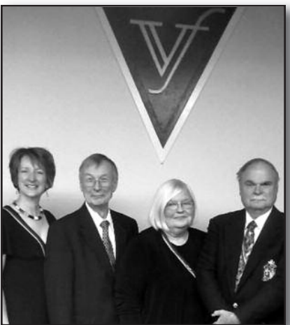
Vydūno jaunimo fondo veikla ir rūpesčiai. – 6 psl.