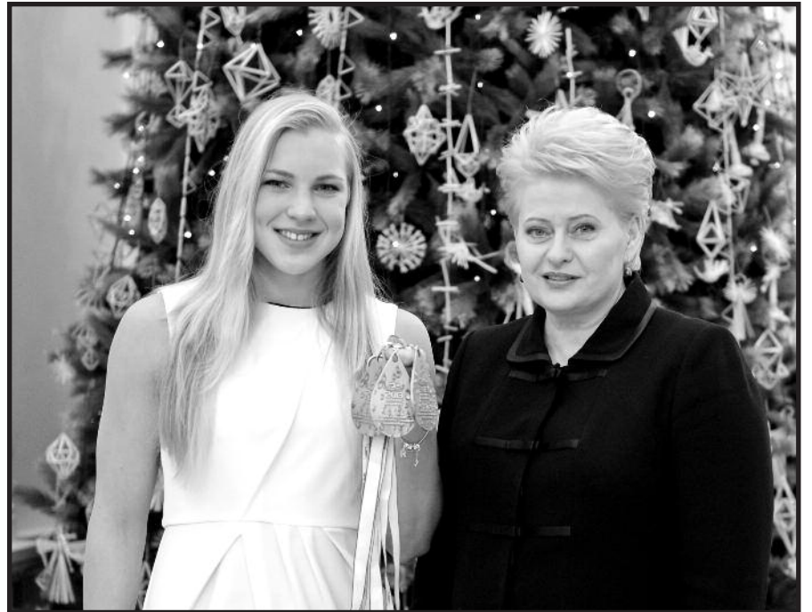
Lietuvos Respublikos prezidentė Dalia Grybauskaitė sveikindama plaukikę Rūtą Meilutytę teigė, kad Danijoje iškovotos plaukikės pergalės – didžiulė kalėdinė dovana visiems šalies žmonėms.