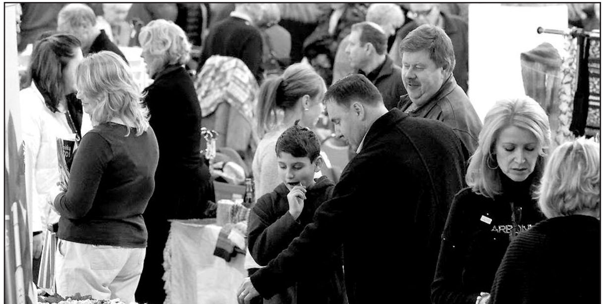
Kaziuko mugė – kasmetinė PLC rengiama šventė, kurios metu amatininkai ir menininkai pardavinėja savo dirbinius, susitinka su draugais bei šaučiai bendrauja tarpusavyje.