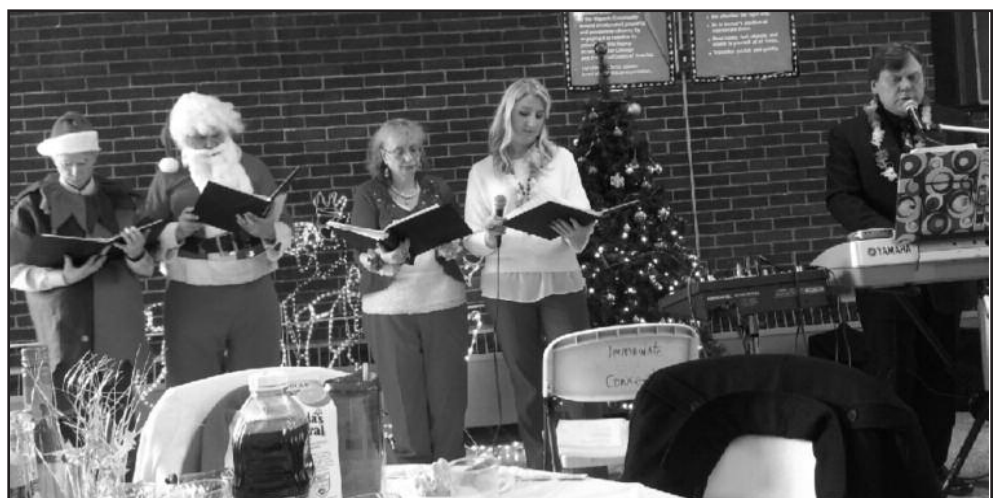
Artėjančių Kalėdų proga Brighton Parko Švč. Mergelės Marijos Nekalto Prasidėjimo parapijoje sekmadienį, gruodžio 15 d. buvo surengtas pobūvis. Susirinkę draugėn lietuviai muzikavo, vaišinosi, bendravo.