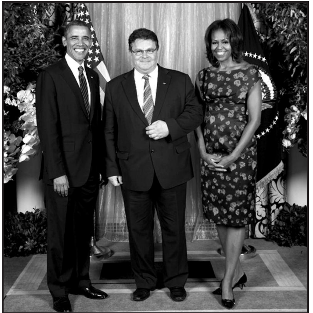
Užsienio reikalų ministras Linas Linkevičius (v.) ir JAV Prezidentas Barack Obama su žmona Michelle.

Susitikime su Etiopijos Užsienio reikalų ministru Tedros Adha-