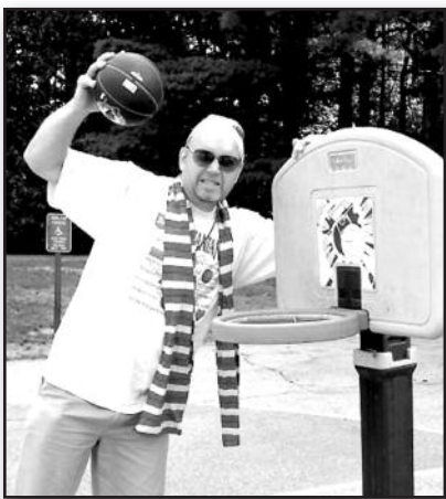
Ir Bostone yra lituanistinė mokykla? – 5 psl.