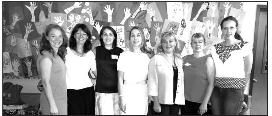
Bostono lituanistinės mokyklos mokytojos ruošiasi naujiems mokslo metams.