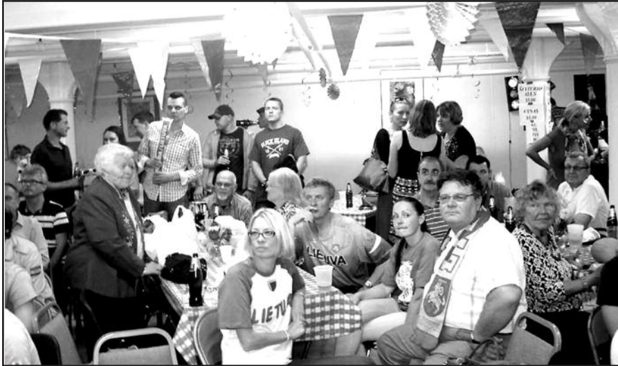
LR Užsienio reikalų ministras Linas Linkevičius kartu su New Yorke lietuviais žiūrėjo Europos krepšinio čempionato finalą.

Šv. Mergelės Marijos apreiškimo parapijos rudens piknikas New Yorke šiemet netikėtai sutapo su Europos vyrų krepšinio čempionato finalo rungtynėmis, kuriame dėl aukso medalio su Prancūzijos komanda kovojo Lietuvos vyrų rinktinė.