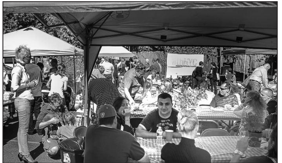
Po vasaros atostogų lietuviai susitiko LithNYC piknike.