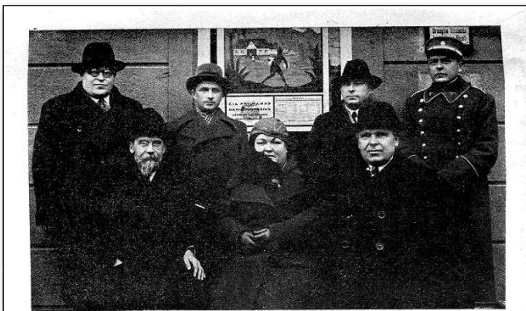
Draugijos Užsienio Lietuviams Remti Centro Valdyba.

Ilgai išgyvenę ant Baltijos jūros krantų, išlaikę savo gimtąją kalbą