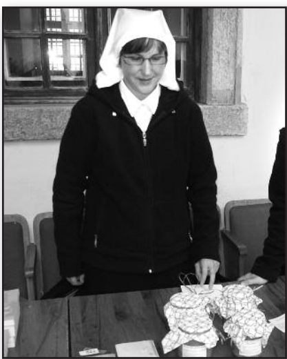
Tradicinė mugė Pažaislyje – 10 psl.