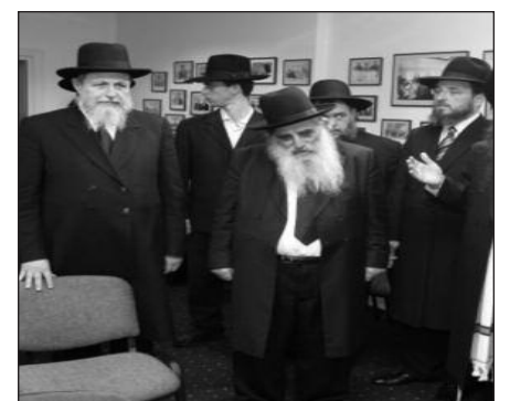
Litvakų kongresas Lietuvoje.

nojamąjį turtą įstatymą. Įstatyme numatyta per 10 metų išmokėti žydams 128 mln. litų kompensaciją.