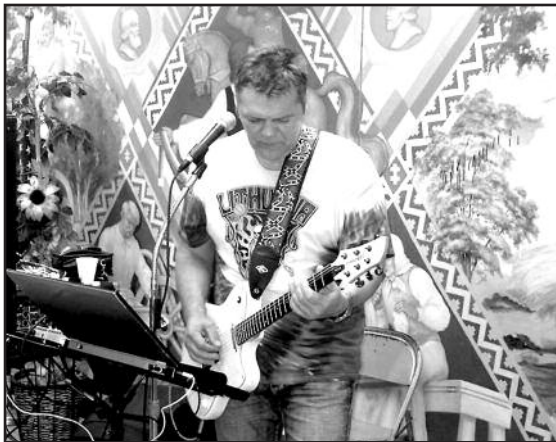
Parapijos salėje koncertavo „Kolorado Romas“.