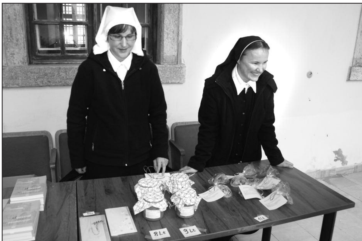
Mugėje buvo siūlyta ir kepinų, ir su meile bei malda, be pykčio išvirtos uogienės.

Mugėje jos lankytojai noriai rinkosi ir džiovintas vaistažoles, arbatas bei prieskonius, juos domino ir nerti, siūti, siuvinėti bei iš molio nulipdyti suvenyrai, taip pat megztos vilnonės kojines. Čia