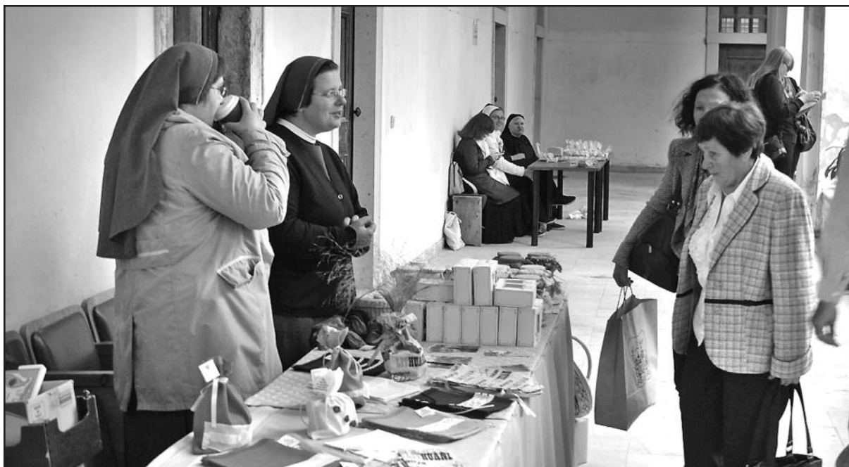
Mugėje lankytojų netrūko.

Mugę Pažaislyje aplankę kauniečiai ir svečiai iš kitų miestų džiaugėsi gražiu rudenišku oru, maloniai bendravo su seserimis vienuolėmis, noriai pirkė jų gaminius ir namo skirstėsi pakilios nuotaikos.