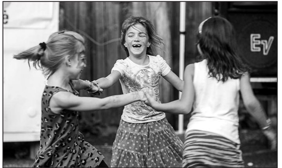
Vaikams netrūko žaidimų.