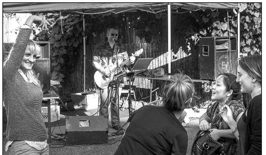
„Kolorado Romai“ šis savaitgalis buvo užimtas – šeštadienį linksminęs LithNYC dalyvis, sekmadienį jis skubėjo į Apreiškimio parapijos pikniką.