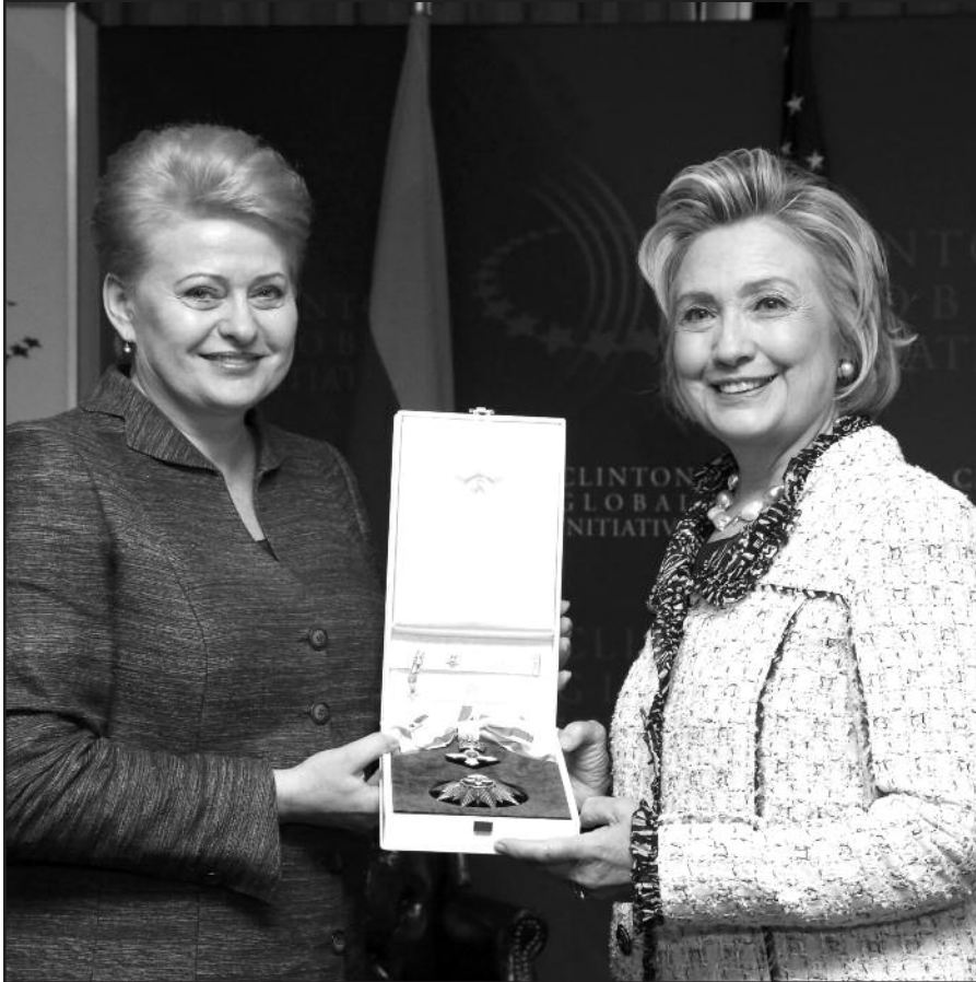
Prezidentė įteikė valstybės apdovanojimą H. Clinton.