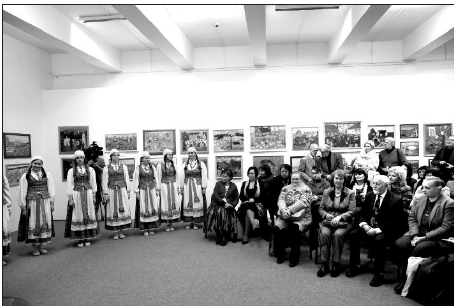
Pagerbti M. Bičiūnienės konkursinės parodos laureatai.

Konkursinei parodai Lietuvos nacionalinis muziejus išleido katalogą „Primityvioji tapyba”.