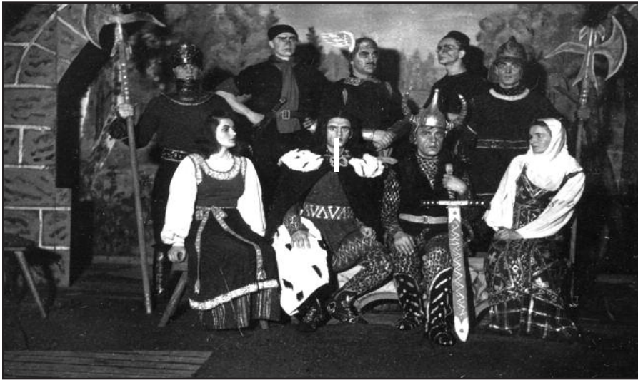
Dramos „Mirga“ veikėjai, 1947 rugsėjo 8 d.