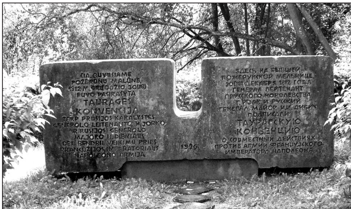
Paminklas buvusio malūno vietoje, statytas 1976 m.

Šventės tęsinys – Staiginės kaimo žemėje ant Ežerūnos upės kranto prie konvencijai skirtos