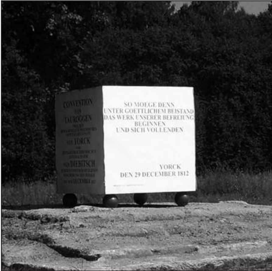
Paminklo Tauragės konvencijai maketas, pastatytas 2009 m. metais.