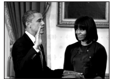
B. Obama priesaika.

Sausio 20 d. rytą per atskirą ceremoniją JAV karinio jūrų laivyno observatorijoje prisaikdintas ir viceprezidentas Joe Biden. Pagal tradiciją, kurios laikomasi tada, kai inauguracijos diena būna sekmadienis, B. Obama priesaiką pakartojo per viešą ceremoniją pirmadienį. Prie JAV Ka-