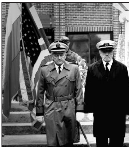
Šauliai paminėjo Klaipėdos krašto išlaisvinimo 90-metį – 4