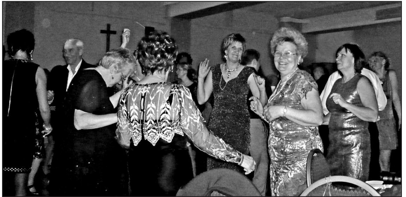
Belaukiant Naujųjų metų susirinkusieji šoko, trypė skambant „Cigarų“ muzikos garsams.