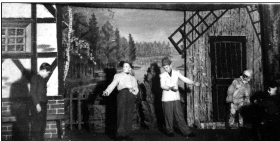
„Batuotas katinas“, 1947 gruodžio 26 d. Pats basas, o nori katiną apaut. . .