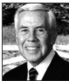
Sen. Richard Lugar

NATO skirtas Suskystintų dujų įstatymas leistų pakelti NATO sąjungininkus į vieną lygį su visais likusiais laisvos prekybos partneriais ir išduoti licencijas dujų eksportui.