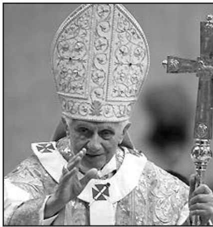
Popiežius Benediktas XVI.

Vilnius (Bernardinai.lt) – 2012 m. sausio 1 d., švenčiant Mergelės Marijos Dievo Gimdytojos iškilme, bus minima jau 45-oji Pasaulinė taikos diena. Būsimosios Taikos dienos tema – „Ugdyti jaunimą teisingumui ir taikai“. Gruodžio 16 d. Šventojo Sosto spaudos salėje buvo pristatyta