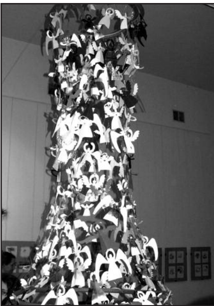
Ir užaugo Angelų sodas.