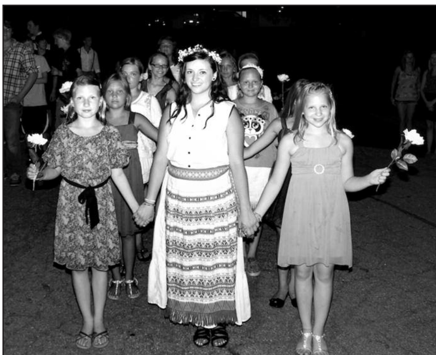
Lietuviškų vestuvių „Sadutė“.