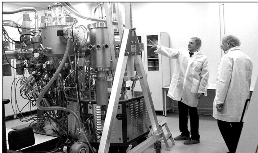
Pažangiųjų technologijų verslas – Lietuvos ūkio ateitis.

Lietuvoje yra daug gabių ir talentingų mokslininkų, tačiau pagal išradimų taikymą Europos Sąjungoje