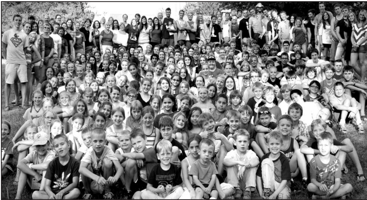
2012 m. „Lithuanian Heritage“ stovyklos dalyviai.

Prisimename šių metų „Lithuanian Heritage“ stovyklą Dainavoje