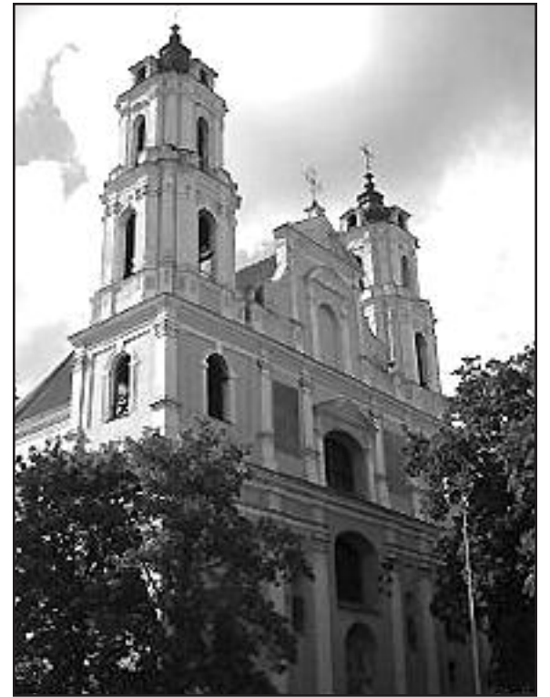
Šv. apaštalo Pilypo ir Jokūbo dominikonų bažnyčia Vilniuje.