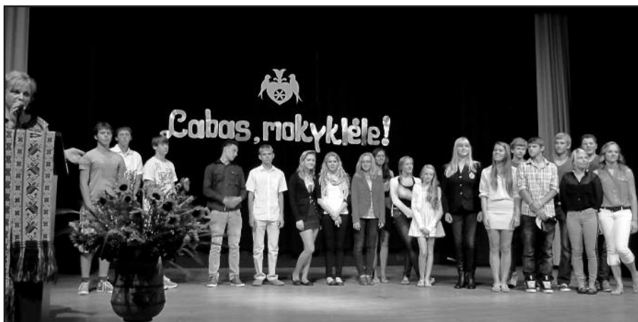
2012 m. rugsėjis – paskutinis šių mokslo metų Čikagos lituanistinės mokyklos dešimtokams.