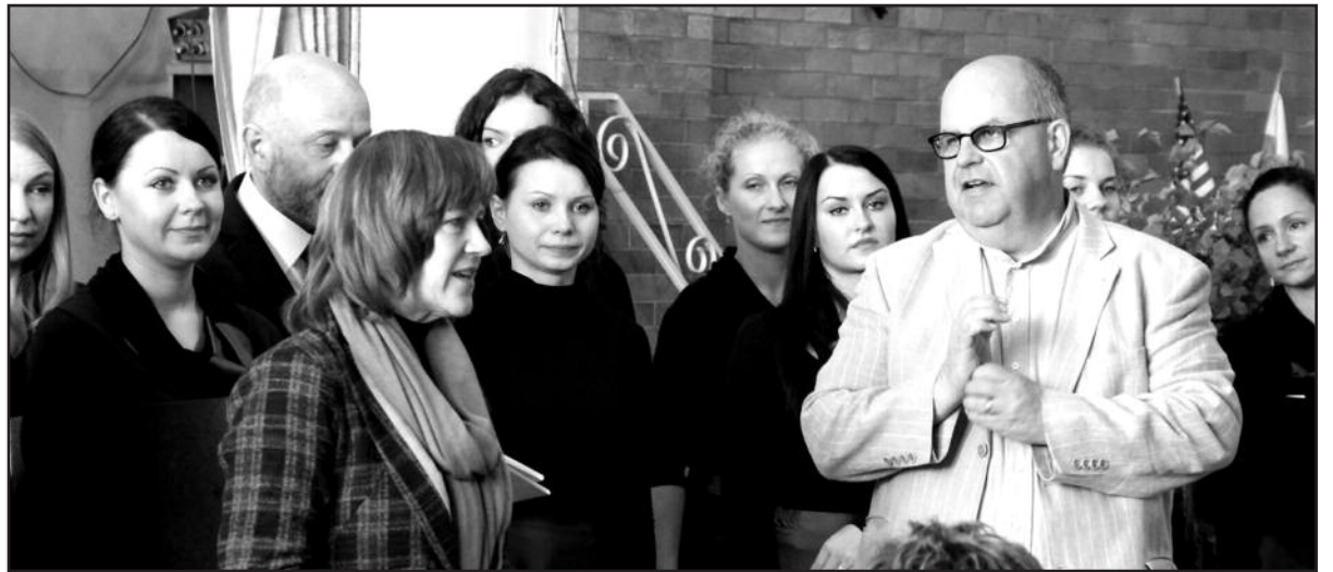
Susitikimas su Omaha lietuvių bendruomene.