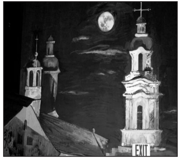
Freskos su Vilniaus vaizdais puošia kavinės sienas.