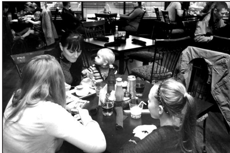
Lietuviškoje kavinėje patiekalai ir lietuviškos prekės.