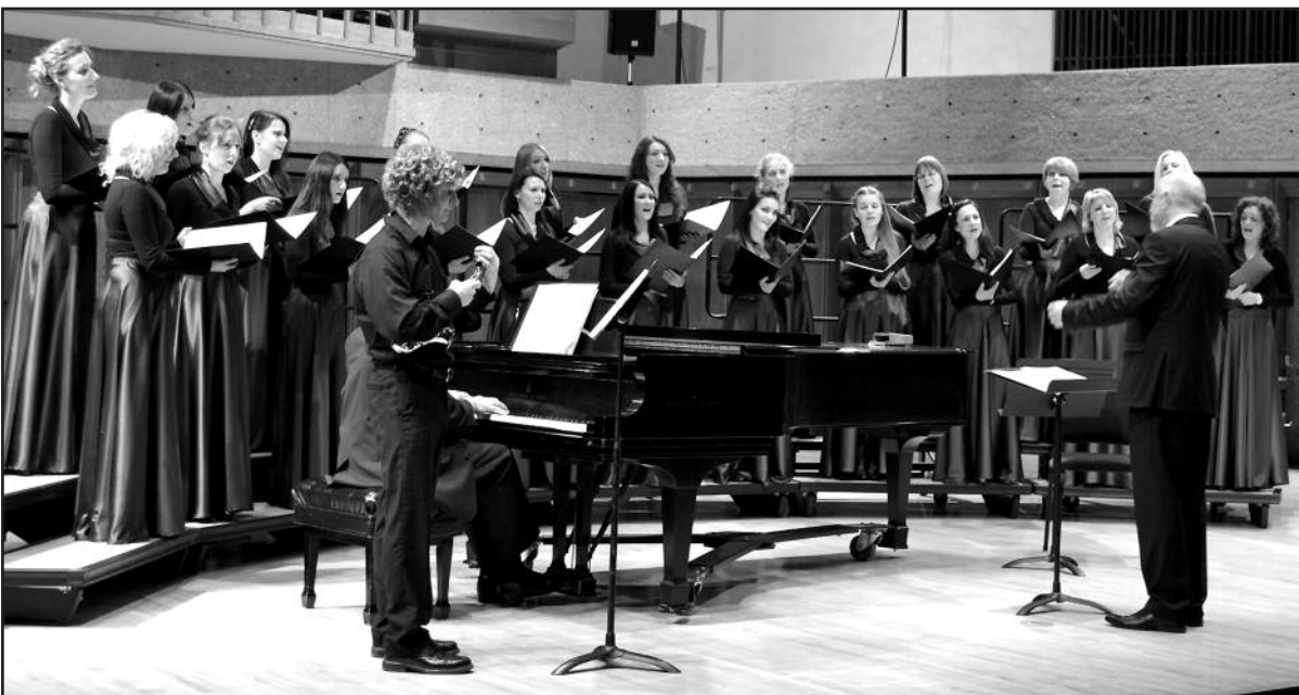
Choro „Pavasaris“ koncertas.