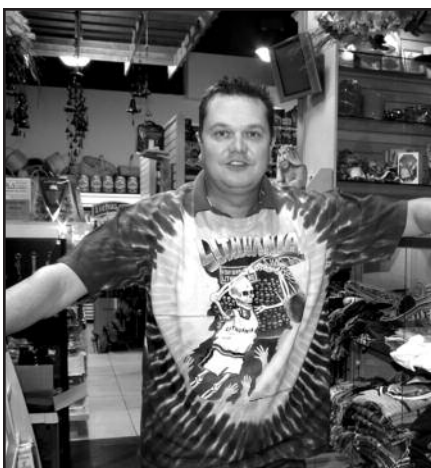
Čikagoje – lopinėlis senojo Vilniaus – 12 psl.