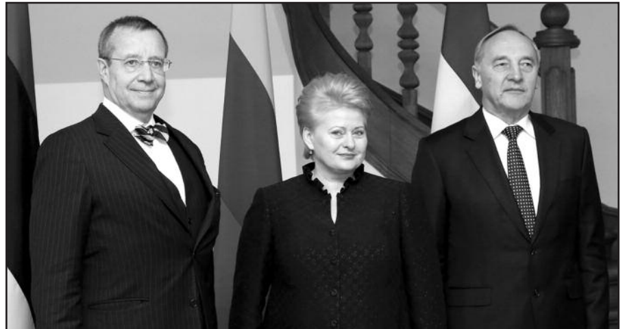
Lietuvos, Latvijos ir Estijos prezidentai Dalia Grybauskaitė, Andris Berzinis (d.) ir Toom Hendrik Ilves.

Bendri siekiai Baltijos šalis vieni derybose dėl septynmetės europinės paramos. Lietuva, Latvija ir Estija siekia, kad žemės ūkio išmokos ūkininkams greičiau artėtų prie ES vidurkio, o skirstant sanglaudos fondų lėšas būtų atsižvelgta į specifinę Baltijos valstybių padėtį. Visos trys šalys labiausiai nukentėjo per krizę, todėl bendras tikslas, kad Baltijos valstybėms būtų taikomos išim-