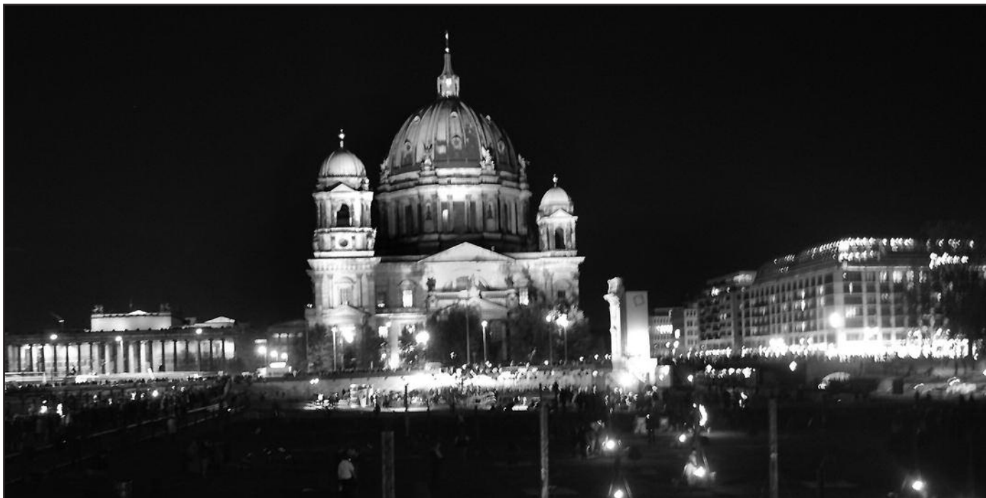
Miestas tą vakarą skendėjo šviesose.

Kupina ugnies ir netikėtumų šventė Berlyne baigėsi tik prieš vidurnaktį, kai pradėjo gesti liepsnos, ir namo ėmė skirstytis žmonės. Įspūdingu reginiu Berlynas įrodė savo kūrybiškumą, įvairovę, o šimtai tūkstančių šventėje apsilankusių žmonių tikrai patyrė ilgam įsimenančių įspūdžių.