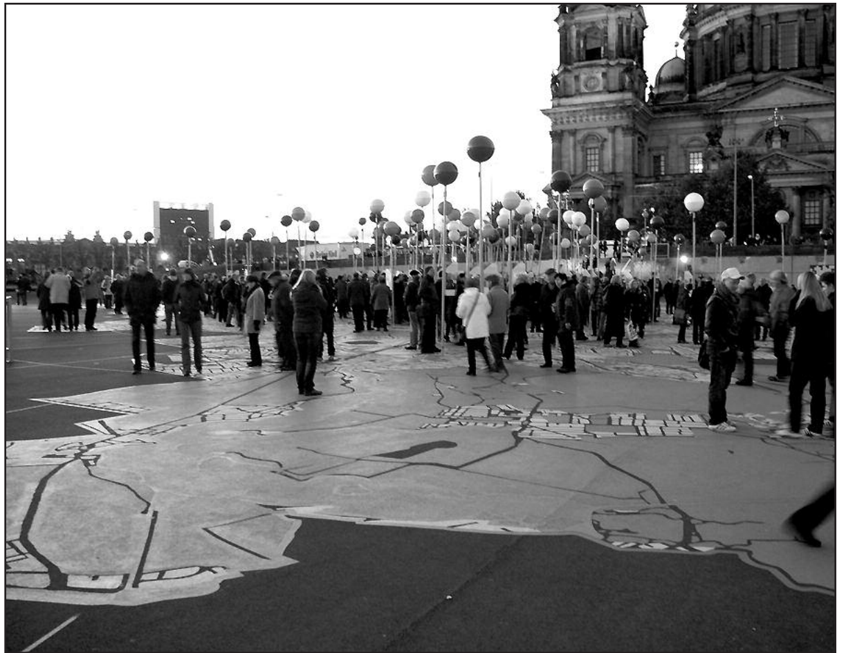
Toks Berlyno žemėlapis sulaukė didelio susidomėjimo.

Didžiausiame Vokietijos ir antrajame pagal dydį Europos mieste dabar gyvena apie 3,5 mln. gyventojų, miesto meras – jau trečiai kadencijai pernai išrinktas Klaus Wowereit. Miesto pavadinimas neturi nieko bendro su jo herbe vaizduojamu lokiu