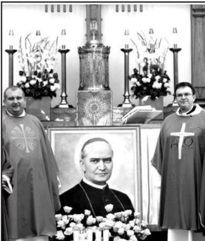
Los Angeles lietuviai paminėjo Pal. Jurgio Matulaičio metus – 5