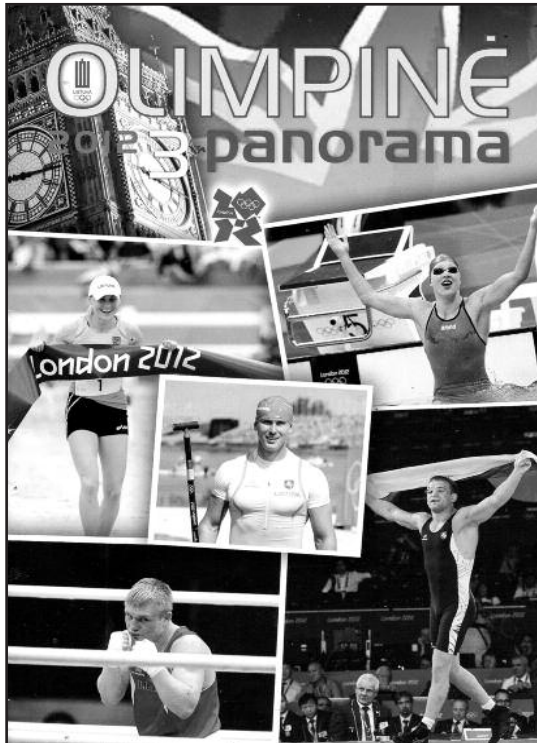
Naujo „OP“ numerio viršelis su Londone medalius laimėjusių Lietuvos sportininkų nuotraukomis. Naujo „OP“ numerio viršelis su Londone medalius laimėjusių Lietuvos sportininkų nuotraukomis.

personalo finansavimą, atkreipti didesnę dėmesį į tas sporto žaidimų komandas (pavyzdžiui, moterų plūdimo tinklinį), kurios pritraukia daug žiūrovų. Būtina visomis išgalėmis skatinti Lietuvos sporto šakų federacijų atstovų dalyvavimą tarptautinių federacijų veikloje, siūsti