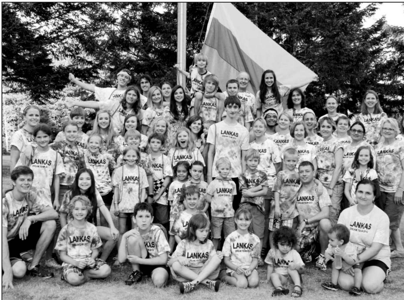
Seattle lietuvių vasaros stovykloje „Lankas“ stovyklavo tikra „Svajonių komanda“!