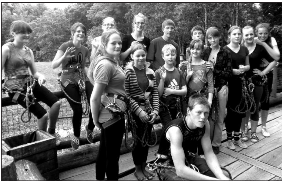
Papilės ateitininkai „Lokės pėdoje“ pasiruošę išbandymams.

Susėdę kuopos kambarėlyje prie nuotraukų albumais, stovyklų plakatais, dienoraščių, žurnalais ir laikraščiais apkrauto stalo, ne tik gėrimės, bet ir stebimės savo gausių ir margaspalvių veiklų puokšte. Maloniomis spalvomis puikuoja tradiciškai ateitininkų organizuota Motinos dienos šventė visoms Papilės parapijos motinoms, kai savo rankomis padarytais pavasariškais saldziaiduriais žiedais pasidabino daugiau kaip šimtas papilėniškių mamų, močiūčių. Liūdnesnis augalėlis primena darbinę kapų tvarkymo akciją „Vienišas Motinos kapas“. Tėvo dieną vaikų padaryti žiedai papuošė tądien Šv. Juozapo bažnyčioje susirinkusius parapijos tėvus, senelius. O štai ir miško kvapo gėlė – po keleto dienų miškų tankmėje esančią Agailių bažnytelę savo organizuotos tautos kalbos metu taip pat papuošėme