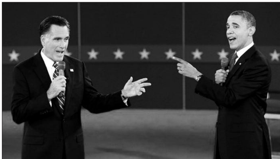
B. Obama (d.) ir M. Romney per debatus apie užsienio politiką.