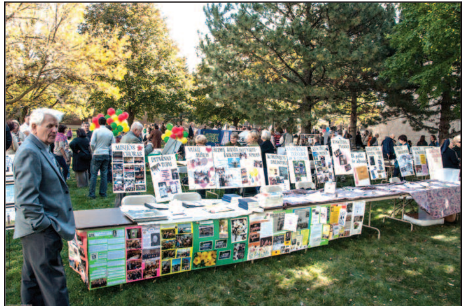
Palaimintojo Jurgio Matulaičio misijos rugsėjo 30 d. vykusioje Bendruomenės dienoje akis buvo kur paganyti: Tarnysčių mugėje dalyvavo daugybė lietuviškų organizacijų.

Draugo fondo taryba nuoširdžiai dėkoja už dosnią auką ir meldžia Aukščiausiojo palaimos.