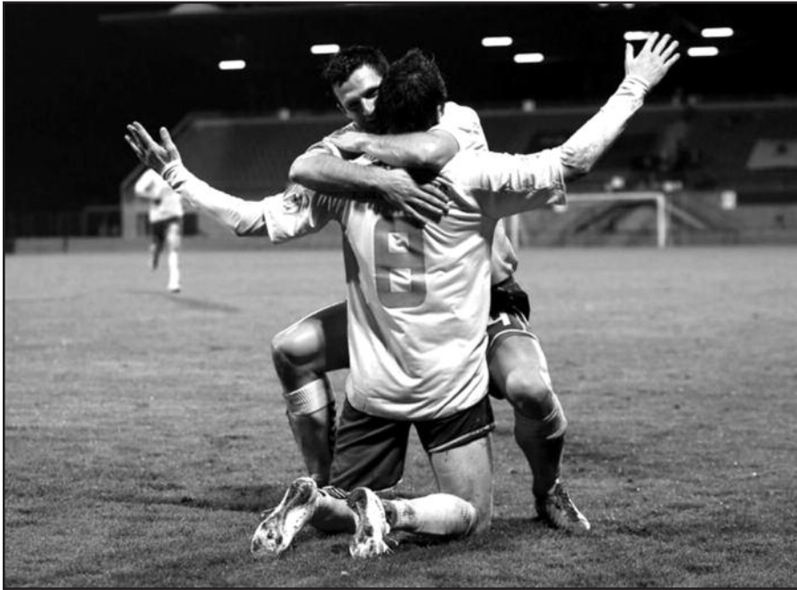
Lietuvos futbolininkai džiaugiasi po pergalės.