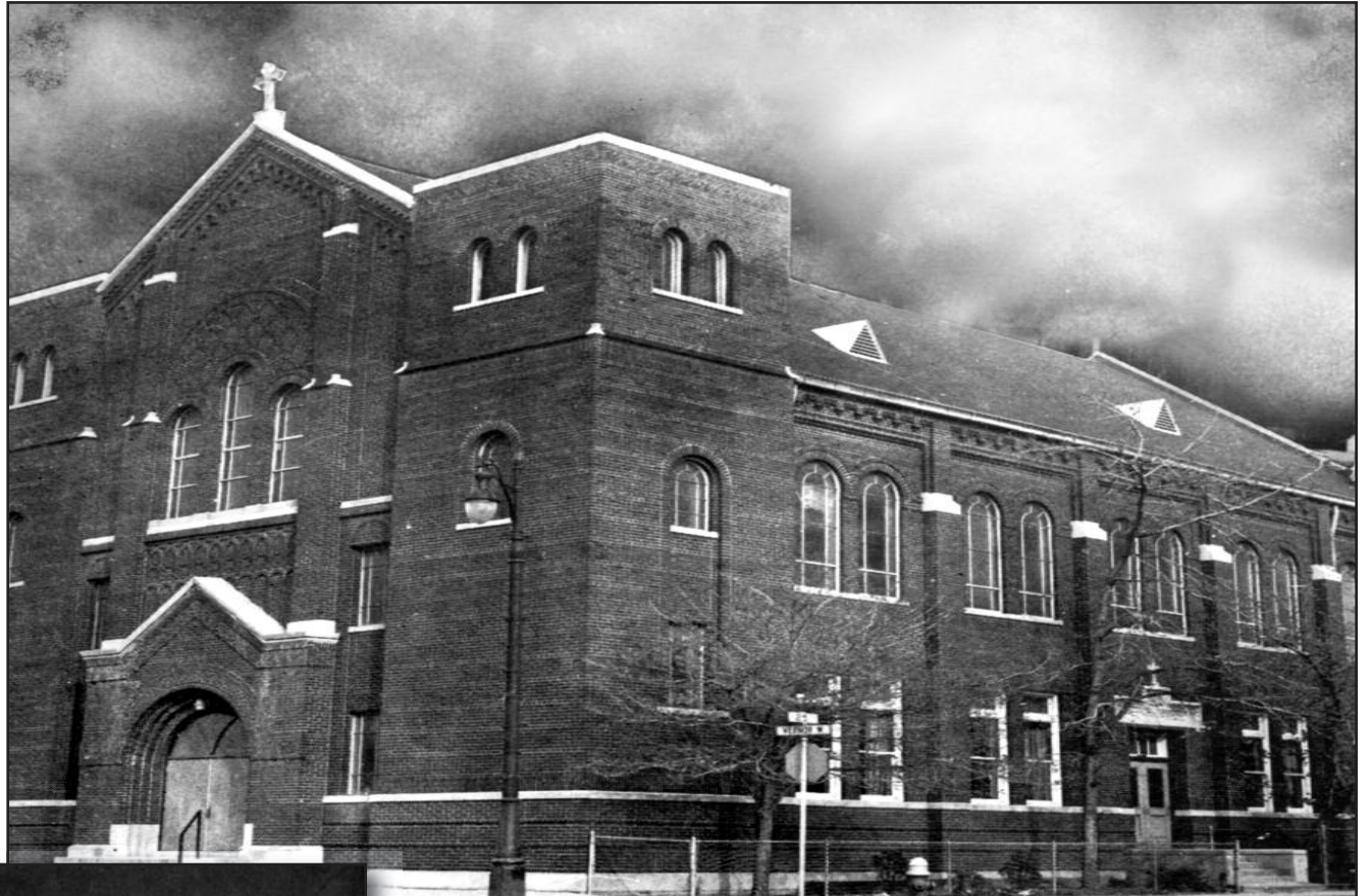
Šv. Antano parapija Detroit, Michigan.