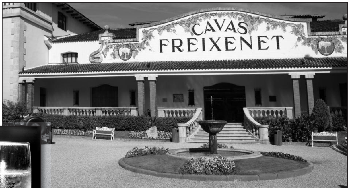
„Freixenet“ aplinka džiugina akį.

„Žmonių skonis įvairiose šalyse labai skiriasi, ir tie skirtumai įdomūs. Tose Vakarų Europos šalyse, kur labai senos ir gilios vynininkystės tradicijos, kur daug metų populiarius šampanas, žmonės mėgsta sausesnį, rūgštesnio skonio vyną, tad, pavyzdžiui, prancūzai ar vokiečiai labiausiai perka mūsų 'brut' ar sausą 'Freixenet'. Žinau, kad