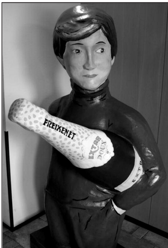
Šis berniukas tapo simboliu.

Šimtmečius Sant Sadurni d'Anoia miestelyje brandinamas ir gaminamas vynas jau seniai užkariavo putojančio vyno mėgėjų dėmesį. Iki šiol įmonėje dirba 15 jos savininkų palikuonių, tęsiančių savo protėvių tradicijas. Auga naujos kartos, o putojančio vyno taurė su joje šokinėjančiais burbuliukais tebelieka sėkmės simboliu, be kurio neišivaizduojamas sėkmingo sandėrio pasirašymas, asmeninė sukaktis ar naujametis vakaras.