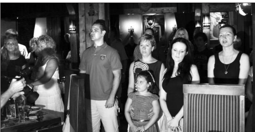
Himno giedojimo akimirka „Kunigaikščių užieigoje“.