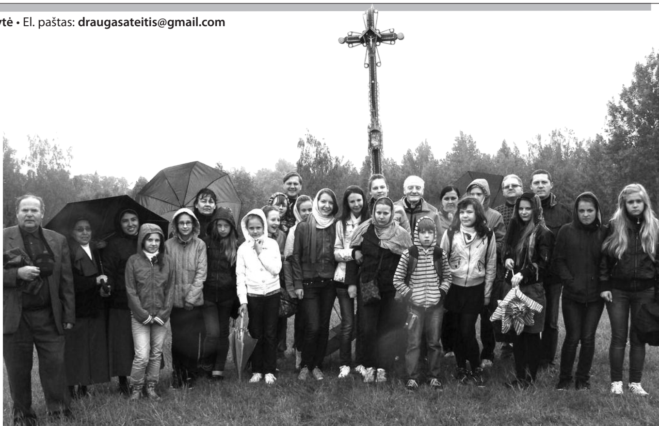
Ekskursijos dalyviai prie kryžiaus Europos geografiniame centre.

Alytaus šv. Benedikto gimnazijos moksleivė