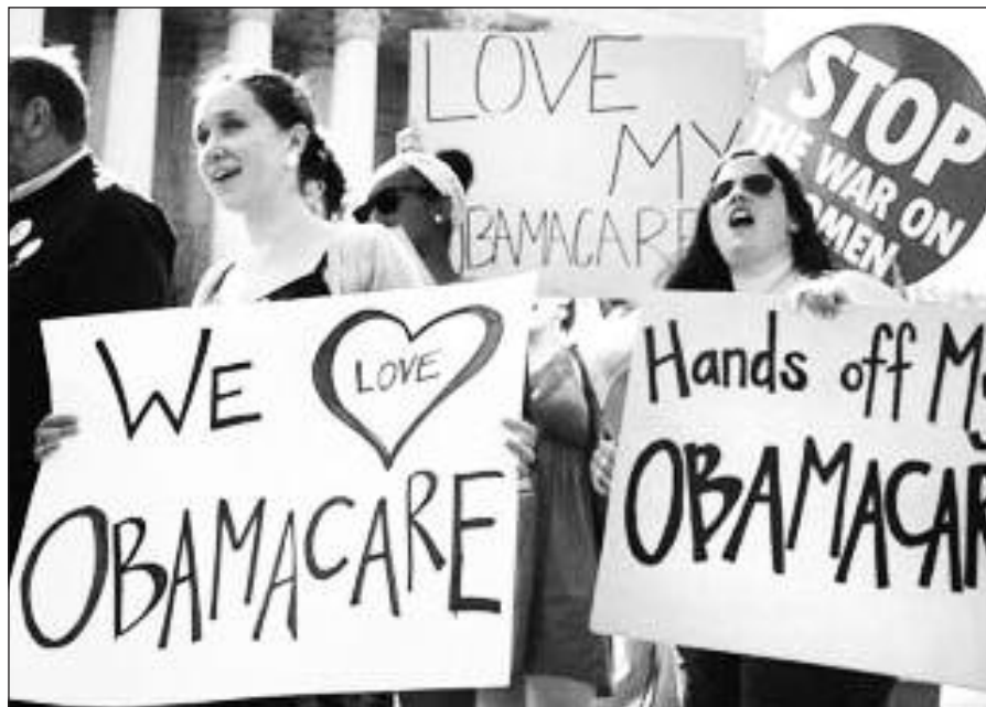
Sveikatos apsaugos sistemos pavertimas universalia tiesiogiai turėtų paliesti net 35 milijonus JAV gyventojų.

visuotinį privalomą sveikatos draudimą, išgalios ne visas iš karto, bet laipsniškai iki 2020 metų.