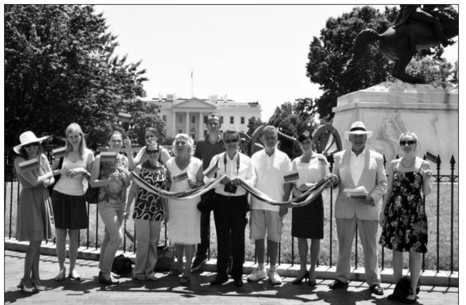
Washington, DC „Tautiška giesmė“ giedojo apylinkių lietuviai ir LR ambasados JAV atstovai.