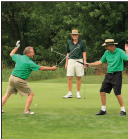
Sėkmingas golfo turnyras PLC parenti – 5 psl.