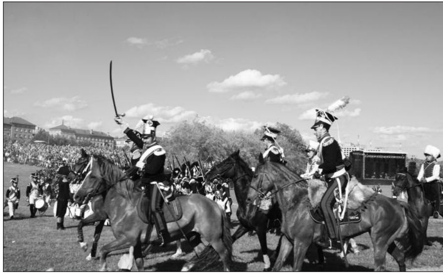
Atkuriant mūšį dalyvavo per 1,000 istorijos mėgėjų.

Istorikai aiškina, kad 1812 metais Lietuvoje negali būti vertinami tik juoda ar balta spalvomis. Tai buvo