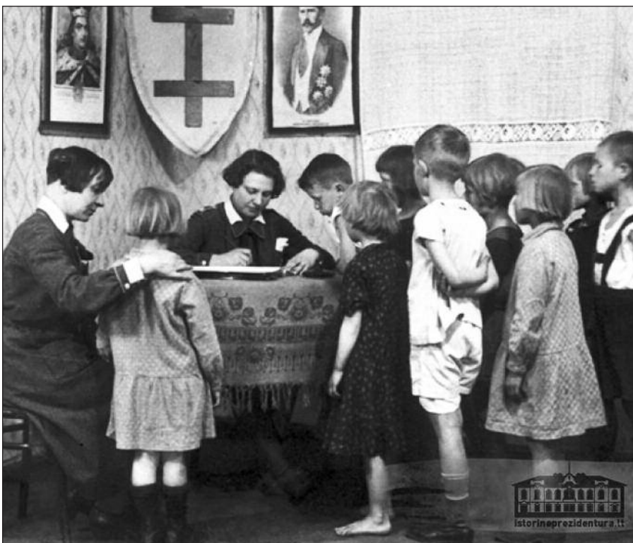
Paroda siekiama apžvelgti moterų veiklą Lietuvos viešojoje aplinkoje Pirmosios Lietuvos Respublikos laikotarpiu.