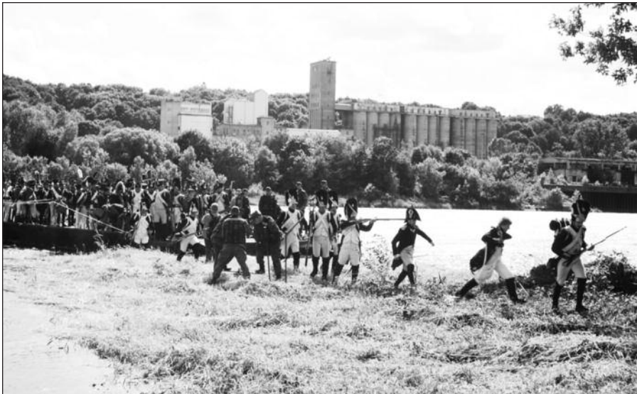
Persikėlimo per Nemuną akimirkos.

B irželio 22–24 d. Kaune surengtas išpūdingas gyvosios istorijos festivalis „Europa. Napoleonas I Kaune. 1812“. Būtent šiomis dienomis sukako lygiai 200 metų nuo tos dienos, kai Prancūzijos imperatorius Napoleonas Bonapartas nusprendė surengti žygį ir parklupdyti Rusijos imperiją ant kelių. Jam pavyko sutelkti didžiulę, iš daugybės tautų atstovų sudarytą kariuomenę, kuri veržtis į Rusiją pradėjo iš tuometės Varšuvos kunigaikštystės, kurią jis pats ir sukūrė 1807 m. Tad žygis prasidėjo armijos persikėlimu per Nemuną ties Kaunu.