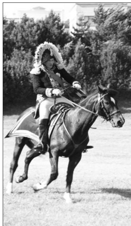
Napoleono vaidmenį atliko profesorius iš Maskvos.

Prancūzijos kariuomenės pagrindiniams korpusams nužygiavus tolyn į Rusijos imperiją, Kauno gyventojai galėjo grįžti į miestą. Mieste tada buvo apie 600 pastatų, 7 vienuo-