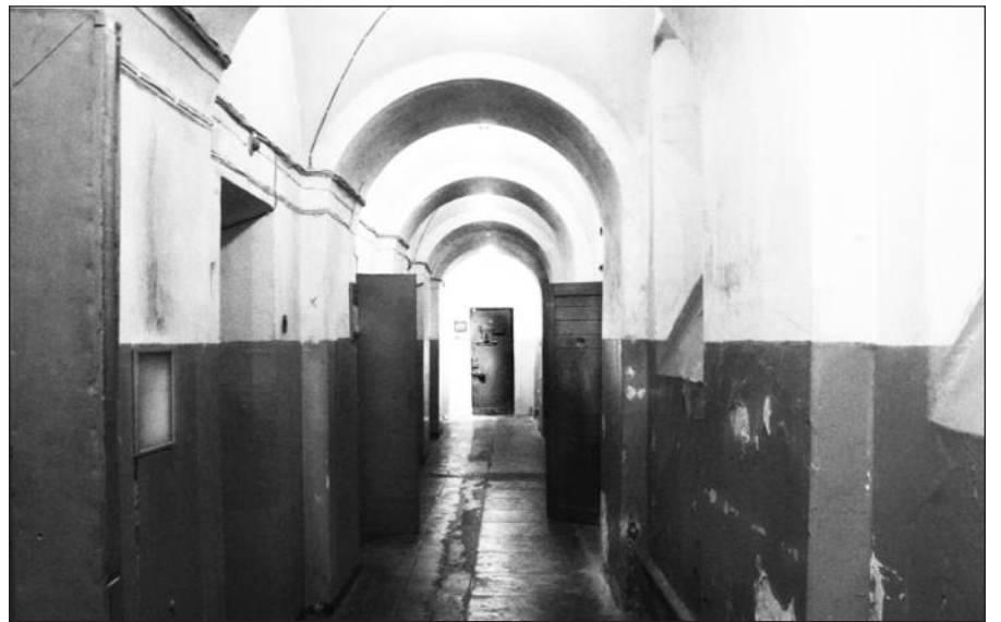
Buvusio KGB kalėjimo Vilniuje sienos slepia daug paslapčių.