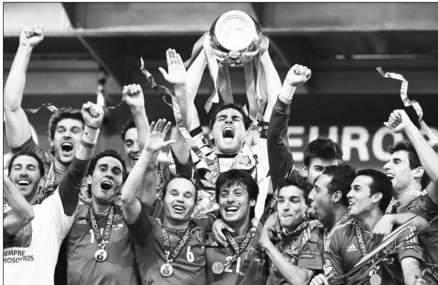
Ispanai Europos pirmenybėse nugalėjo trečią kartą.

1941 m. birželio mėnesį NKVD karininkai Cegelnės miške prie Červenės miesto Baltarusijoje sušaudė apie 2,000 baltarusių, lenkų, lietuvių ir kitų tautybių asmenų. Nužudyta apie 100 lietuvių kariškių, valstybės tarnautojų, mokytojų, tarp jų – ir Nepriklausomybės Akto signataras bei diplomatas Kazimieras Bizauskas.