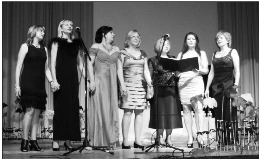
Mokytojų daina direktorei (v.).