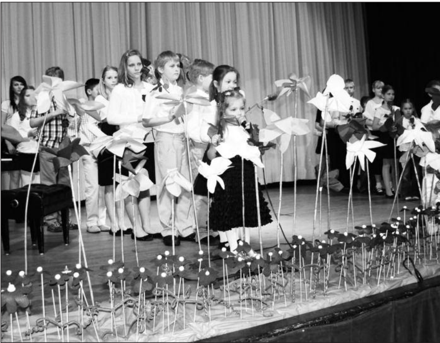
Mokinukų „Ačiū“ mokytojams.