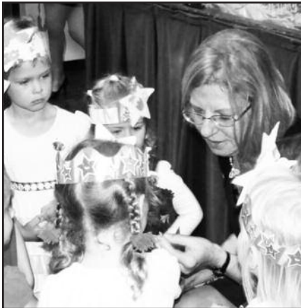
Čikagos lituanistinei mokyklai – dvidešimt – 6 psl.