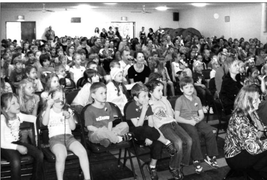
Šiuo metu mokykloje mokosi arti 400 mokinių.

Čikagos lituanistinė mokykla švenčia savo 20-ąjį gimtadienį. Šeštadienį, kovo 17 d., Jaunimo centre įsikūrusioje mokykloje (prieš 20 metų mokykla gimė sujungus tris mokyklas – Čikagos aukštesniąją, Donelaičio bei Dariaus ir Girėno lituanistines mokyklas) visą dieną jautėsi šventinė nuotaika. Rytinėje programoje eiles skaitė ir savo meistriškumą rodė mokykloje besimokantys mokiniai.