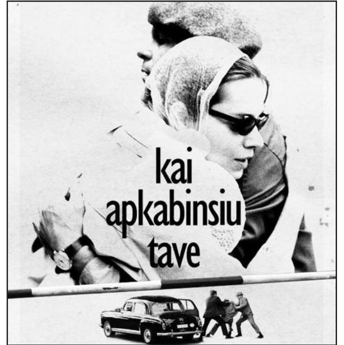
Filmo „Kai apkabinsiu tave“ reklaminė iškaba.

Europos Sąjungos filmų festivalis Čikagoje vyksta jau penkiolikta kartą, lietuviški filmai jame rodomi nuo 2005 m. Festivalis „Gene Siskel Film Center“ – stambiausias europietiško kino renginys visoje Šiaurės Amerikoje, jo metu rodomi filmai iš visų 27 ES šalių, o lankytojų skaičius kasmet auga. Šiais, kaip ir praėjusiais metais, lietuviško filmo pristatymą sugužėjo pilna salė žiūrovų, o peržiūrai pasibaigus joje nuaidėjo plojimai. „Kai apkabinsiu tave“ ES filmų festivalyje dar kartą bus rodomas kovo 21 d., trečiadienį, „Gene Siskel Film Center“ (164 N. State St., Chicago, IL 60601). Daugiau informacijos – www.chicago.mfa.lt arba www.siskelfilmcenter.org