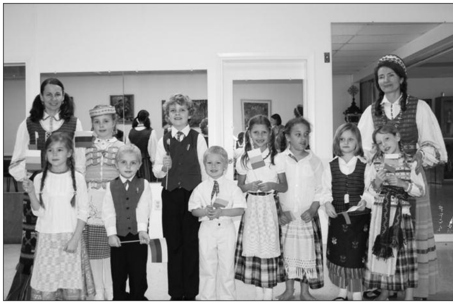
„Saulutės“ mokinukai atlieka programą.