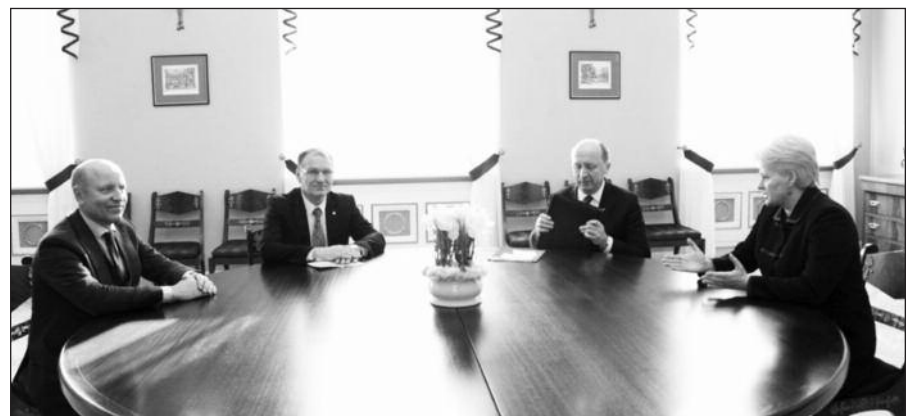
Prezidentė Dalia Grybauskaitė susitiko su konservatorių vadovu premjeru Andriumi Kubiliumi (antras iš d.), Liberalų centro sąjungos pirmininku Algium Čapluku ir vidaus reikalų ministru Raimundu Palaičiu.

„Ši koalicija gali dirbti kartu ir dirbs, bet nuolaidas turėjo padaryti abi pusės. Tokias nuolaidas ir padarė. Norėčiau paminėti, kad nuolaidos yra tokios: pirmiausia, Finansinių nusikaltimų tyrimų tarnybos (FNNT) pareigūnų gražinimas į darbą gali