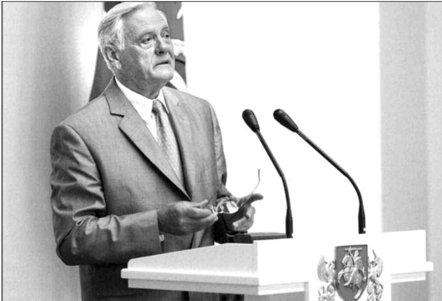
Prezidentas Valdas Adamkus.

Išgyvenome ilgus mėnesius, kai buvo dirbtinai priešinamos ne tik valdžios institucijos, bet ir skaldoma visuomenė. Tai jau užverstas nemalonus praeities puslapis. Bet valstybės prestižui, valdžios institucijų autoritetui suduotas skaudus smūgis. Mūsų