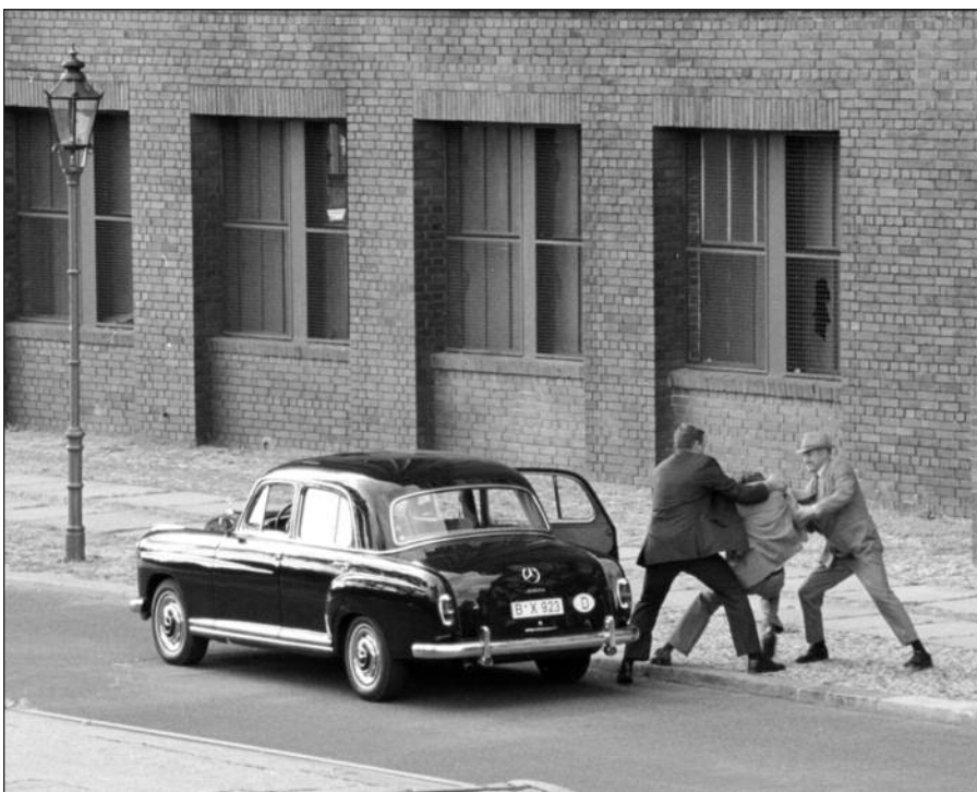
Scenos iš filmo „Kai apkabinsiu tave“.