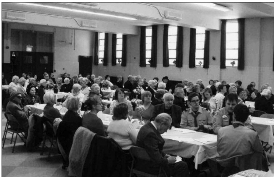
Vasario 16-osios minėjimo dalyviai.

Baigiant Nepriklausomybės atkūrimo minėjimą, prisiminti poeto B. Brazdžionio eilių žodžiai: „Nenu-mirus po piktojo gruodo ledais,/ Nesukniubus po sielvarto upės krantais,/ Puoškis, puoškis pavasario jauno žiedais,/ Lietuva, mano protėvių žemė“. Minėjimas baigtas daina „Lietuva brangi“, kurią dainavo visi dalyviai.