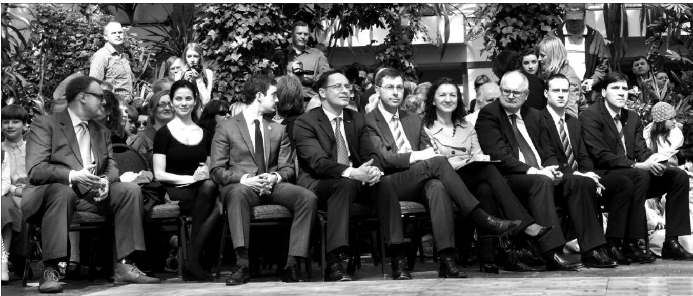
Net penkias valandas „Navy Pier“ vykusioje Kovo 11-osios šventėje skambėjo lietuviška muzika, šoko lietuvių tautinių šokių šokėjai.