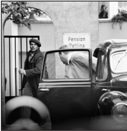
Lietuviško filmo premjera Čikagoje, „Gene Siskel Film Center“ – 10 psl.