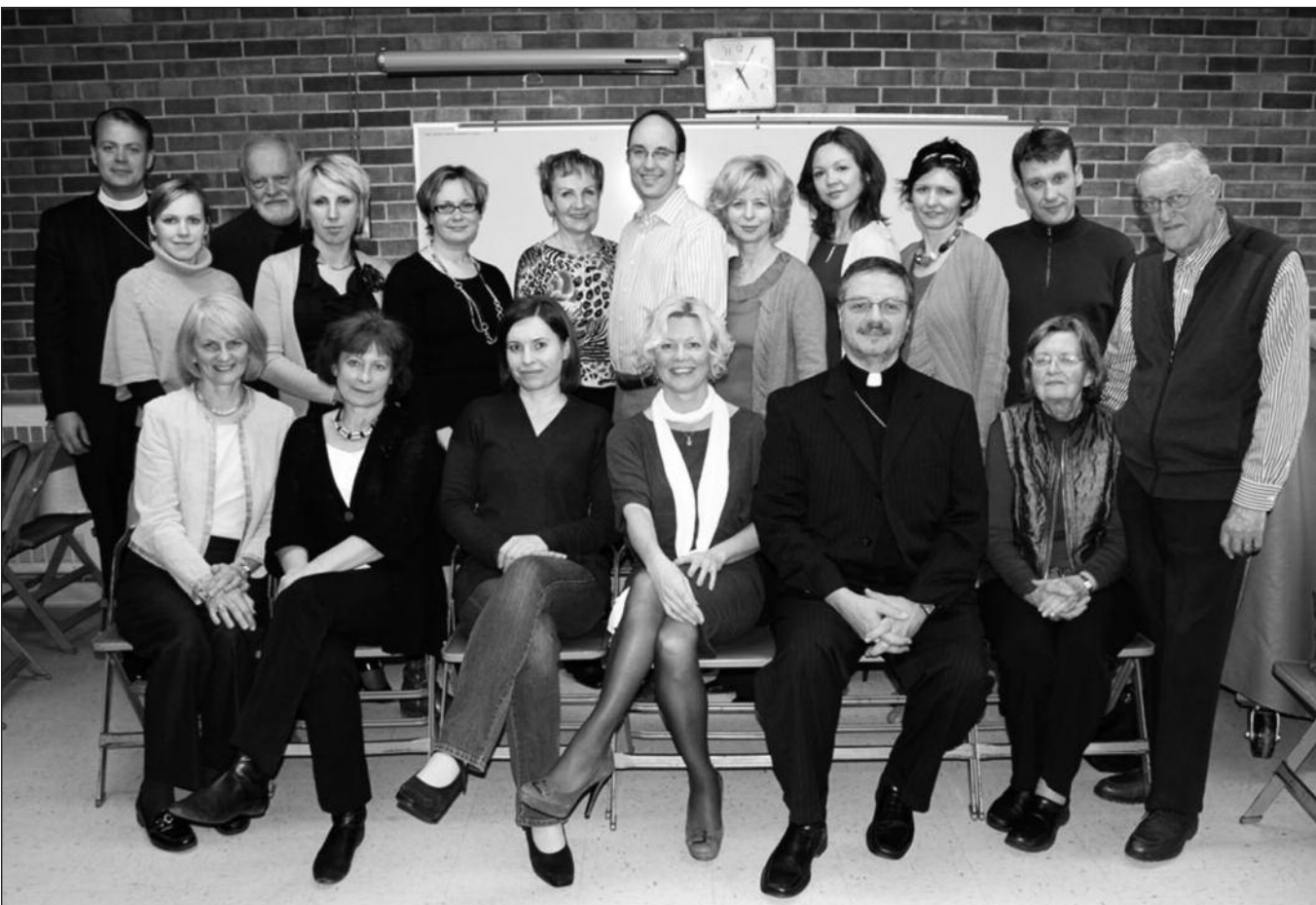
Šių metų Psichologinės ir dvasinės pagalbos draugijos visuotinio suvažiavimo dalyviai.