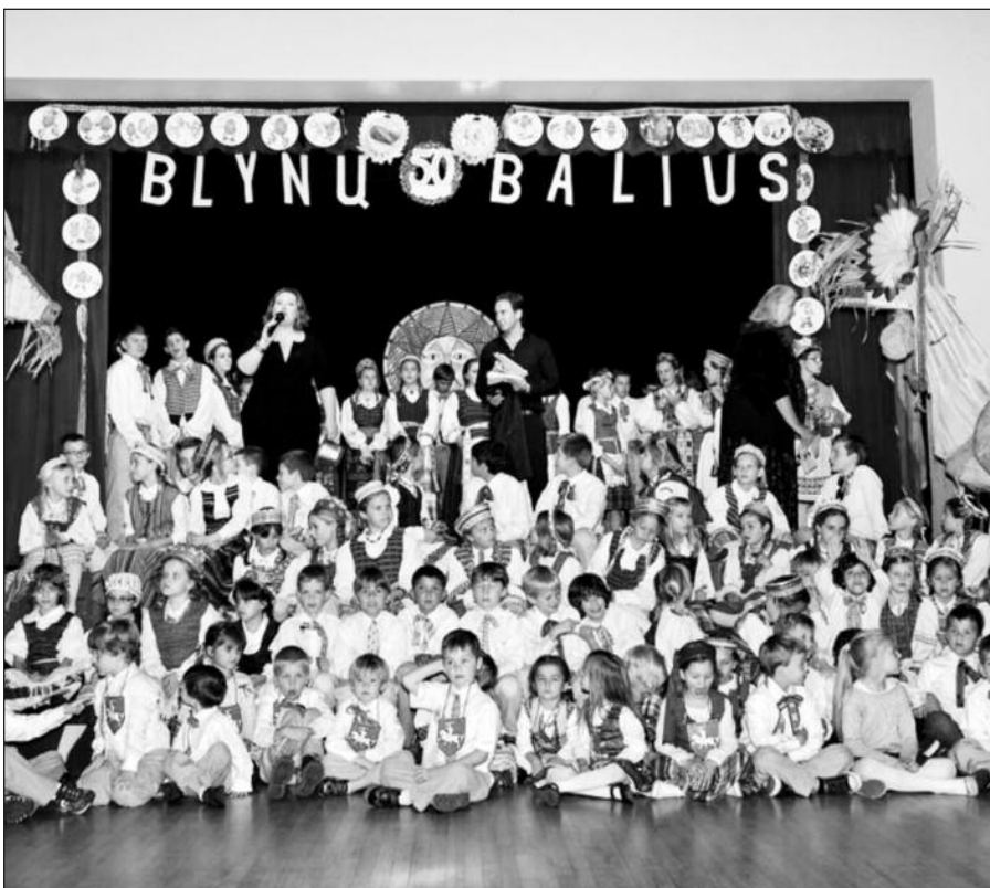
Į renginį netilpo žmonės – Šv. Kazimiero parapijos salėje susirinko per 400, neskaitant 100 „LB Spindulio“ šokėjų ir dainininkų, kurie atliko programą.