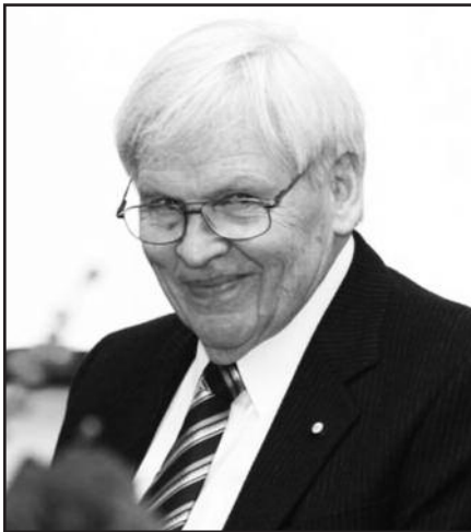
Lietuviška salelė Tasmanijos universitete – 8 psl.