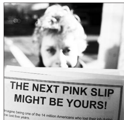
JAV protestą surengė dėl recesijos darbo netekę žmonės.

Europos Sąjungos (ES) narės turėtų „susilaikyti“ nuo dvišalių sandorių dėl savo piliečių laikomų Šveicarijos banko sąskaitų apmokestinimo, laiške ES pirmininkaujantį Danijai rašė už mokesčius ir muitų sąjungą, audita ir kovą su sukčiavimu atsakingas Europos Komisijos narys Algirdas Šemeta. Šis laiškas pasirodė netrukus po to, kai buvo pasirašytos Vokietijos ir D. Britanijos sutartys su Šveicarija mokesčių ir finansų rinkų srityje. Ilgai atidedamas ES santaupų įstatymo peržiūrėjimas išplėstų informacijos atskleidimo reikalavimus, keliamus bankų sąskaitoms, kurias laiko ES piliečiai užsienyje. Kalbėdamas Briuselyje A. Šemeta sakė, kad ES prarado daugiau nei 1 trilijoną eurų per metus dėl vengimo mokėti mokesčius ir sukčiavimų.