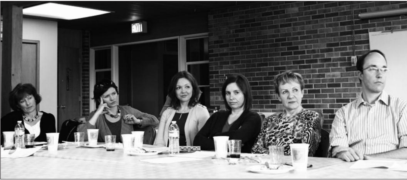
Šiais metais Draugijos nariai planuoja ypatingą dėmesį skirti savo narių, ypač budinčių savanorių, apmokymams.