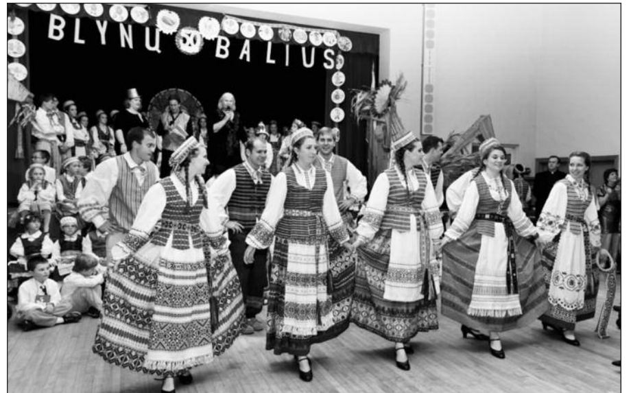
„LB Spindulio“ studentų grupės šokėjai.