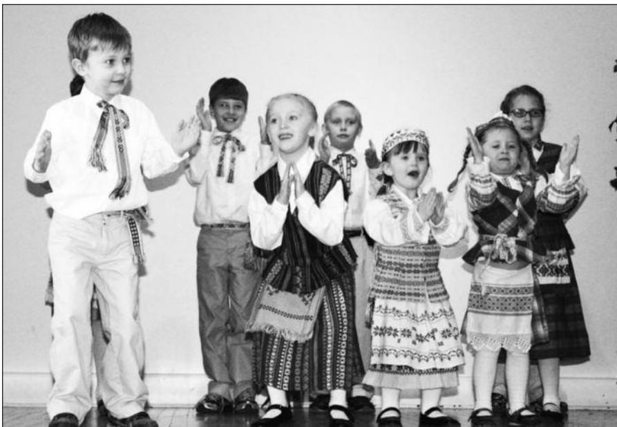
„Aušros“ jauniausieji šokėjai.