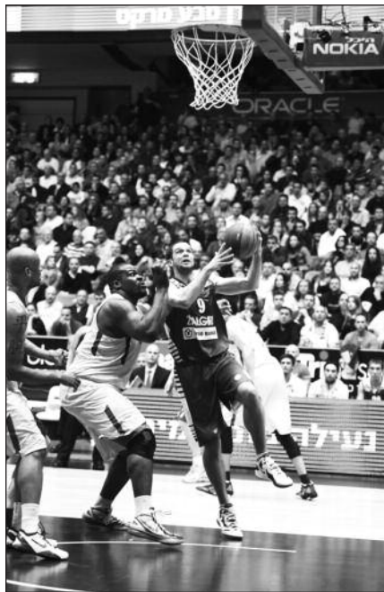
Žalgiriečiai Tel Avive.