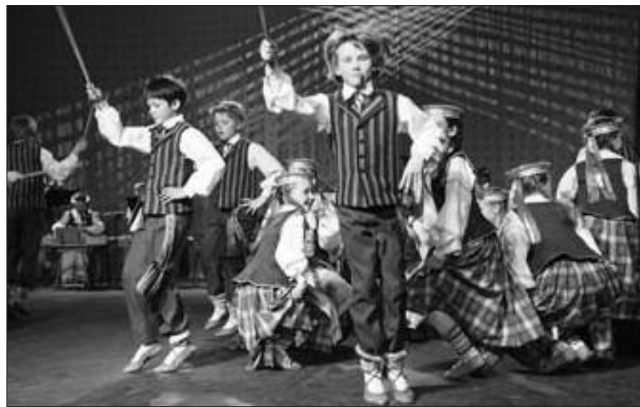
Lietuvos vaikų ir jaunimo centro ansamblio „Ugnelė“ šokėjai dalyvaus Čikagoje, Navy Pier centre, kovo 11 d. vyksiančioje Lietuvos nepriklausomybės atkūrimo šventės programoje.

– 10 S. Lake St., Mundelein, IL vyks JAV LB Waukegan-Lake County apylinkės rengiamas Nepriklausomybės dienos minėjimą. Pradžia 1 val. p. p. Tel. pasiteirauti: 847-855-5294.