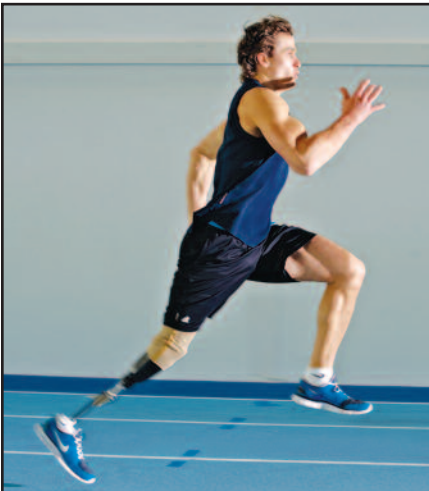
Bėgte link aukso – 7 psl.