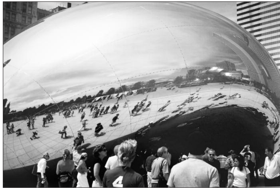
Anish Kapoor „Cloud Gate“ žmonių vadinama „pupelė“ tapo Čikagos miesto ženklu.

Čikaga palaiko partnerystės ryšius su 26 pasaulio miestais. Tarp susigiminiavusių miestų pavadinimų – ir Vilnius miesto vardas.