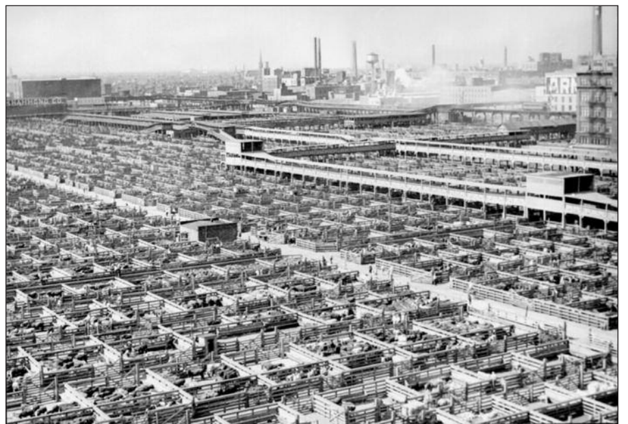
Taip atrodė „Union Stock Yards“ 1947 metais.

Norinčius daugiau sužinoti apie šią šventę ir kitus renginius, vyksiančius Čikagoje 2012-aisiais, kviečiu apsilankyti internetinėje svetainėje www.explorechicago.org