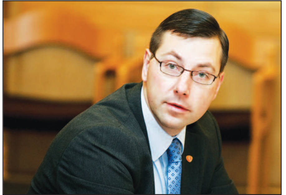
Lietuvos švietimo ir mokslo ministras Gintaras Steponavičius.