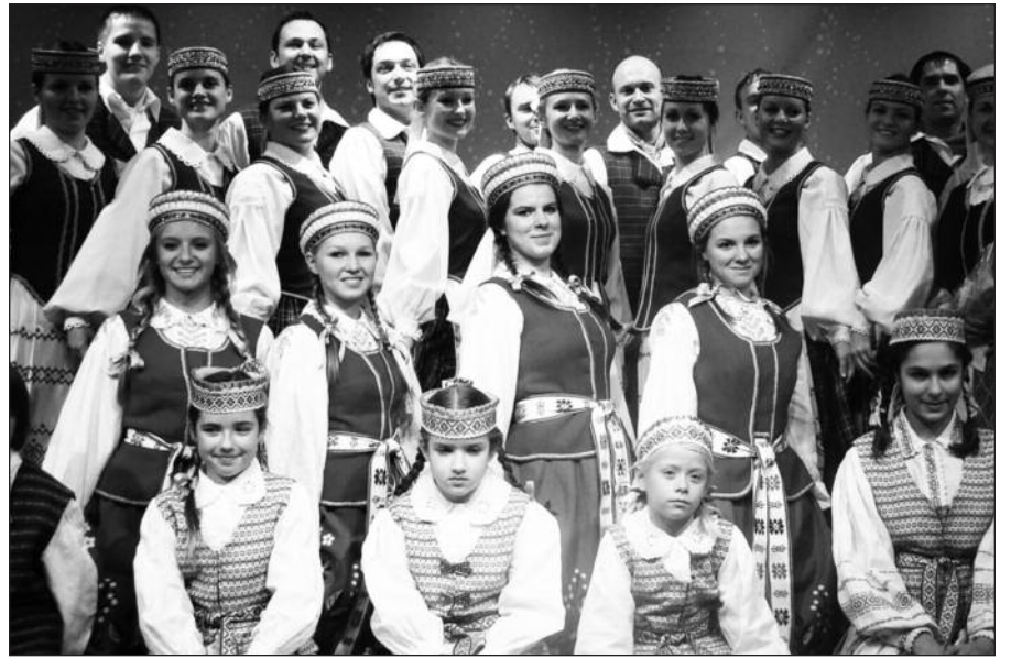
Grupė „Suktinio“ ir „Lietuvos vyčių“ šokėjų.