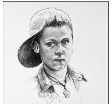
Vyktintas Genys. „Neal“. Popierius, pieštukas