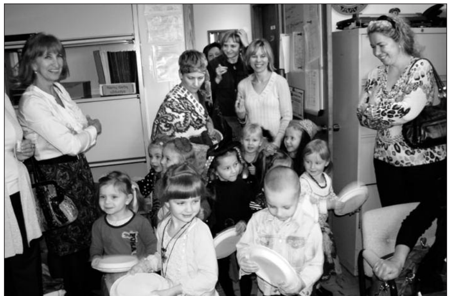
Patys mažiausieji atėjo į mokytojų kambarį padėti mokytojoms „išvaryti žiemą iš kiemo“.

O žiema, matyt, pabudo nuo Užgavėnes švenčiančiųjų šūkaliojimų ir ėmė drėbti sniegą. Reikia tikėtis, kad kitais metais ji elgsis kaip pridera ir sniegą drėbs laiku.