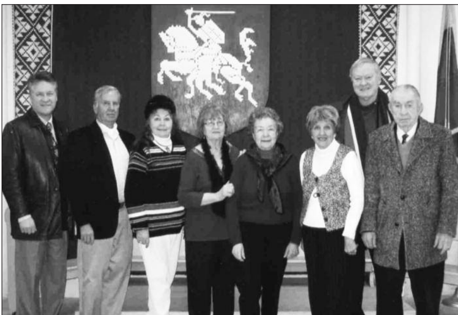
Minėjimą surengė JAV LB Hartford apylinkės valdyba.