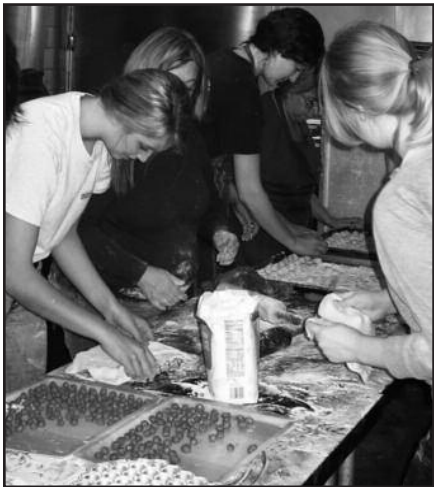
Čikagos skautai jau pasiruošę Kaziuko mugei – 6 psl.