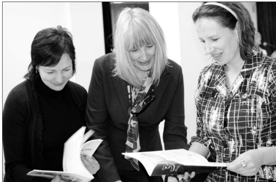
Mokytojos domisi savo kolegijų paruoštomis pratybomis.