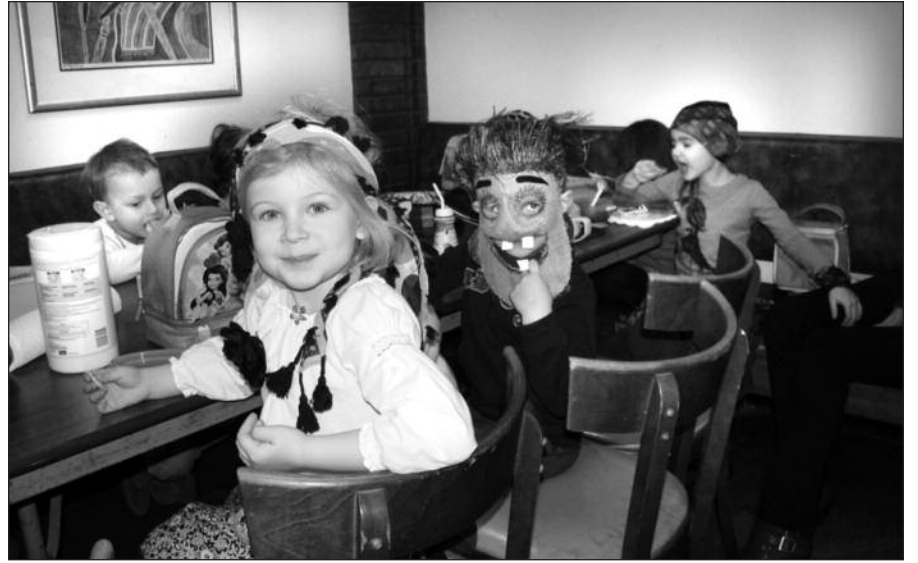
Mūsų taip pat niekas nepažįsta.