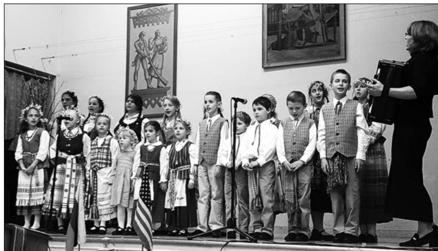
Šiauriniame New Jersey vykusio minėjimo akimirkos: šokių koletyvas „Viesulas“, vaikų choras „Varpelis“.