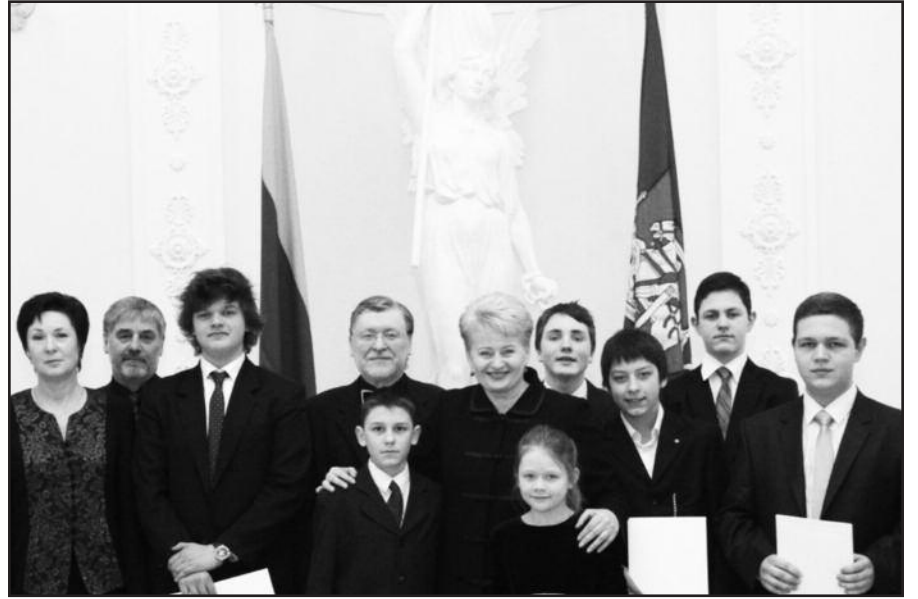
Jaunuosius Lietuvos muzikus, 2011 m. tarptautiniuose konkursuose laimėjusius aukščiausius apdovanojimus, ir jų pedagogus pasveikino prezidentė D. Grybauskaitė.