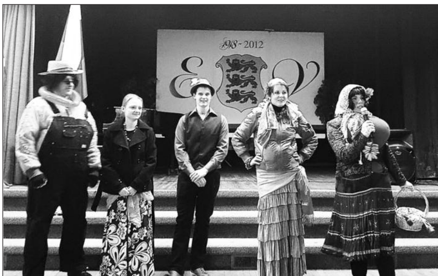
Centrinio ir Pietų New Jersey Uzgavėnių šventė.

niais. Generalinis konsulas, sveikindamas gausiai susirinkusius tautiečius, kvietė burtis naujiems darbams Tėvynės ir jos žmonių labui ir