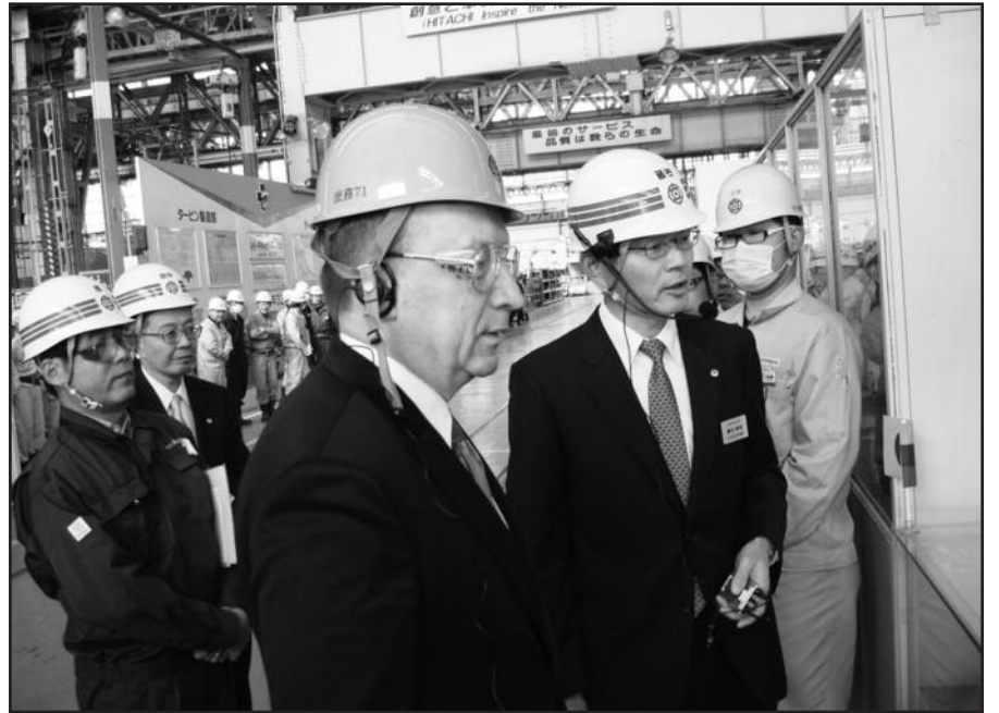
Apsilankęs „Hitachi Ltd.“ bendrovės gamyklose, premjeras A. Kubilius pažymėjo, jog „Hitachi“ technologijos – įspūdingos.

Premjeras lankėsi gamykloje „Hitachi Works“, kurioje Vyriausybės vadovui buvo parodyta branduolinės jėgainės garo turbina – ji yra tokia