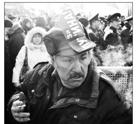
Demonstrantai reiškė paramą ministrui pirmininkui V. Putin.

Demonstrantai ragino žmones per kovo 4 d. vykiančius prezidento rinkimus balsuoti už V. Putin ir teigė, kad taip galima „apginti teisę į ramią ateitį“. Demonstracijų organizatoriai siekė parodyti, kad nepaisant sumažėjusio populiarumo, premjerą vis dar palaiko dauguma gyventojų. Jei V. Putin prezidento rinkimus laimės du kartus iš eilės, jis val-