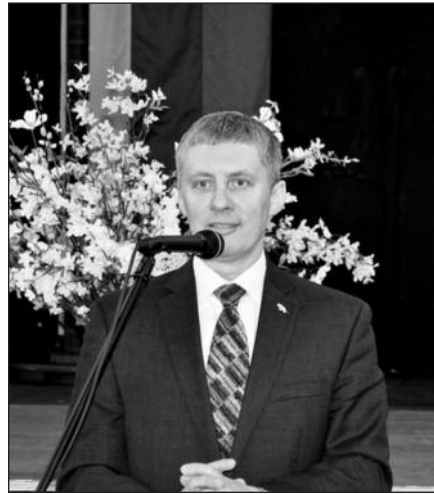
LR gen. konsulas Valdemaras Sarapinas.