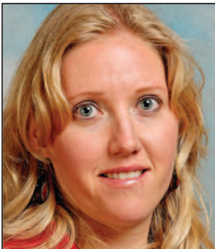
„Gintarinio obuoliuko“ laimėtoja – 5 psl.