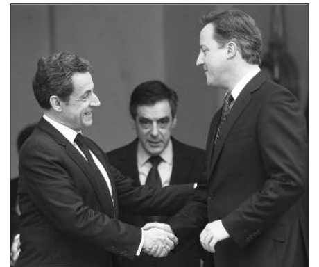
N. Sarkozy (k.) ir D. Cameron kalba apie gerus šalių santykius.

Didžiosios Britanijos ir Prancūzijos pasirašytose sutartyse numatyta kartu kurti nepilotuojamus lėktuvus, steigti jungtinį vadovavimo centrą, statyti Britanijoje naujos kartos atomines elektrines. Sandoriai branduolinėje energetikoje vertinami apie 75 mln. JAV dol. Atominių elektrinių statyba Britanijoje leis sukurti apie pusantro tūkstančio darbo vietų.