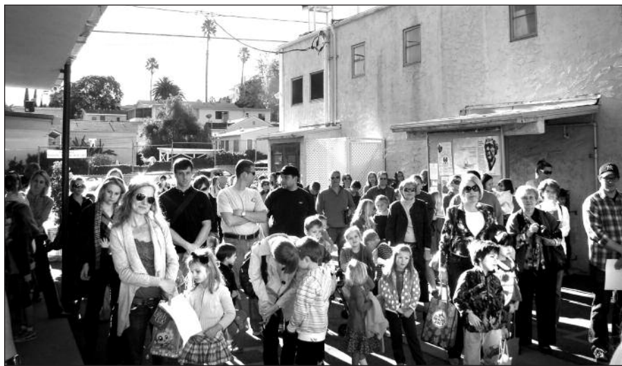
Šeštadienio diena Šv. Kazimiero lituanistinėje mokykloje Los Angeles prasideda bendra malda ir vėliavos pakėlimu.