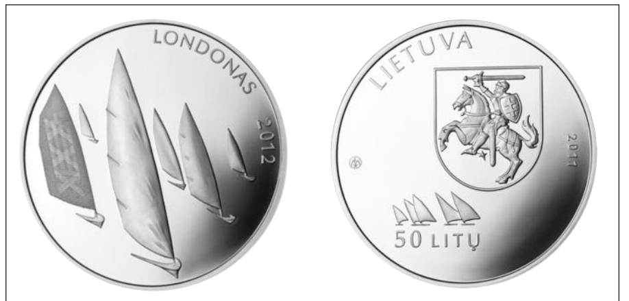
Taip atrodo Londono olimpiadai skirta Lietuvos banko išleista suvenyrinė moneta.

Naujoji kolekcinė moneta parduvinėjama Lietuvos banko kasose Vilniuje (Totorių g. 2/8), Kaune (Maironio g. 25) ir Klaipėdoje (Naujoji Uosto g. 16).