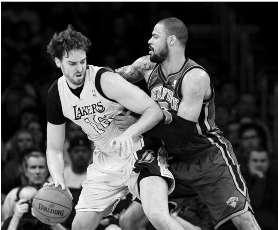
NBA rungtynėse „Los Angeles Lakers“ žaidėjas Pau Gasol (k.) veržiasi pro „New York Knicks“ krepšininką Tyson Chandler.