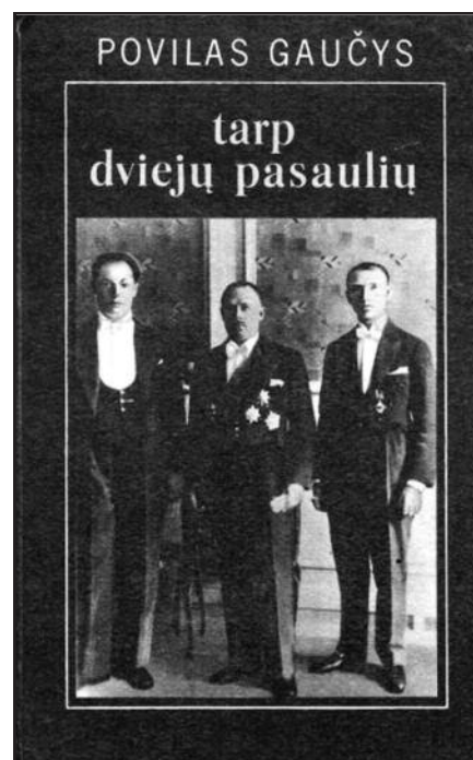
Povilo Gaučio atsiminimų knyga „Tarp dviejų pasaulių: iš mano atsiminimų, 1915–1938. Vilnius: „Mintis“, 1992.

Puslapyje lankytojas galės pamatyti diplomatinį raštų, laiškų kopi-