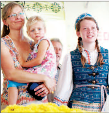
2011-ieji nuotraukose – 4, 5 psl.