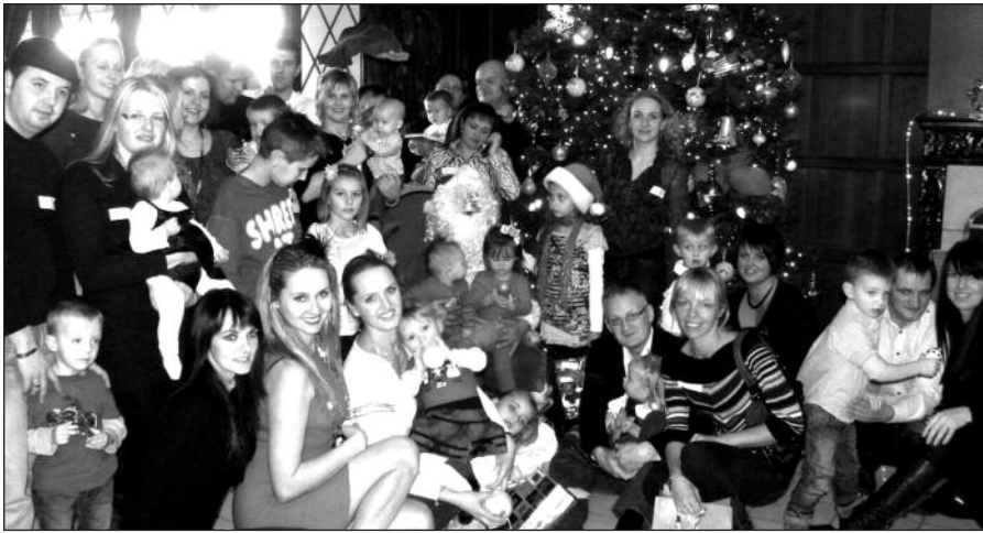
Visi kartu su Kalėdų seneliu.