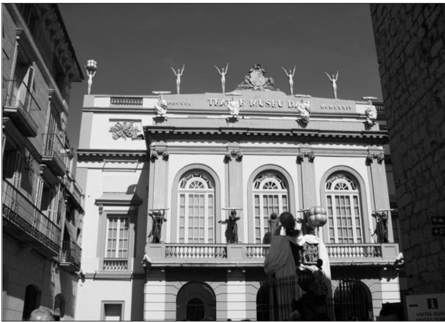
Salvador Dali muziejus Ispanijoje.