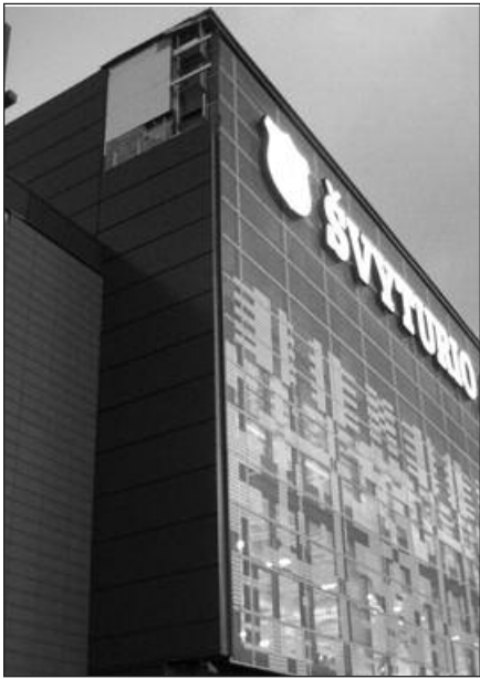
Vėtros apgadinio „Švyturio“ arena.

Vilnius (ELTA) – Dėl lapkričio 28 d. naktį kilusio stipraus vėjo be elektros Lietuvoje buvo likę apie 60,000 vartotojų. Dėl praūžusio viesulo skirstomųjų tinklų bendrovė „Lesto“ paskelbė nepaprastą padėtį. Tokia padėtis šiemet buvo paskelbta sausio ir vasario mėnesiais, kai elektros tiekimas sutriko dėl pūgų.