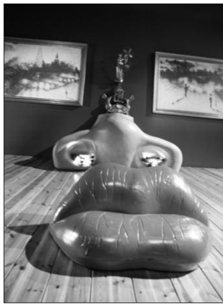
„Mae West lūpų formos sofa“.