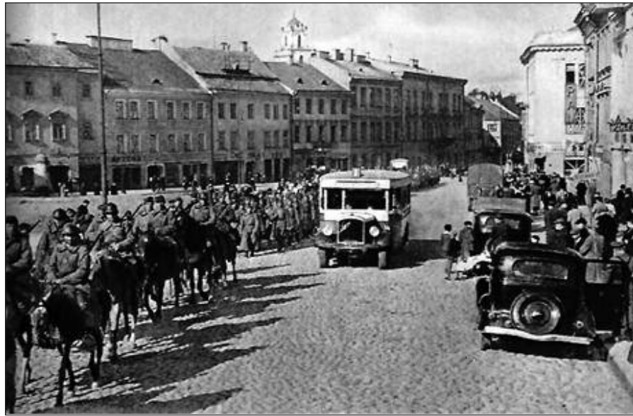
Trečioji sovietų okupacija, 1939 m. rugsėjis.

Tai buvo svaiginantys metai. Atrodė, kad ne keletas, bet keliolika metų ar net ištisos epochos buvo sugrūstos į tuos pirmosios sovietų okupacijos metus. Naujų, negirdėtų žodžių ir idėjų skleidimas tolino ir skaldė, skyrė ne tik draugą nuo draugo ar giminaičio, bet ir nustatinėjo brolių prieš brolių, sūnus prieš tėvus. Tai buvo dviejų skirtingų pasaulėžiūrų, pasaulių ir jų santvarkų susidūrimas. Komunistų sistema buvo pasiryžusi pakeisti visuomenės santvarką, įskaitant papročius, galvoseną ir tikėjimą. Ši skirtingų santvarkų kova pasireiškėdavo įvykiais, kurie savotiškai lietė, kankino ar džiugino kiekvieno žmogaus protą ir jausmus.