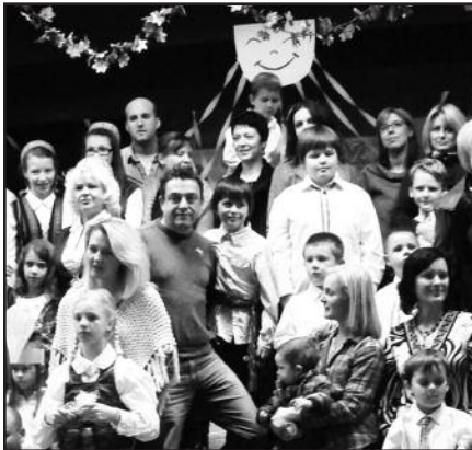
New Jersey lituanistinė mokykla „Lietuvėlė“ pasipuošė rudenėlio šventei – 5 psl.