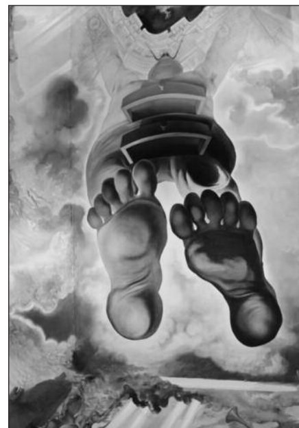
„Vėjų rūmų“ puošyba.

Lankytojus stebina ir daugybė kiekviename vidinio kiemo lange išdėstytų manekėnų, ir menininko miegamasis, apstatytas įdomiais baldais ir papuoštas meno kūriniiais. Išpūdingi yra vadinamieji „Vėjų rūmai“ – salė, kurios lubas puošia Dali tapyba, taip pat „Sėdevrų kambarys“, kuriame galima pamatyti ir garsių Europos šalių dailininkų El Greco, Marcel Duchamp bei kitų darbus.