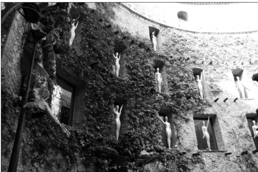
Manekėnai vidiniame kieme.