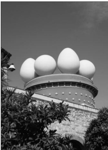
Pastatą puošia milžiniški kiaušiniai.