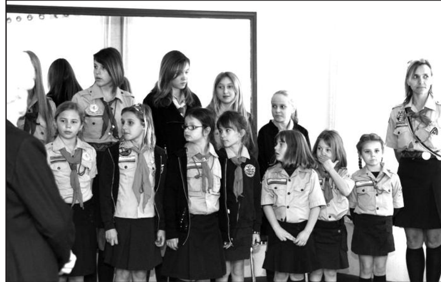
„Palangos“ tunto paukštytės ir prit. skautės sueigoje Los Angeles.