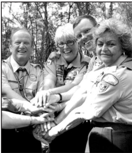
Šią vasarą Skautija iševivijoje pradėjo 66-uosius metus – 6 psl.