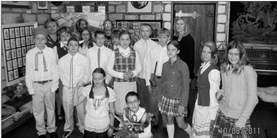
Čikagos lituanistinės mokyklos šeštokai Balzeko lietuvių kultūros muziejuje.