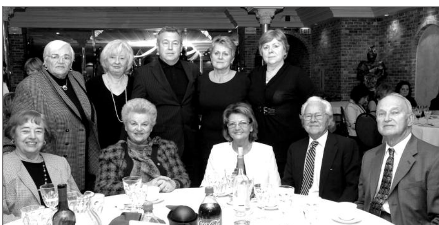
„Draugo“ popietės dalyviai.