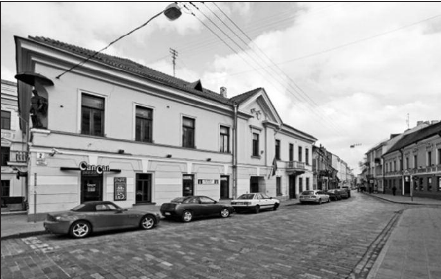
Umiastovskių rūmai Trakų gatvėje, Vilniuje, šiandien.