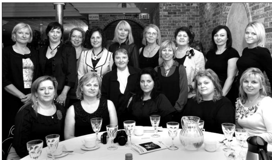
Šventėje dalyvavo gausus būrys Čikagos lituanistinės mokyklos mokytojų.