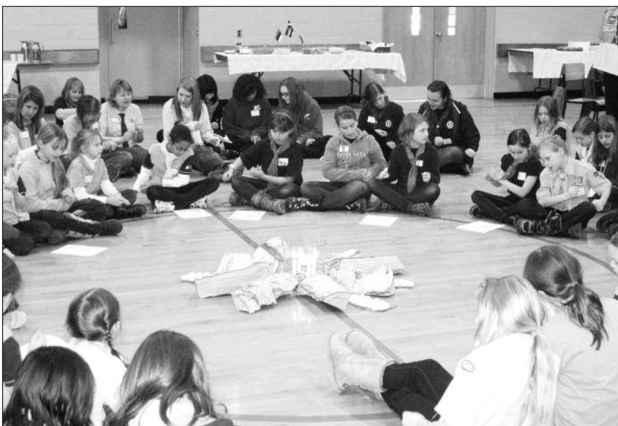
Susimąstymo dienos sueigoje Toronto mieste kartu dainuoja latvės, estės ir lietuviškaitės.

Gruodžio mėn. 15 d., trečiadienį, 1 val. p. p. – Kūčios Ateitininkų namuose, Lemont, IL. Dalyvaujame su uniformomis. Prašome atsinešti lėkštę su Kūčių valgiu. Galėsite užsirašyti lapkričio mėn. sueigoje.