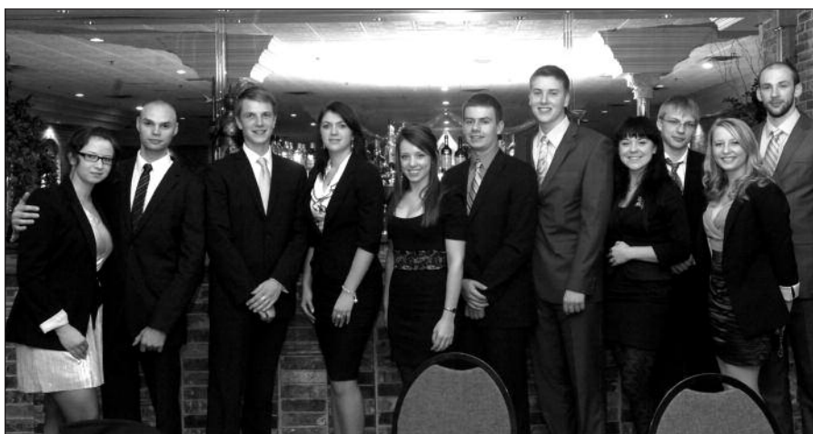
Šiaurės Amerikos lietuvių skautų sąjungos nariai.