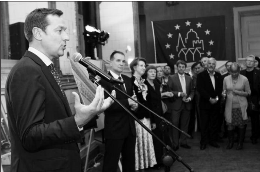
Parodą atidarė Vilniaus meras Artūras Zuokas.