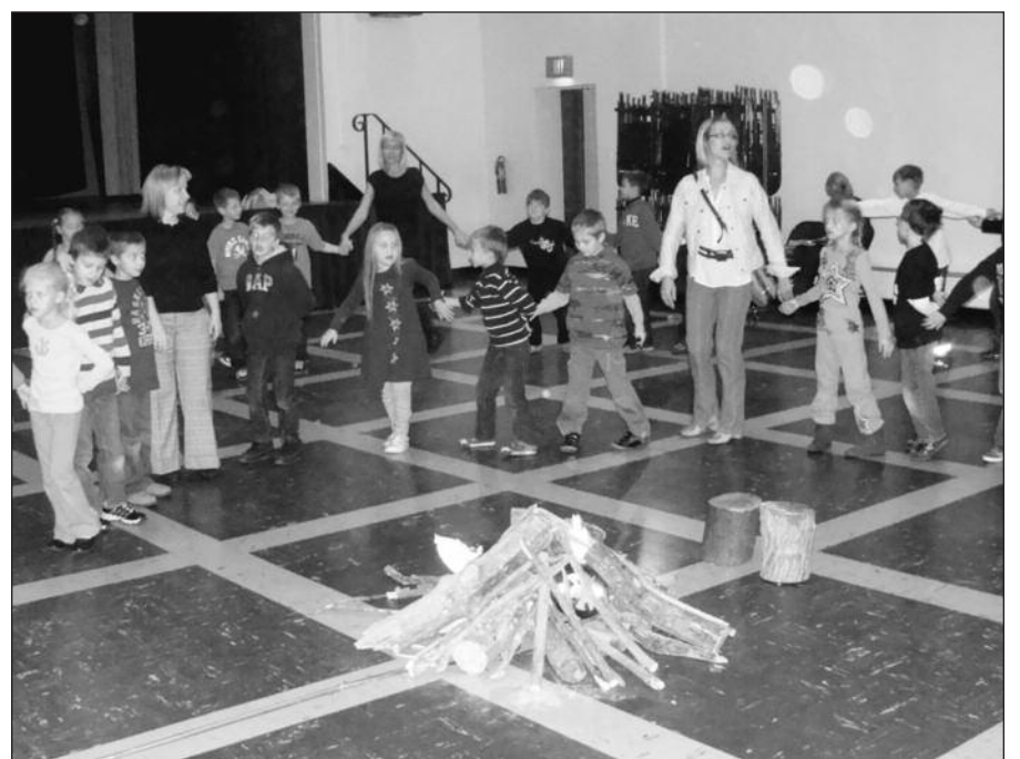
Aplink laužą šoka pirmokai.