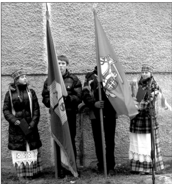
2010 m. vasario 26 d. buvo atidengta atminimo lenta ant namo, kuriame po tremties gyveno prezidentas Aleksandras Stulginskis.

O žmogus vis tiek džiaugiasi šia diena, nors kartais sienos iškyla širdyse. Ateitininkai griaua sienas, nori, kad širdys būtų atviros, kad saulės šypsulys ir artimo meilė jose apsigyventų.