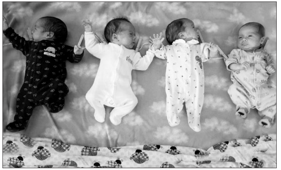
Mažyliai yra sveiki, gerai auga.