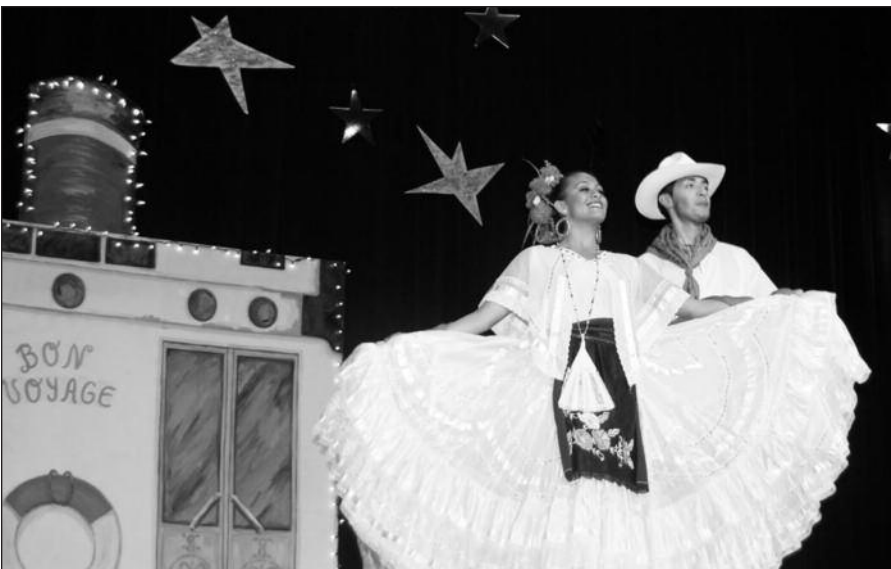
Kelionę pradėjo artimiausi Šiaurės Amerikos kaimynai – meksikiečiai.