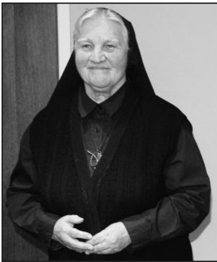
Žmogus pagal Dievo širdį – 14 psl.