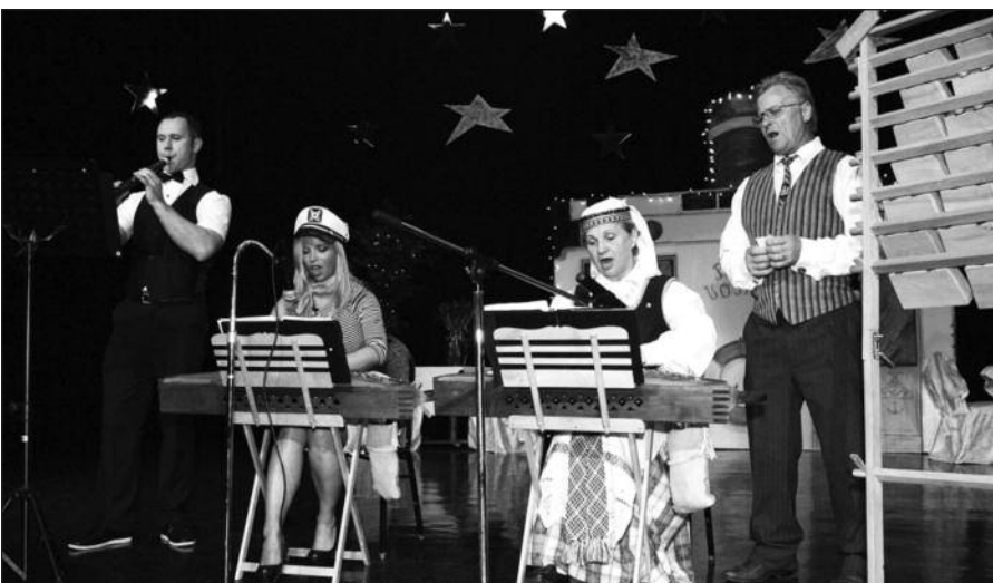
Nepamiršta užsukti ir į Lietuvą, kuriai atstovavo „Gabija”.