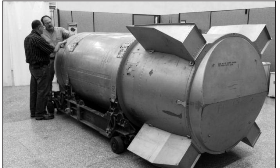
Branduolinė bomba, sverianti per 4,500 kilogramų ir dydžiu prilygstanti nedideliui automobiliui, buvo pajėgi nuo žemės paviršiaus nušluoti visą miestą.

„Dabar pasaulis tapo saugesnis”, – teigia JAV Nacionalinės branduo-