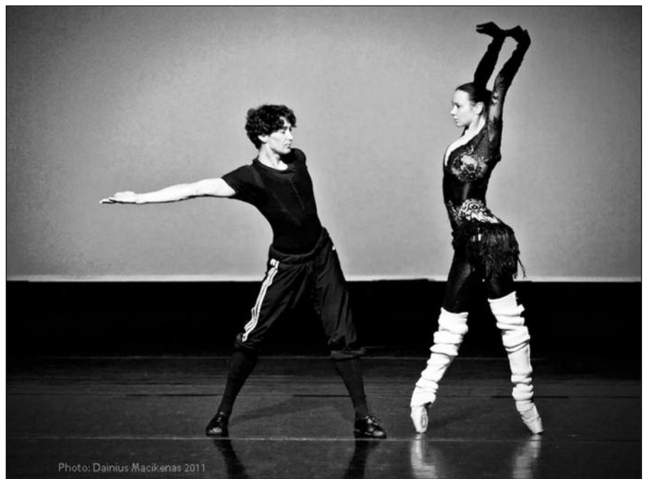
Dainiaus Mačikėno darbuose – kaip gimsta šokio grožis.