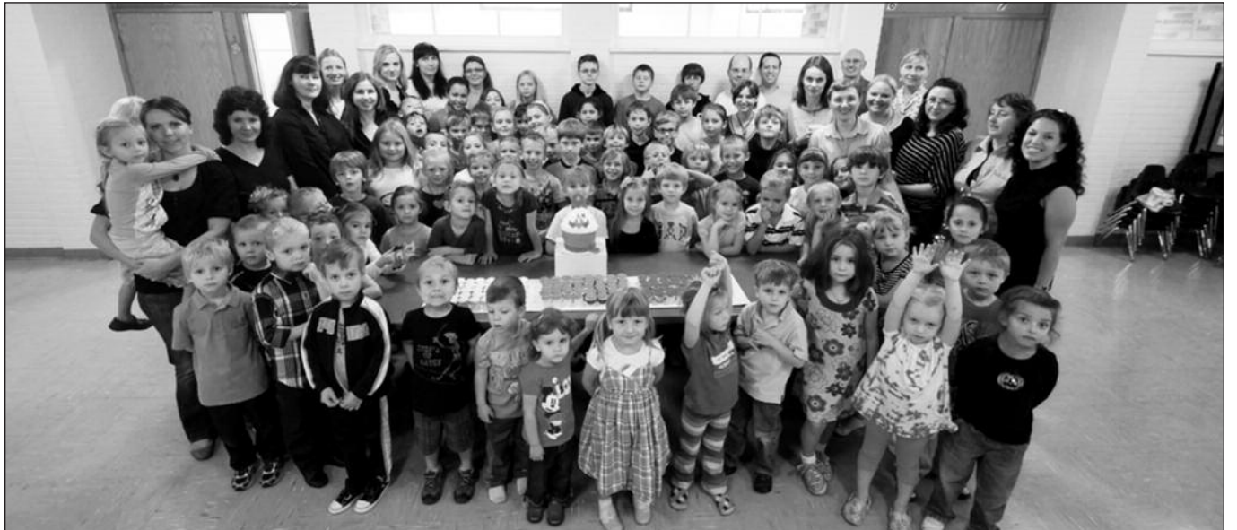
Mūsų – jau didelis būrys.