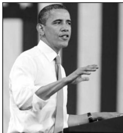
Prezidentas žadėjo tęsti santykius su Rusija „perkrovimą”, nepaisydamas permainingų Rusijos valdžioje.

Washington, DC (BNS) – Santykių „perkrovimo” politika, kurią vykdo JAV prezidentas Barack Obama, prieštarauja Amerikos siekiams ir vertybėms, mano JAV Kongreso Atstovų rūmų pirmininkas, respublikonas John Boehner. Pateikdamas JAV tarptautinės politikos įvertinimą, J. Boehner paragino B. Obama peržiūrėti požiūrį į santykius su Rusija, visų pirma atsižvelgiant į artėjantį premjero Vladimir Putin sugrįžimą į valdžią. J. Boehner nuomone, būtina atidėti seniai laukiamą Rusijos įstojimą į Pasaulinę prekybos organizaciją tol, kol Rusijos valdžia su Gruzija – JAV šalininke – nesusireguliuos konflikto, kuris privedė prie Rusijos ir Gruzijos karo 2008 m. J. Boehner taip pat mano, jog JAV administracija turi priversti Rusiją apriboti bendradarbiavimą su Iranu,