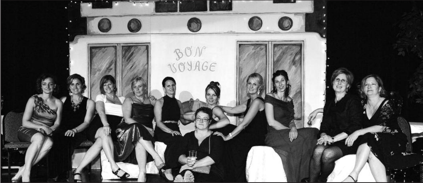
Pokylio organizacinio komiteto moterys susirinkusias „plukdė“ po įvairias pasaulio šalis.