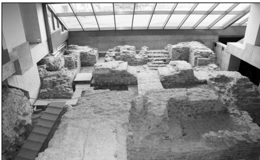
Senųjų statinių pamatai.