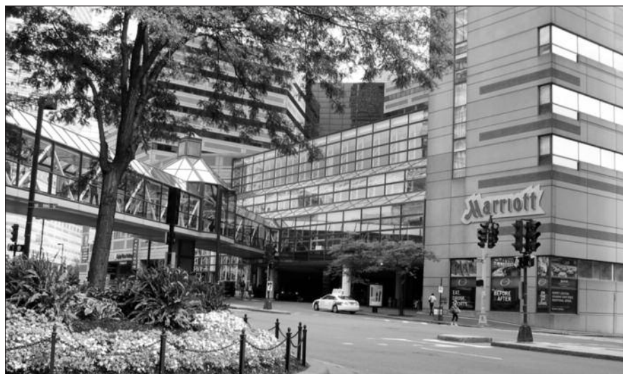
Viešbutis „Marriott Copley Plaza“.