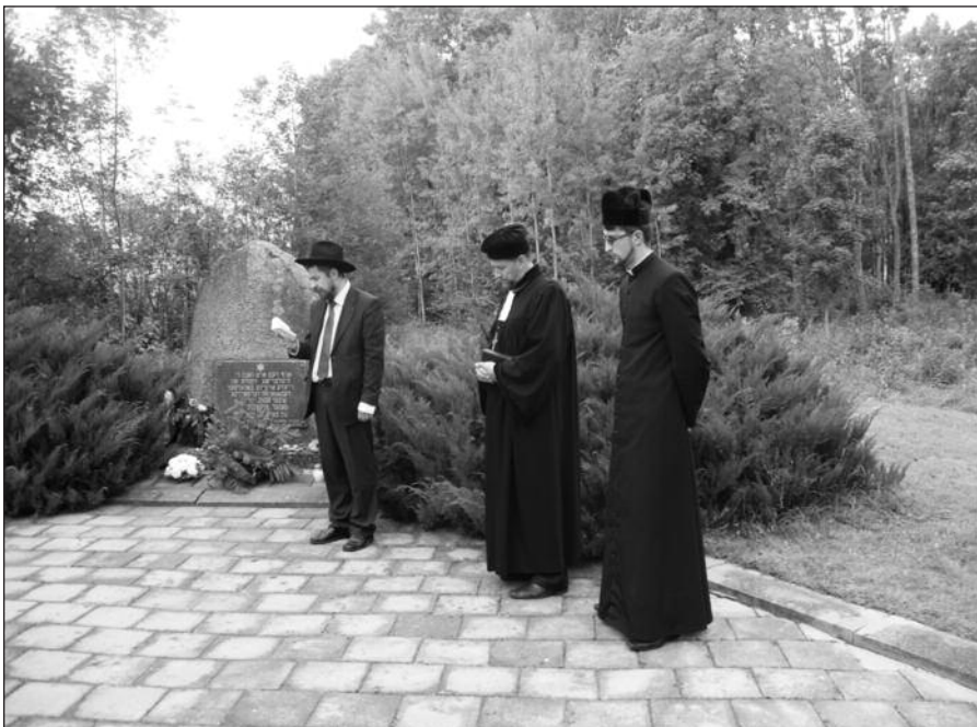
Pakamponyse įvyko bendra trijų religinių konfesijų malda.