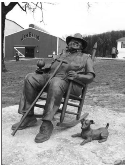
Jim Beam statula prie jo namo ir fabriko.