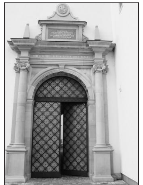
Įėjimas į rūmus.

Trečiajame aukšte esanti Didžioji renesansinė menė, priklausanti