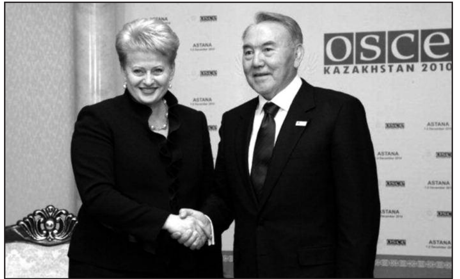
Lietuvos prezidentė D. Grybauskaitė susitiko su Kazachstano prezidentu Nursultanu Nazarbajevu.

Pasak prezidentės, Lietuva ir Kazachstanas pirmąją savo regionuose transporto ir logistikos srityse. Tinkamai išnaudojus jas jungiančių tarptautinių transporto koridorių galimybes, abi šalys taps svarbia transporto jungtimi tarp Europos Sąjungos ir Azijos. Lietuvos vadovės teigimu, iki šių metų pabaigos įgyvendinus tranzitinio konteinerinio traukinio „Sau-