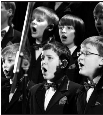
„Išgirdę dainuojant, prisijunkite, juk blogi žmonės nemoka dainų“ – 12 psl.