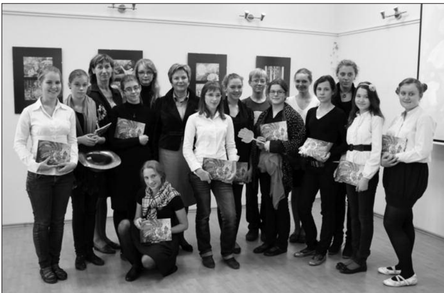
Prano Mašiotų knygos „Girdėta negirdėta“ iliustratorių autoriai.