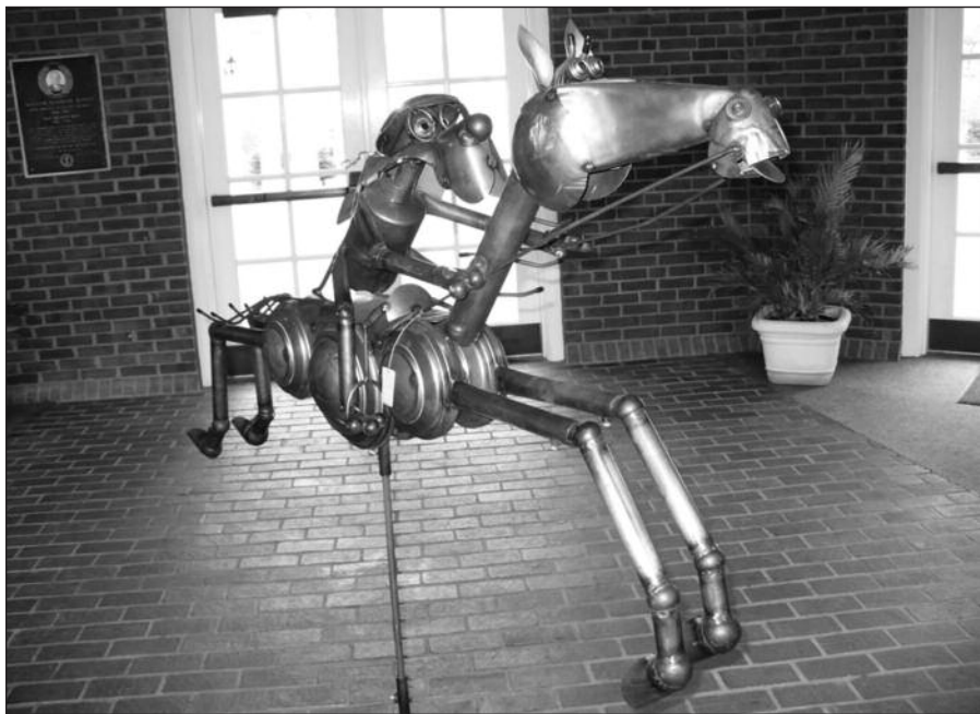
Jokiko statula prie registracijos stalo „My old Kentucky Home“.