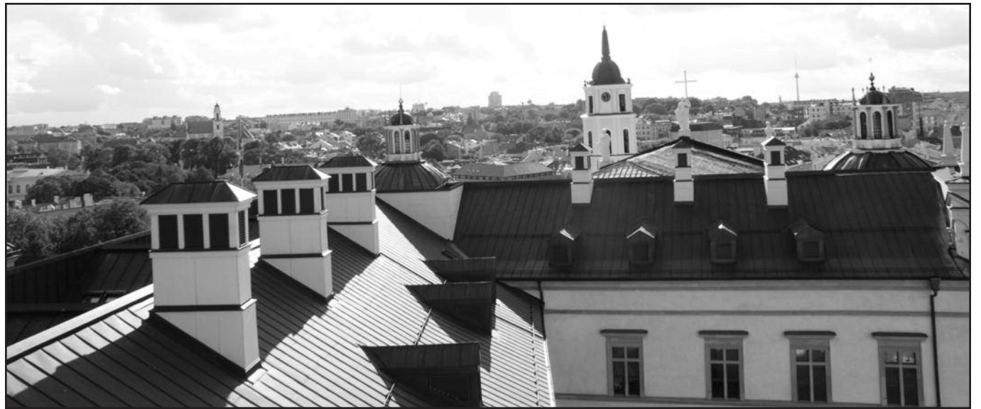
Vilniaus panorama pro bokšto langus.

Cokoliniame aukšte rodomi išlikę rūmų mūrai. Jie labai aiškiai atskirti nuo naujai pastatytų konstrukcijų, o anksčiau buvusios trys menės dabar sujungtos į vieną erdvę. Čia supažindinama ne tik su išlikusiais