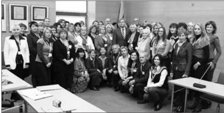
Seminaro dalyviai su užsienio reikalų ministru A. Ažubaliu.