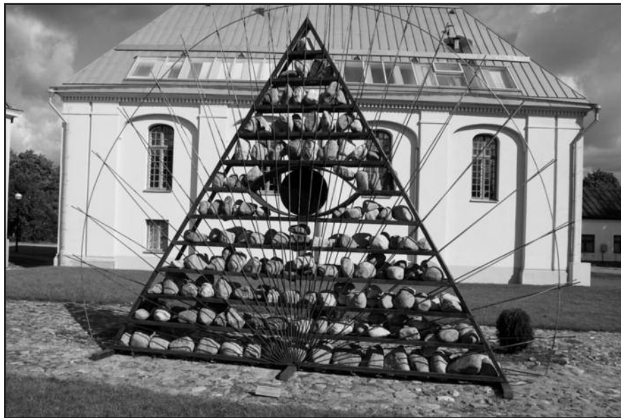
Paminklas žydų genocido aukoms Kėdainiuose.