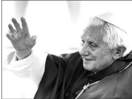
Popiežius Benediktas XVI Vokietijoje.

likų Bažnyčios atstovais. Susitikimas parodė, koks yra svarbus mums bendro tikėjimo liudijimas sekularizuotame pasaulyje ir kaip karštai turime prašyti Viešpaties suteikti krikščionių vienybės dovana, nes tai yra malonė, kurios patys sau negalime suteikti arba sukurti.