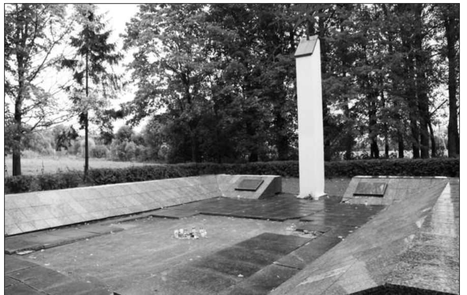
Holokausto atminimo vieta Vilkaviškyje.

Iš viso Antrojo pasaulinio karo metais naciai bei jų vietiniai pagalbininkai nužudė apie 90 proc. iš 220,000 Lietuvoje gyvenusių žydų tautybės žmonių.