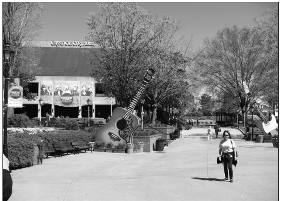
„Grand Ole Opry“.