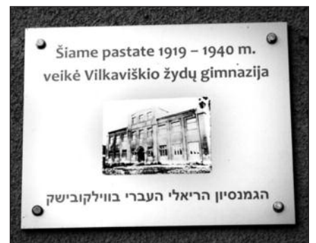
Atminimo lentelė Vilkaviškyje.

Žydų genocido aukoms buvo nusilenkta ir Marijampolėje, kur 1941 metų rugsėjo 1-ąją buvo sušaudyta apie 6,000 šios tautybės žmonių. Miesto kultūros rūmuose surengtos paskaitos apie žydų gyvenimą, jų tradicijas ir šventes, o kraštotyros muziejuje atidaryta paroda apie Marijampolės žydus fotografus – iki Antrojo pasaulinio karo beveik visi miesto fotografai buvo žydų tautybės, ir daugelio marijampoliečių se-