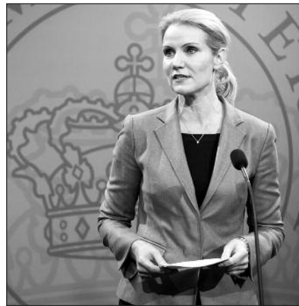
Naujoji Danijos ministrė pirmininkė, Socialdemokratų partijos vadovė Helle Thorning-Schmidt.

taip pat Raudonųjų ir žaliųjų aljansas – gavo 92 vietas 179 vietų Folketinge, o dešiniųjų centrinių opozicija – 87.