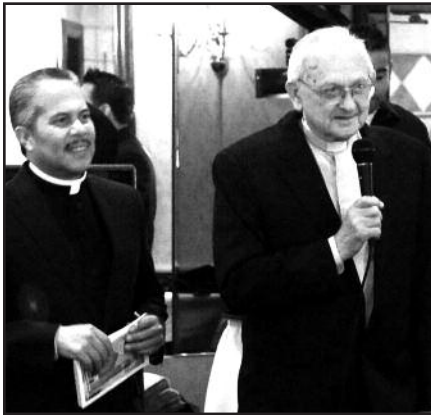
Lietuvių įsteigtos parapijos šimtmečio pobūvis – 4 psl.