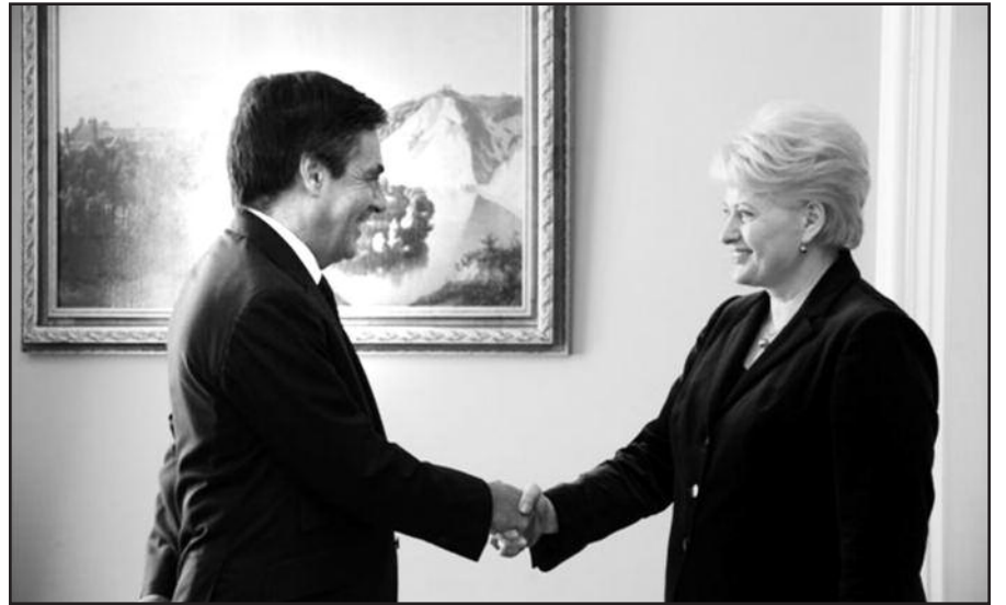
Lietuvos Respublikos prezidentė Dalia Grybauskaitė priėmė Prancūzijos Respublikos ministrą pirmininką Francois Fillon.

Aptardami Europoje susiklosčiusią ekonominę padėtį, Lietuvos vadovė ir Prancūzijos premjeras sutarė, jog tik bendrais ir suderintais veiksmais ES narės pajėgs pagerinti padėtį. Europos augimui ir konkurencingumui užtikrinti, pasak D. Grybauskaitės, taip pat ypač svarbi bendra europinė energetikos politika. Energetikos projektų įgyvendinimas pa-