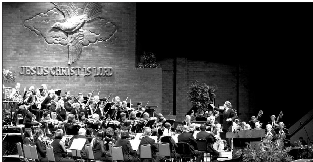
Riccardo Muti diriguoja Čaikovskij Penktąją simfoniją Apostolic Church of God bažnyčioje.