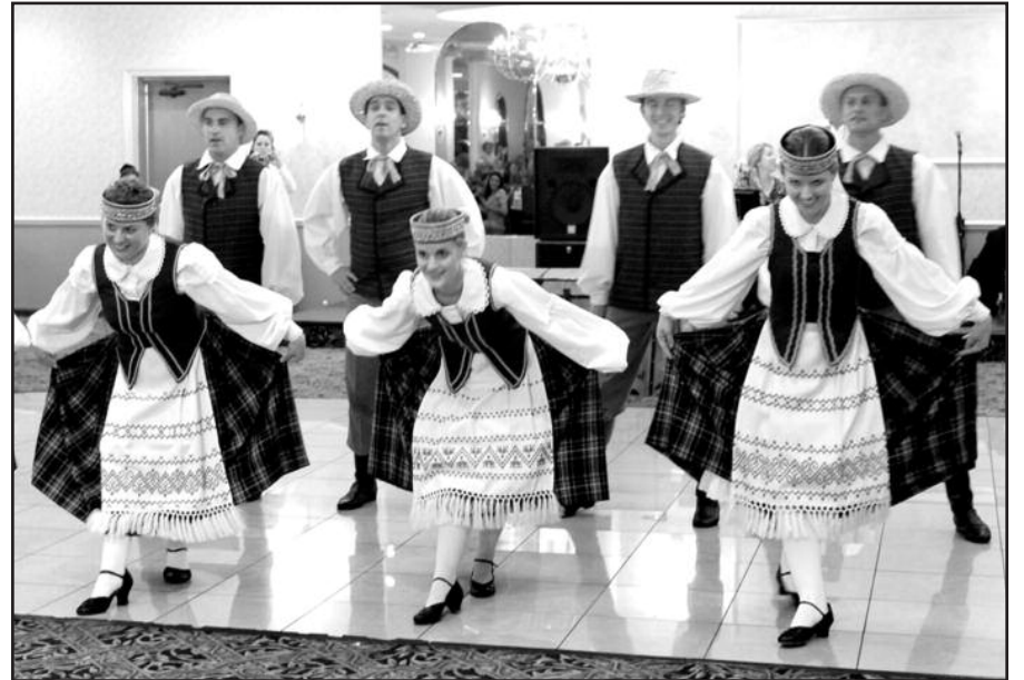
Svečius linksmino tautinių šokių grupės „Suktinis“ šokėjai.

Grabliauskai savo lietuviškoms dainomis bei šokių melodijomis pradžiuo lietuviškai kalbančius ir su šia parapija bendraujančius tautiečius, nepaisant to, kad pačioje parapijoje lietuviai dabar yra likę kam-