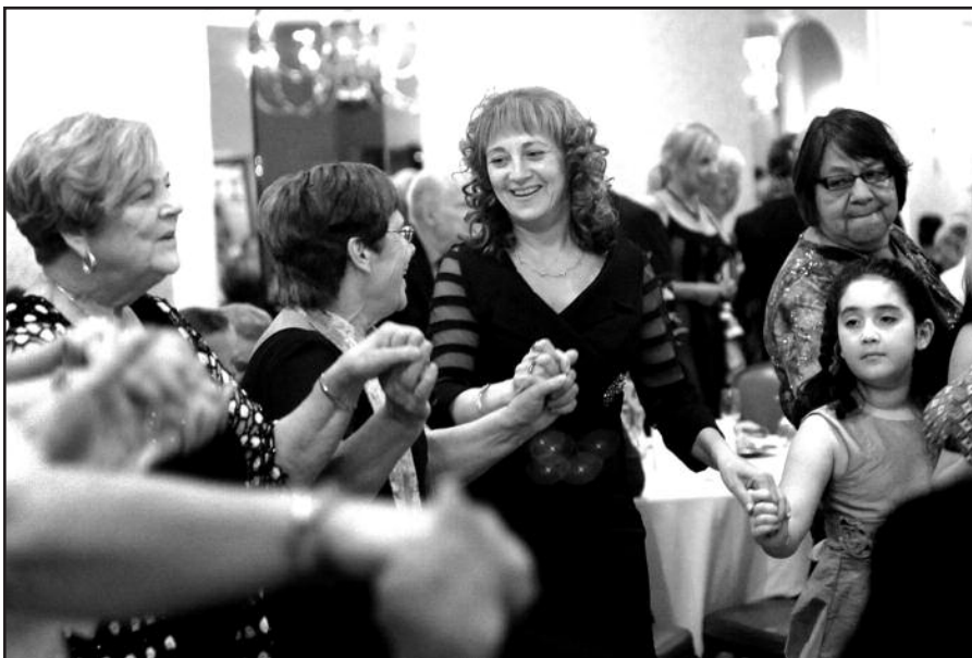
Šv. Antano parapijos šimtmetį švęsti susirinko gausus būrys svečių.