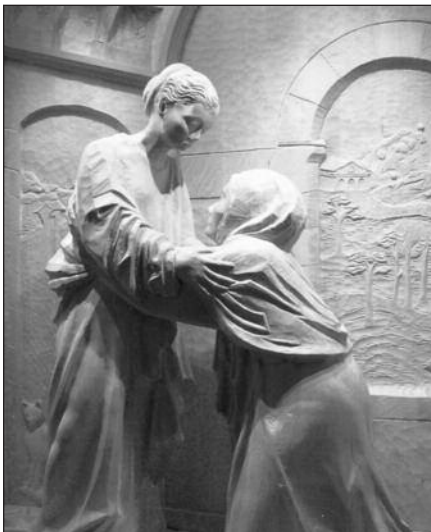
„Marija lanko šv. Elzbieta“. Medžio skulptūra „Prince of Piece“ bažnyčioje, Akron, OH.