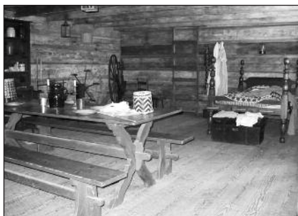
Indėnų gyvenamojo namo vidus.

Apsistoję jau šiaurinėje Chattanooga, TN pusėje, turėjome laiko pailsėti. Vėl nutarėme vakarienei pabandyti naują restoraną. Su GPS suradome „Dave's Cafe and Smokehouse“. Skamba gerai. Vos mylia kelio. Tad važiuojame ir privažiavome... tuščią pastatą, be durų ir langų.