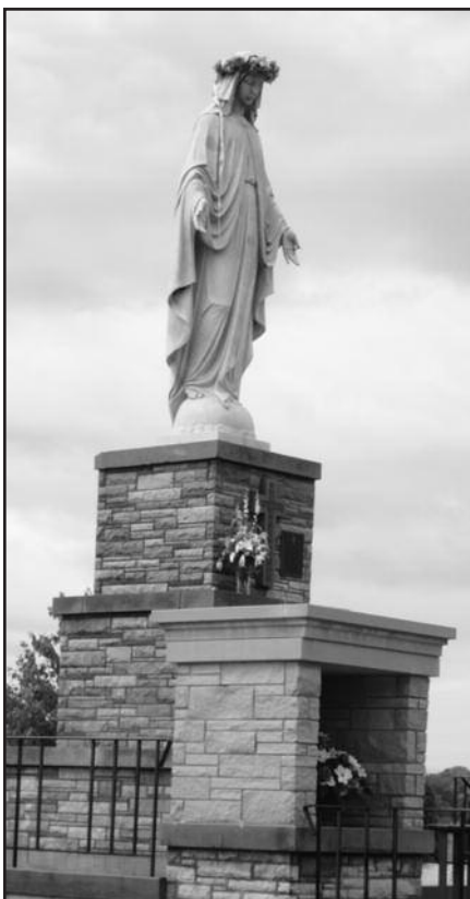
Dievo Motina Marija.

Baigėsi kelionė Kryžiaus keliu. Pasigėrėjimą kėlė aplinka. Viskas gražiai įruošta – žolė, medeliai, žalumai, atitinkanti anų laikų tikrovę. Kiekvienoje stotyje žydėjo pasodintos gėlės, daugybė rožių (daugiausia raudonų). Mus visus sujaudino matytas vaizdas. Išgyvenę į Viešpaties Jėzaus kančios apmąstymą, gal geriau suvoksime, kokia kaina esame atpirkti už nuodėmės.