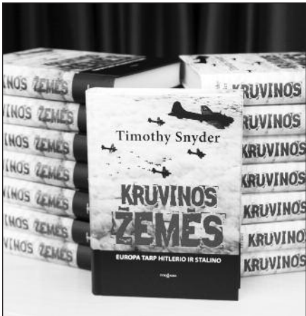
Timothy Snyder knyga „Kruvinos žemės. Europa tarp Hitlerio ir Stalino“.

„Ne dėl užmojų su kuo nors varžytis nuoskaudų dydžiu ar aukų skaičiumi, bet dėl žmogiškumo priedermės“, – pabrėžė ministras Užsienio