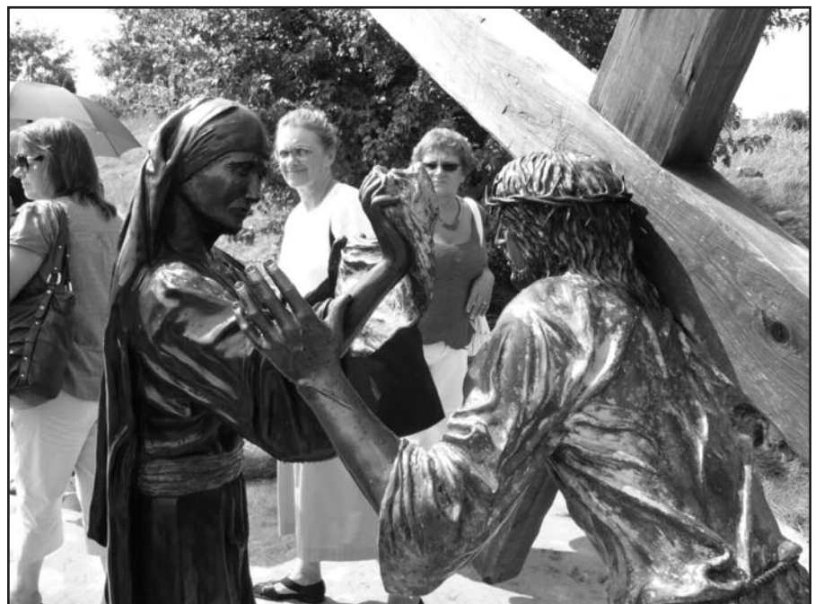
Veronika šluosto veidą Viešpačiui.

Lauke – gražiausia diena! Dangus mėlynas, be debesų, saulutė šviečia. Tikra Dievo dovana! Susėdome į autobusą ir važiavome žemyn į „Shrine of Christ's Passion“. Ten įsikūrę svečių namai, kuriuose dirba savanoriai ir kur galima nusipirkti įvai-