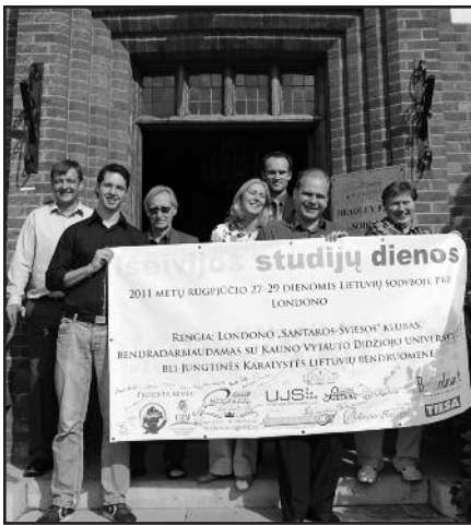
Išėjimos studijų dienos: nuotykių ir įspūdžių – 4 psl.