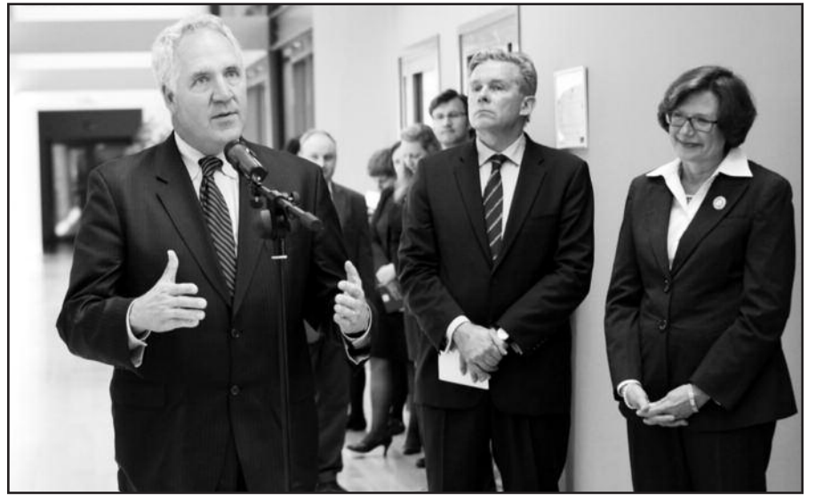
Kalba JAV Kongreso narys J. Shimkus.

Užsienio reikalų ministerijoje atidarytoje parodoje, surengtoje kartu su JAV ambasada Lietuvoje, pristatomos nuotraukos ir dokumentai, at-