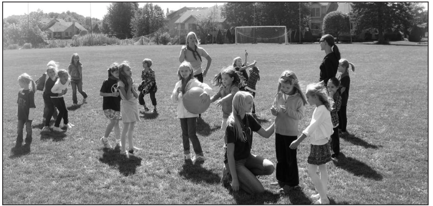
Paukštytės džiaugiasi pirmą sueigą, žaisdamos skautiškus žaidimus.