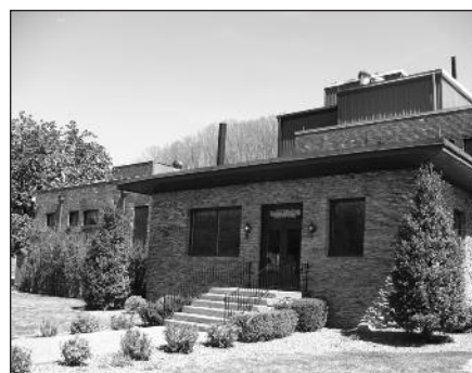
„George Dickel“ gamykla