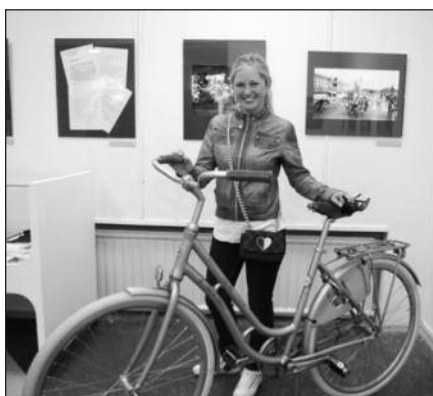
Penkamilijoninis „Baltik vairs“ dviratis.

Iškilingas penkamilijoninio dviračio perdavimas vainikavo Tarpautinės dienos be automobilio renginius Šiauliuose.