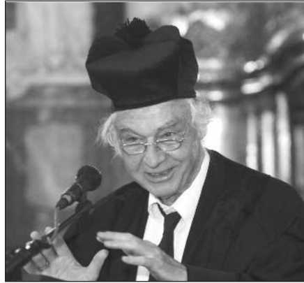
Nobelio premijos laureatas Robert Huber.

Garsiam pasaulio biochemikui R. Huber garbės daktaro vardas suteiktas už jau dešimtmetį palaikomus glaudžius ryšius su Vilniaus universiteto Biotechnologijos instituto mokslininkais. Paskatinti prof. R. Huber lietuviai Biotechnologijos instituto mokslininkai pradėjo baltymų molekulių erdvinės struktūros tyrimus. Remdamas šiuos darbus profesorius institutui padovanojo savo laboratorijos tyrimų įrangą ir aktyviai