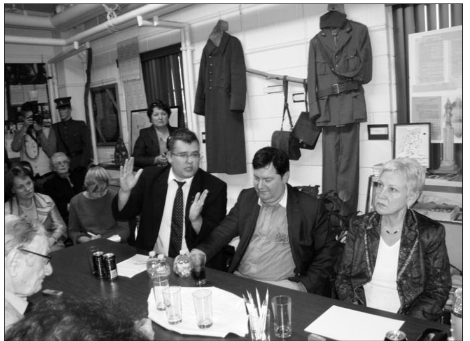
Susitikimas su Čikagos spaudos atstovais Balzeko lietuvių kultūros muziejuje.

Spaudos konferencijoje kalbėjęs LR Seimo Užsienio reikalų komiteto pirmininkas Emanuelis Zingeris, šio apsilankymo Washington, DC metu išrinktas antrai kadencijai pirminin- kauti Demokratinių Bendrijų foru- mui, sakė, jog net ir po 20 metų JAV lieka Lietuvos saugumo garantu. „Amerika yra pajėgi pasipriešinti toms grėsmėms, šalia kurių mes esame“, – sakė jis. Pasak Zingerio, Lietuvos Konstitucijoje įrašyta svar- bi nuostata, jog mūsų šalis negali orientuotis į Rytų sąjungas. Praėjus