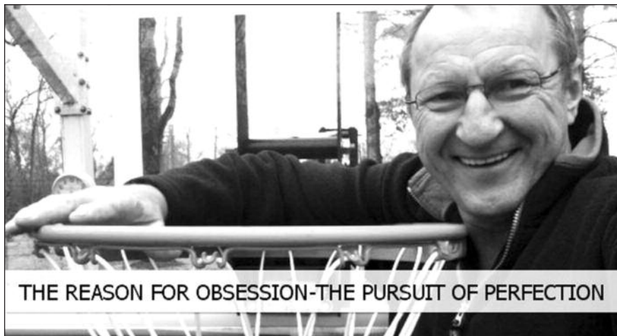
THE REASON FOR OBSESSION-THE PURSUIT OF PERFECTION

Kitas panašus pasaulio čempionatas vyks 2013 m. Liverpulio mieste Anglijoje.