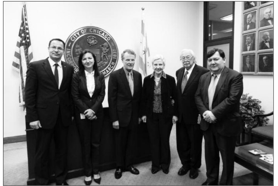
Seimo pirmininkė ir ją lydinti delegacija apsilankė Čikagos miesto merijoje.

Degutienės nuomone, vaisingas pokalbis vyko su JAV Kongreso pirmininku Boehner. „Pristačiau mūsų