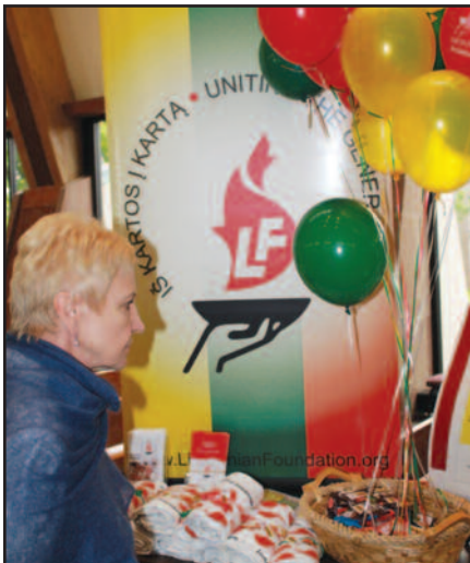
LR Seimo pirmininkės viešnage JAV – 4 psl.