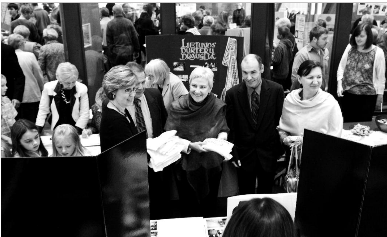
LR Seimo pirmininkė (viduryje) apsilankė Tarnysčių mugėje, Lemont.