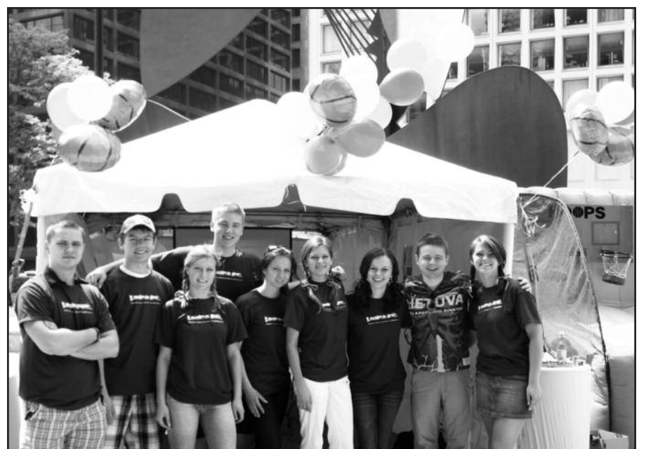
ŠALSS nariai padėjo surengti šventę „Lietuvos diena“ Čikagos miesto centre.