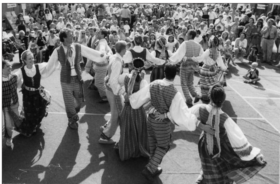
„Spindulio“ šokėjų šokio pynė.