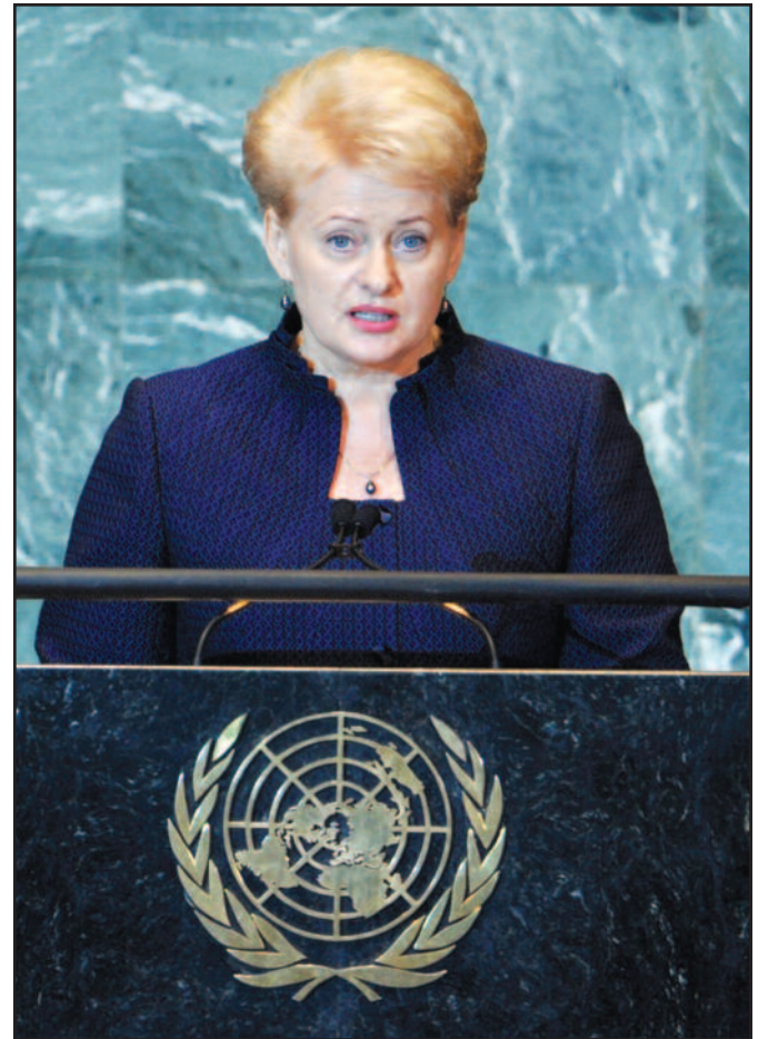
Lietuvos prezidentė D. Grybauskaitė pasakė kalbą JT Generalinės Asamblėjos 66-osios sesijos debatuose.

Prieš aukšto lygio susitikimą branduolinės saugos klausimais prezidentė D. Grybauskaitė kalbėjosi ir su Europos Komisijos prezidentu Jose Manuel Barroso, kuris taip pat pabrėžia, kad dėl branduolinio saugumo užtikrinimo būtini tarptautiniai susitarimai, pavyzdžiui, privalomos, o ne patariamiosios branduolinės saugos konvencijos. Nukelta į 10 psl.