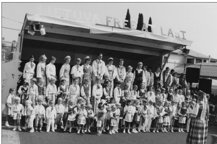
Šventėje kasmet dalyvauja Šv. Kazimiero lituanistinės mokyklos choras.