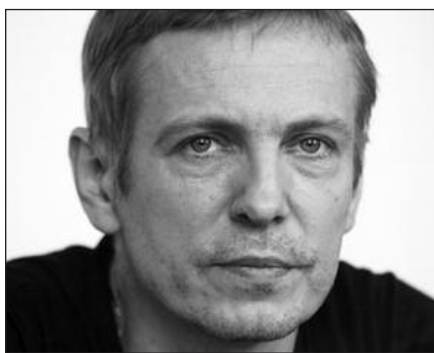
Režisierius Š. Bartas.

Vilnius (BNS) – Kultūros ministras Arūnas Gelūnas pritarė bažnyčios statybai prie Kryžių kalno Šiaulių rajone. Bažnyčia bus statoma Popiežiaus Jono Pauliaus II garbei prie Jurgaičių (Domantų) piliaikalnio, vadinamo Kryžių kalnu (Šiaulių r.). Projekto autoriai teigė, kad pastatas bus nedidelis, jis neužgoš Kryžių kalno. Bažnyčia bus statoma iš tikinčiųjų suaukotų lėšų.