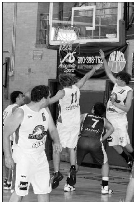
Akimirka iš pirmojo turnyro.

Kaip profesionalas, Artūras 8 metus žaidė Europoje – Prancūzijoje, Ispanijoje, Italijoje ir Graikijoje. 1996 m. jis buvo išrinktas Europos geriausiu krepšininku. Dabar A. Karnišovas yra NBA „Houston Rockets”