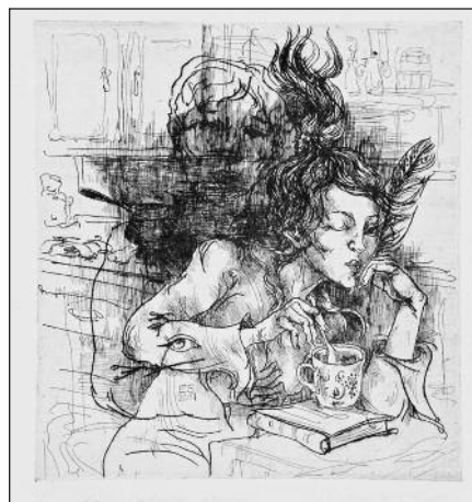
Editos Suchockytės kūrinys.

Varšuvoje, Lietuvos centre prie Lietuvos ambasados Varšuvoje, iki rugsėjo 2 d. bus galima aplankyti lietuvių menininkių grafikos parodą „Komunikacija“, kurioje darbus pristato Inga Dargužytė, Jolanta Sereikaitė, Edita Suchockytė, Neringa Žukauskaitė. Paroda, skirta paminėti Lietuvos Valstybės dieną, buvo atidaryta liepos 5 dieną.