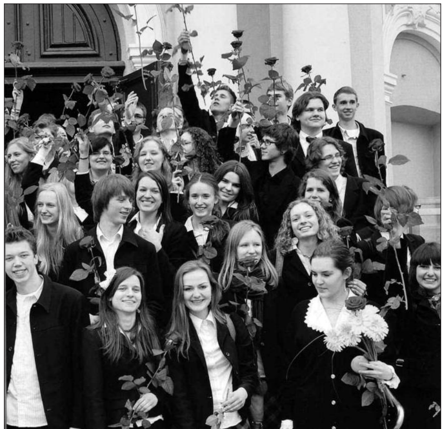
Vilniaus jėzuitų gimnazijos abiturientai.