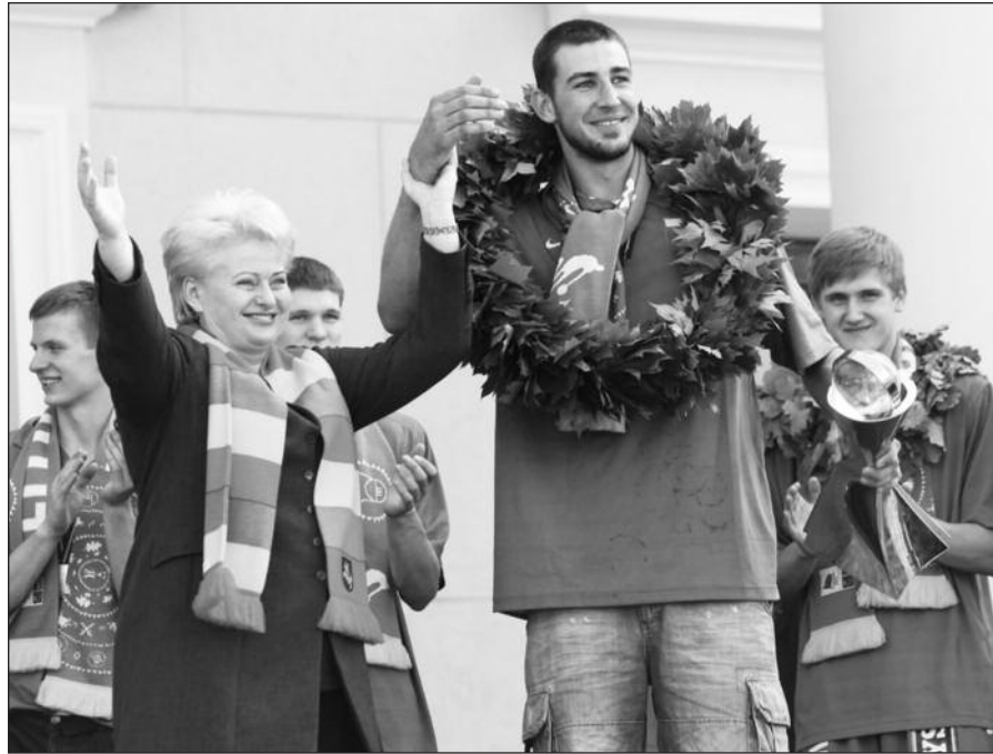
Pasaulio jaunimo krepšinio čempionus pasveikino prezidentė Dalia Grybauskaitė.

Lietuvos rinktinėje nesulaikomas buvo J. Valančiūnas, kuris žaisdamas be poilsio visas 40 minučių įmetė 36 taškus. Šis 211 cm ūgio vidurio puolėjas per devynerias rungtynes vidutiniškai pelnydavo po 23 taškus, atkovodavo po 13,9 nuo lentos atšokusio kamuolio bei sulaukydavo po