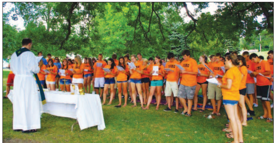
Liepos 13 d. Dainavoje, Manchester, MI prasidėjo Moksleivių ateitininkų stovykla.