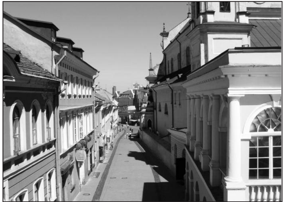
Komitetas siūlo Lietuvai labiau rūpintis Vilniaus centro išsaugojimu.

Svarstydamas Kuršių nerijos, kuri yra bendra Lietuvos ir Rusijos vertybė, klausimą, PPK išreiškė didelį susirūpinimą dėl Kaliningrado srityje sukurtos ekonominės vystymo zonos ir Kuršių nerijoje planuojamų didžiulių laisvalaikio pastatų