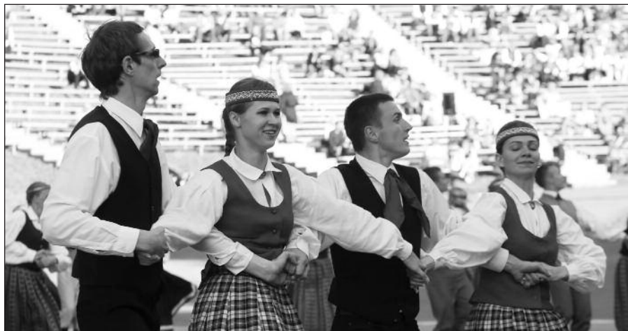
Vilniuje vyko šešiolikštasis Baltijos šalių studentų dainų ir šokių festivalis „Gaudeamus“.

Tokia operacija yra pirmoji Lietuvoje ir Baltijos šalyse. Tarptautinės širdies ir plaučių persodinimo organizacijos duomenimis, pasaulyje per metus atliekama per 3,200 širdies persodinimo operacijų, maždaug 3 proc. iš jų – pakartotinės.