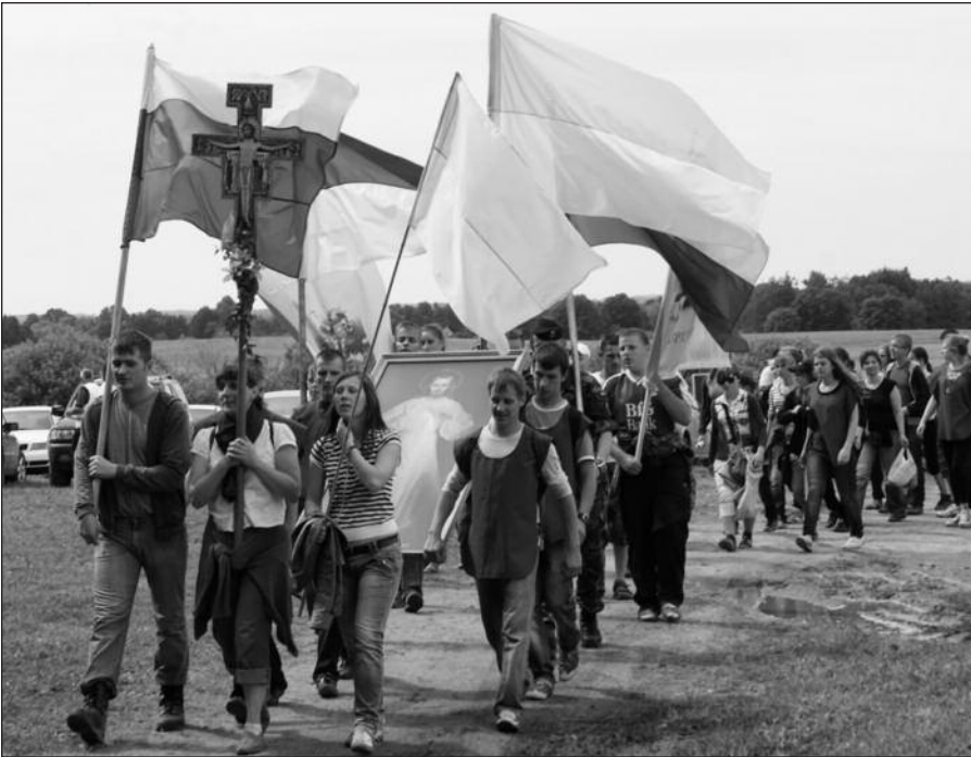
Pilgrimų eisena į kančios vietą.