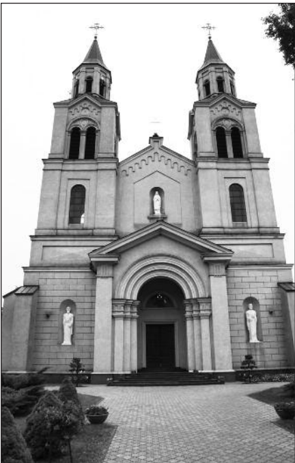
Vilkaviškio vyskupijos, minėtos 85-erių metų sukaktį, katedra.