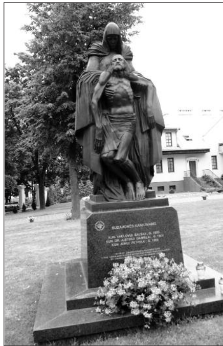
Paminklas nukankintiems kunigams katedros šventoriuje.