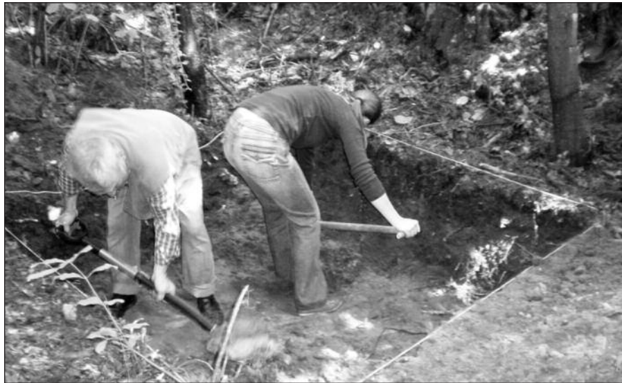
Tyrinėtojai kasa bandomąjį plotą.