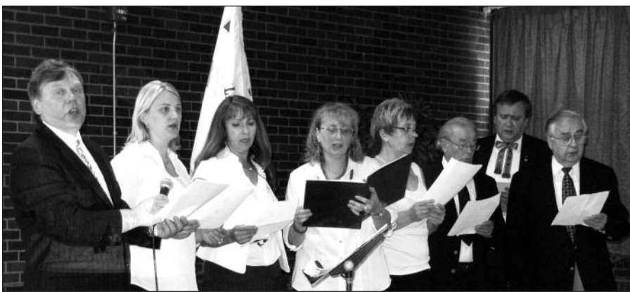
Brighton Park parapijos choro nariai dainuoja Sibiro tremtinių parašytas dainas.