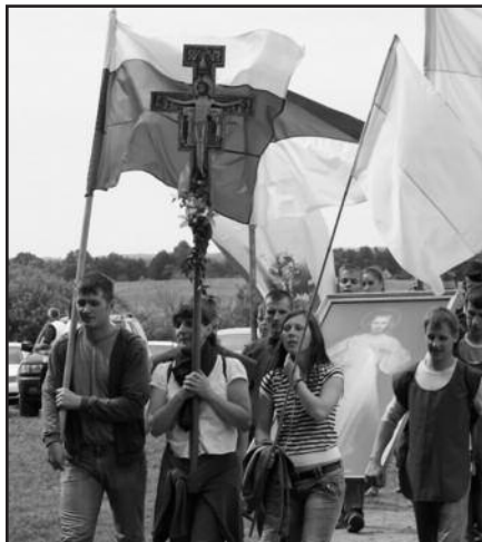
Paminėtos vyskupijos ir kunigų kankinių nužudymo metinės – 10 psl.