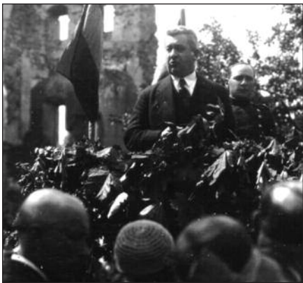
1931. 06. 28. Paminklo Jonušui Radvilai atidengimas. Kalba švietimo ministras Konstantinas Šakenis.

Kunigaikštis Jonušas Radvila (1612–1655) buvo viena ryškiausių savo epochos asmenybių, žymus politikas ir karvedys, kultūros mecenatas, išsilavinęs žmogus, evangelikų reformatų globėjas. Gavo gerą išsilavinimą, 1629–1631 m. studijuodamas Leipcigo, 1633 m. – Leideno universitetuose, mokėjo 4 kalbas. Anksti pradėjęs karjerą, 1646 m. jis jau lauko etmonas ir Žemaičių seniūnas, 1653 m. – Vilniaus vaivada, 1654 m. – didysis etmonas. Sėkmingai dalyvavo karuose su Bogdano Chmelnickio kazokais, ypač pasižymėjo karo žygio 1651 m. į Kijevą metu.