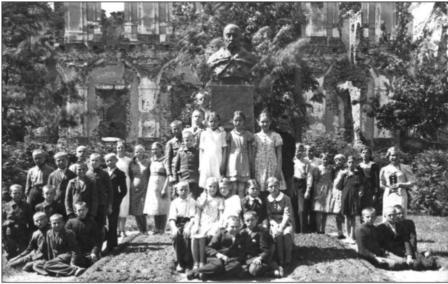
Biržų pradinės mokyklos „Aušra“ mokiniai prie Jonušo Radvilos paminklo Biržų piliakalnyje. 1939 m.