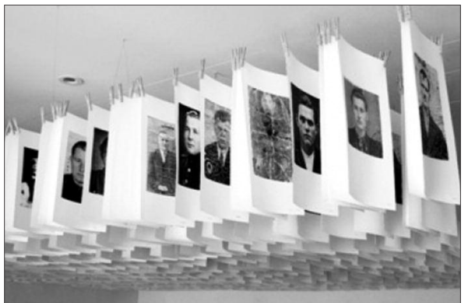
Kęstučio Grigaliūno instaliacija „1941“.