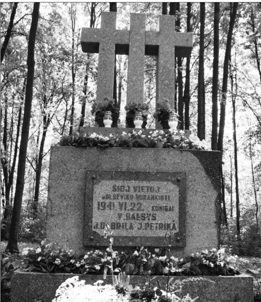
Atstatytas paminklas trims nukankintiems kunigams Budavonėje.