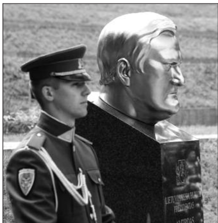
Paminklas prezidentui A. M. Brazauskui.

Vilnius (ELTA) – Minint pirmojo nepriklausomos valstybės prezidento Algirdo Mykolo Brazausko mirties metines, ant jo kapo Antakalnio kapinėse atidengtas paminklas. Lėšas skulptūrinei kompozicijai pastatyti skyrė Vyriausybė.