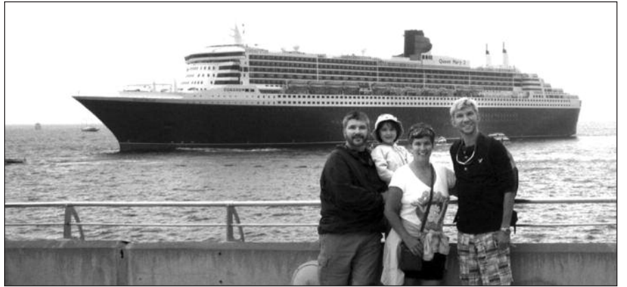
Pasiruošę plaukti karališko laivo priešaky.

Besistebint ir besizavint „Queen Mary 2“ dailia išvaizda, vaikščiojant plačiu, kaip kokia alėja, taku, negalėjai atsigerėti vyraujančia spalva, panašiai kaip Windsor pilyje iškloto raudonu raštuotu kilimu, sienomis, iš abiejų pusių išpuostomis aukso, sidabro ir bronzos spalvų metalo reljefais, vaizduojančiais žemynus. Pavyzdžiui, Afrikos žemynui atstovavo ilgakaklė žirafa, dramblys, liūtas, beždžionė bei kiti to krašto žvėrys ir