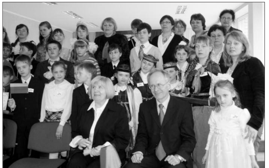
Olimpiados dalyviai ir svečiai.