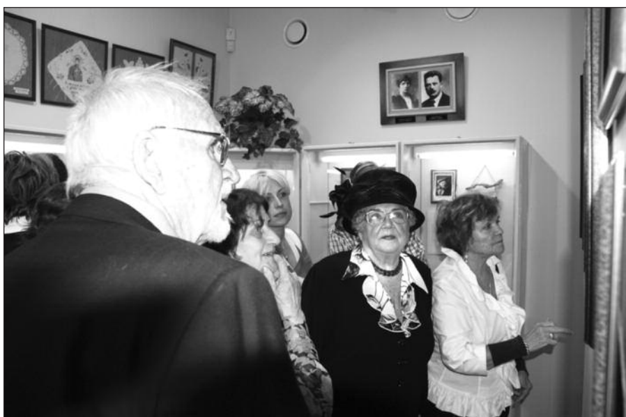
Apžiūrint naują parodą Paežerių dvare.