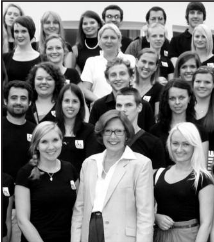
Programa, kurios dalyviai yra tikri ambasadoriai – 5 psl.