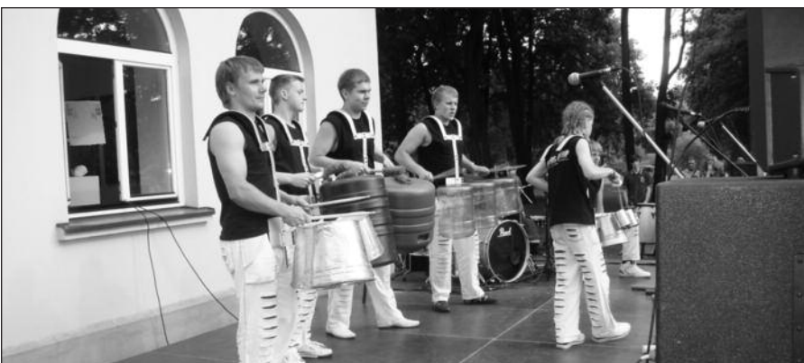
Koncertuoja šiauliečių būgnininkų grupė „Ritmas kitaip“.