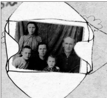
Kadras iš filmo „Gyveno senelis ir bobutė“.

■ Penktadienį, birželio 24 d. 7 val. v. Balzeko lietuvių kultūros muziejus maloniai kviečia į režisierės Giedrės Bendoriūtės sukurtą filmo peržiūrą „Gyveno senelis ir bobutė“ iš renginių ciklo „Nepalaužta dvasia“, skirto 1941 m. birželio trėmimų 70-osioms metinėms atminti. Filmo trukmė – 30 min. Subtitrai anglų kalba. Filmas taip pat bus rodomas birželio 25–30 dienomis 12 val. p. p. Muziejaus adresas 6500 S. Pulaski Rd., Chicago, IL. Muziejus atidarytas kasdien nuo 10 val. r. iki 4 val. p. p.