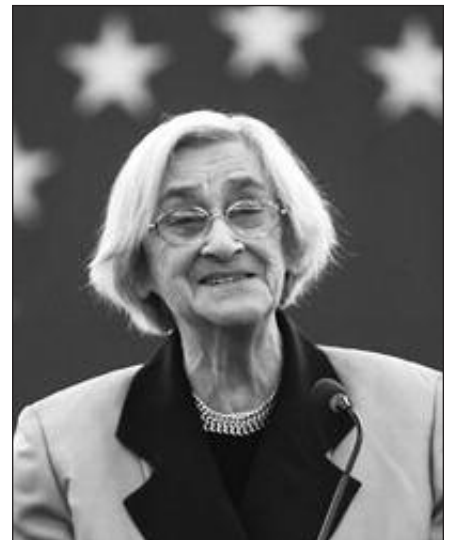
A. a. Jelena Bonner.

Iki šiol Libijos pereinamoji nacionalinė taryba mokėjo atlyginimus ir kitas išlaidas iš Libijos centrinio banko Bengazyje atsargų. Bet, pasak sukilėlių patarėjo, šie fondai jau iš-