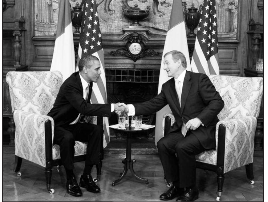
Dubline viešintis B. Obama gyrė Airijos taikos procesą.

Prancūzijos pajūrio kurorte Deauville, kur vyks Didžiojo aštuoneto (G-8) susitikimas, Jungtinių Valstijų vadovas susitiks su Prancūzijos prezidentu Nicolas Sarkozy, taip pat Rusijos prezidentu Dmitrij Medvedev ir Japonijos ministru pirmininku Naoto Kan. Lietuvos žiniasklaida skelbė, jog šiame renginyje turėtų įvykti ir ilgai lauktas Lietuvos Respublikos prezidentės Dalios Grybauskaitės susitikimas su B. Obama.