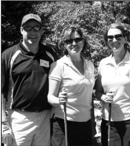
Prasideda golfo sezonas ir varžybos – 10 psl.