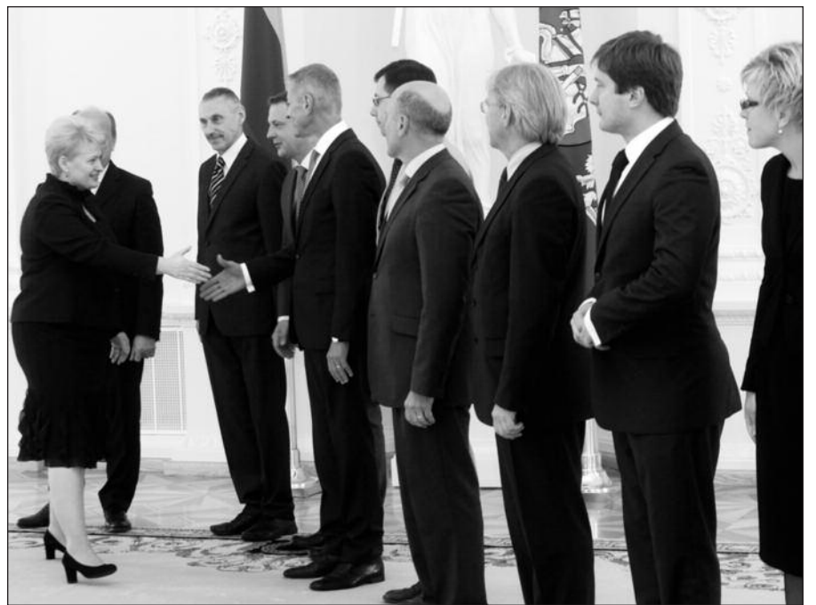
Prezidentės Dalios Grybauskaitės susitikimas su Vyriausybės nariais.