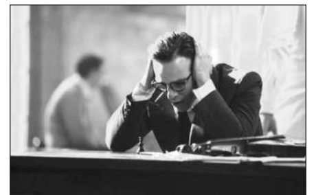
Pagrindinio vaidmens atlikėjas Charlie Cox.

Gyventi šventą gyvenimą kasdienybėje – pagrindinė „Opus Dei“ mintis. „Tai nėra sekmadienio reikalas“, – mokė Escriva. Tradiciškai žmonės manė, kad turi pasitraukti iš pasaulietiško gyvenimo – turi tapti kunigu ar vienuoliu. St. Josemaria sakė: „Ne, tą viską galima daryti kasdienybėje, kaip pirmieji krikščionys“.