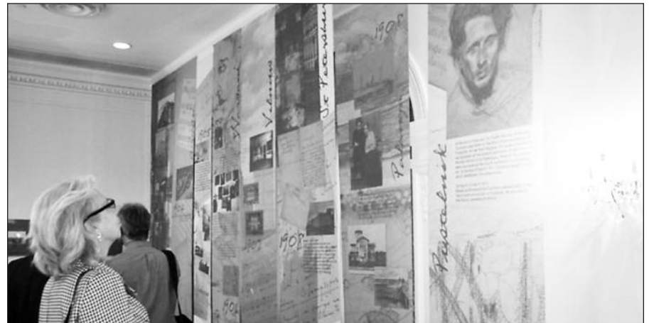
Balandžio 28 d. Lietuvos Respublikos ambasadoje Washington, DC atidaryta iškilus Lietuvos menininko Mikalojaus Konstantino Čiurlionio kūrybą ir gyvenimą pristatanti kilnojamoji paroda. Šiais metais minimos 100-osios M. K. Čiurlionio mirties metinės. Šia proga UNESCO 2011 m. yra paskelbusi M. K. Čiurlionio metais.