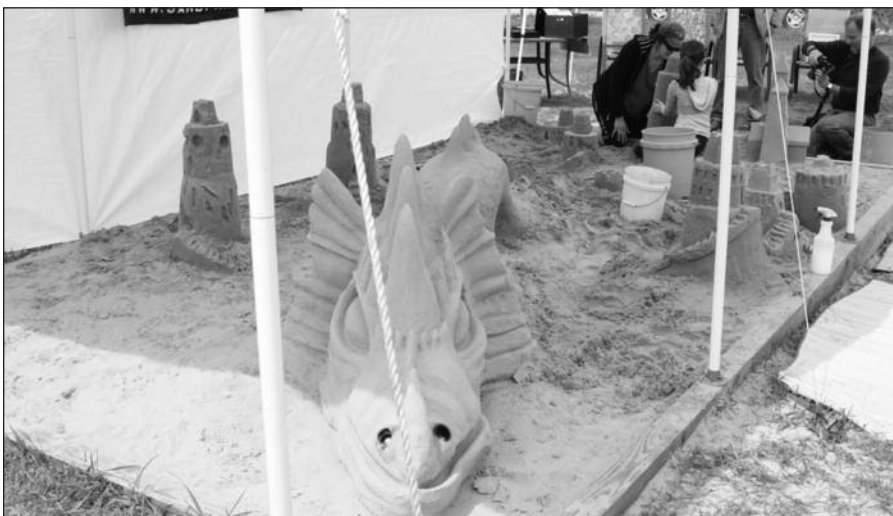
Smėlio darbai Gintaro vasarvietėje.