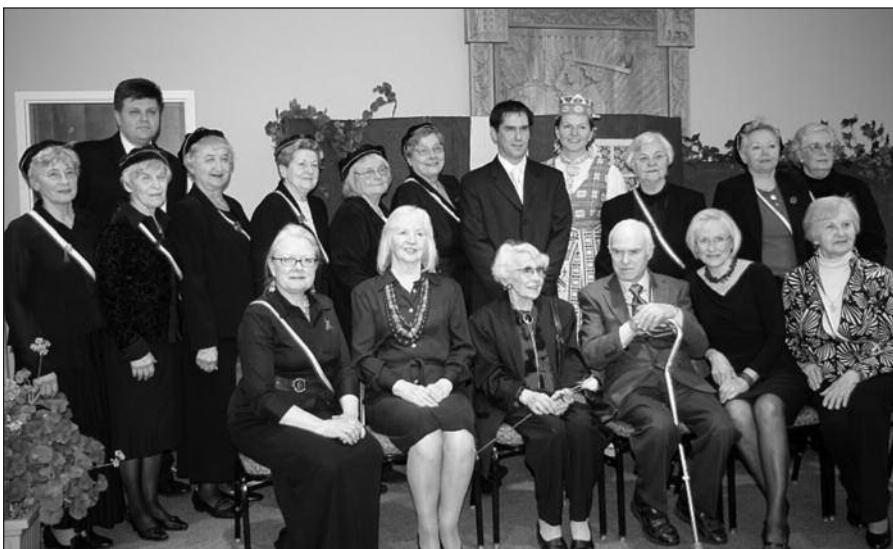
Vytauto Mačernio 90-mečio minėjimo programos ruošėjai ir dalyviai.